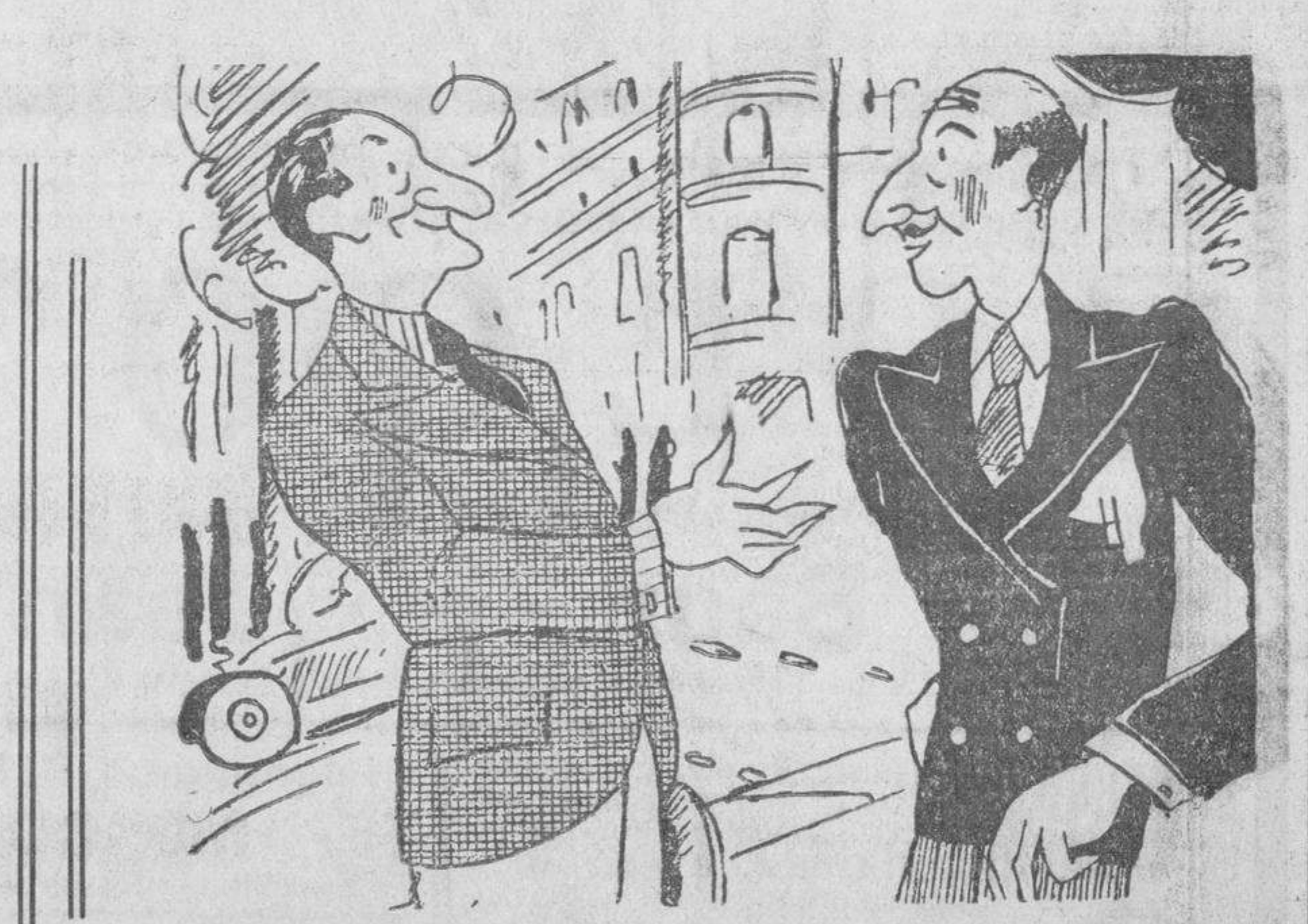
AMANTES DE LAS LETRAS —Yo soy un amante de las letras. —¡Ah! ¿Si? Pues voy a girarte una de dos mil pesetas.