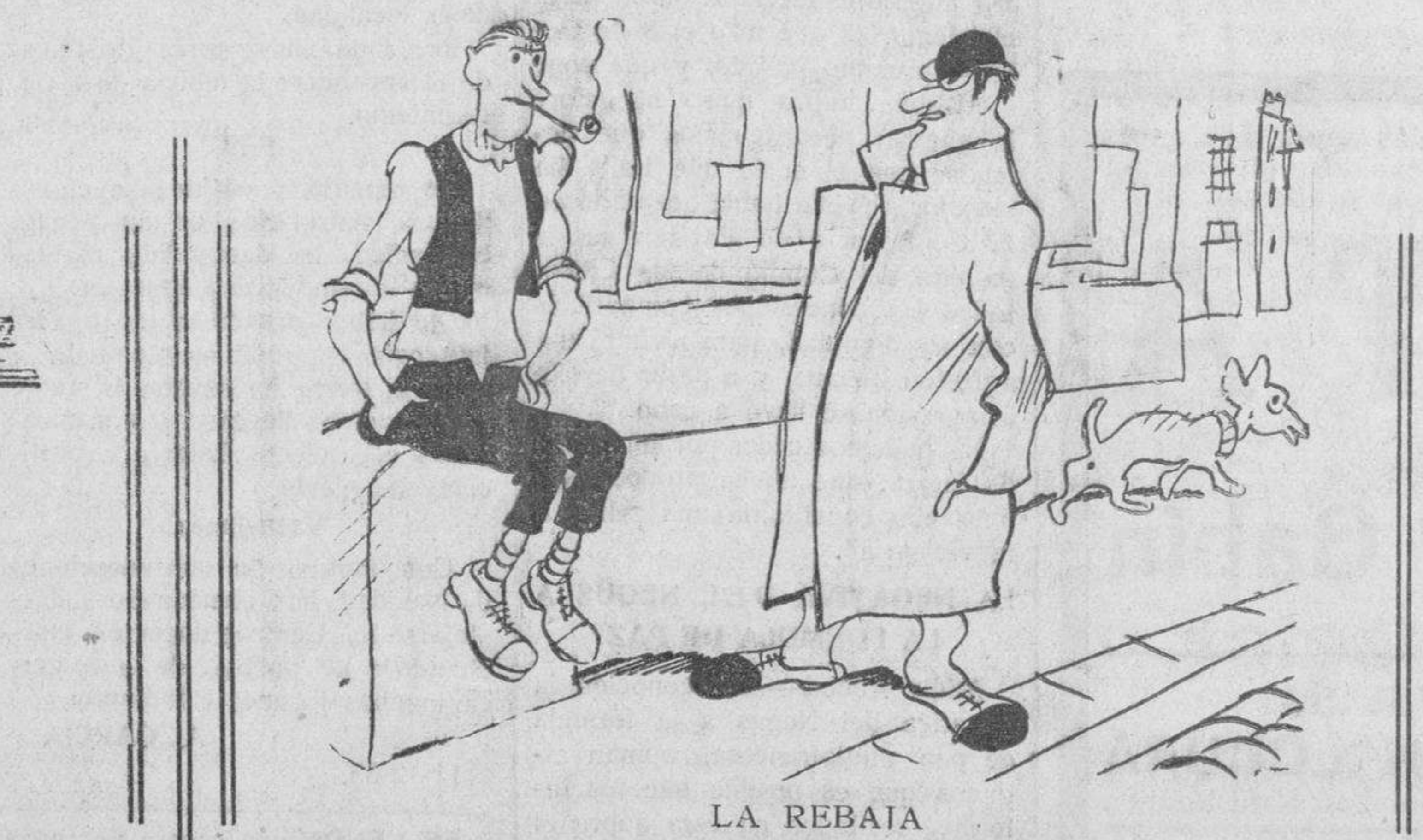
LA REBATA —¿Va usted de compras? Ya podía tomarme el perro. —¿Qué quiere por él? ¿Seis pesetas? —¿Pero ha pensado usted que soy un muerto de hambre? —Todo será cuestión de esperar...