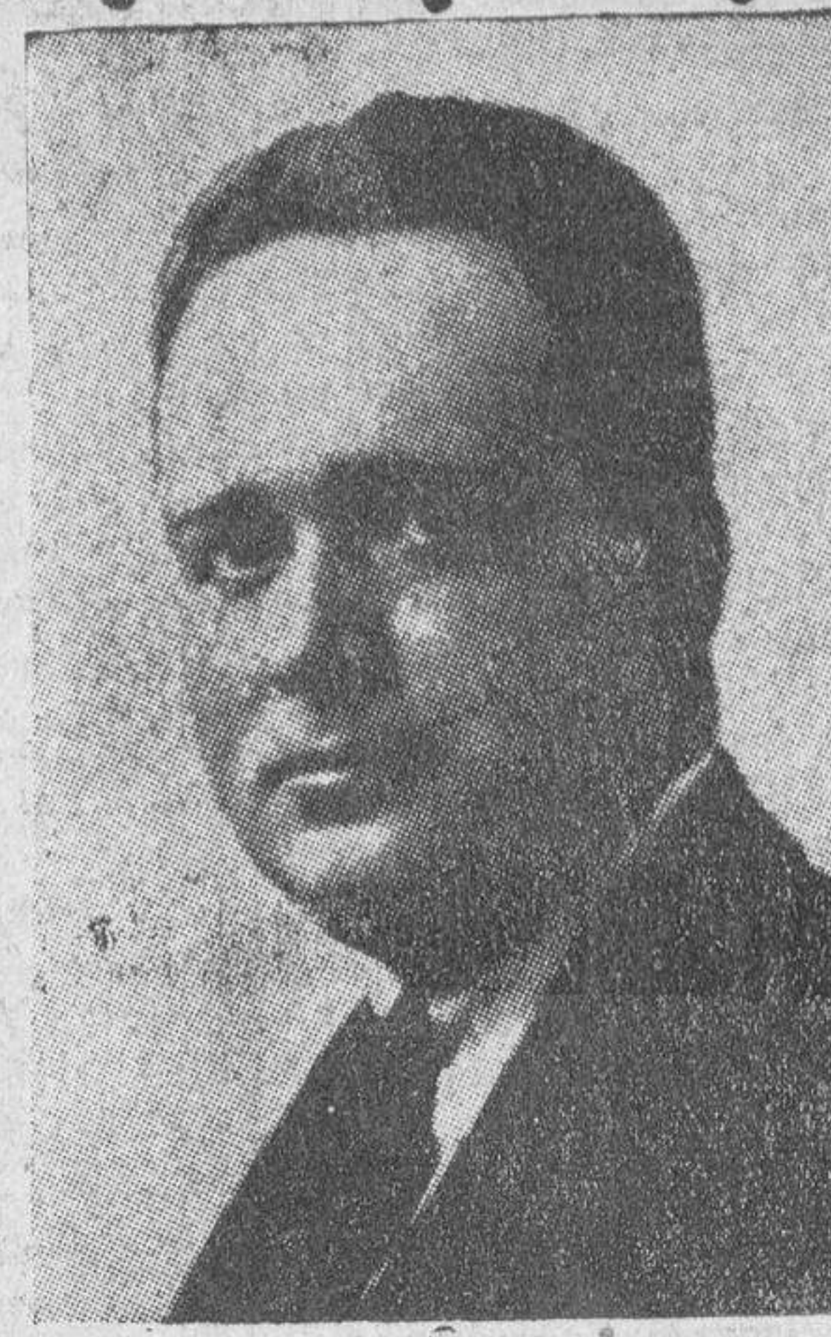
El prestigioso ingeniero don Juan de la Cierva y Codorniu, inventor del autogiro, a quien ha sido concedida la Medalla de Madrid