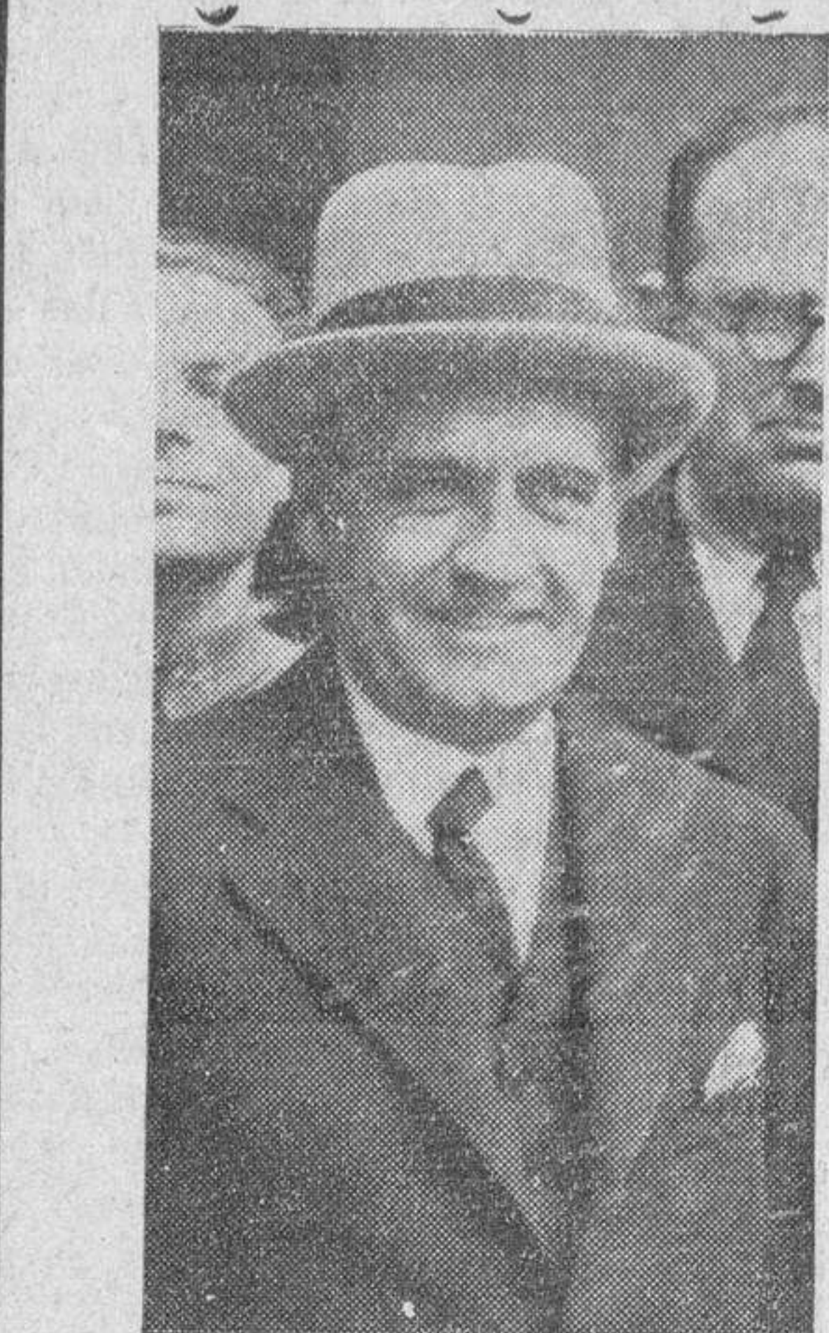
El ilustre catedrático y publicista, don José Ortega y Gasset, a quien ha sido concedida la Medalla de Madrid