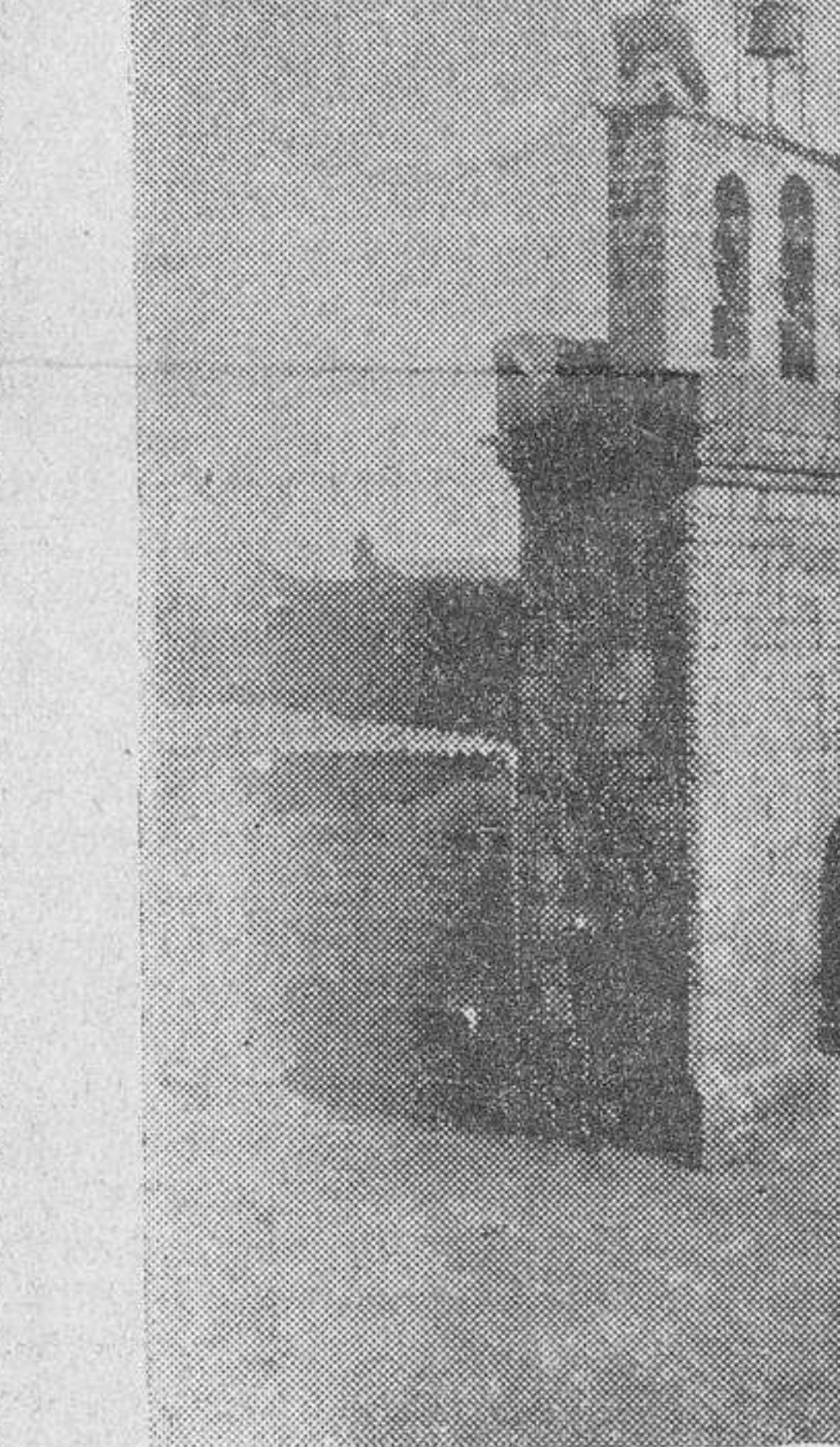
La típica torre de Villavieja

no se amortigüe el culto a la tradición. La devoción que profesamos a lo vernáculo, ese constante anhelo en nosotros de rememorar la vida de un lejano ayer, ya movieron más de una vez nuestra pluma a pedir al Ayuntamiento de ese nuestro pueblo, que aprovecharse los elementos de ese rico "fol-klore", y reconstituyc, dándole forma, un museo de traje regional en todas sus variedades de edades y sexo, museo adicionado con las típicas industrias del curtido, con objetos de arte popular—producto de la paciencia de cabreros y pastores—y