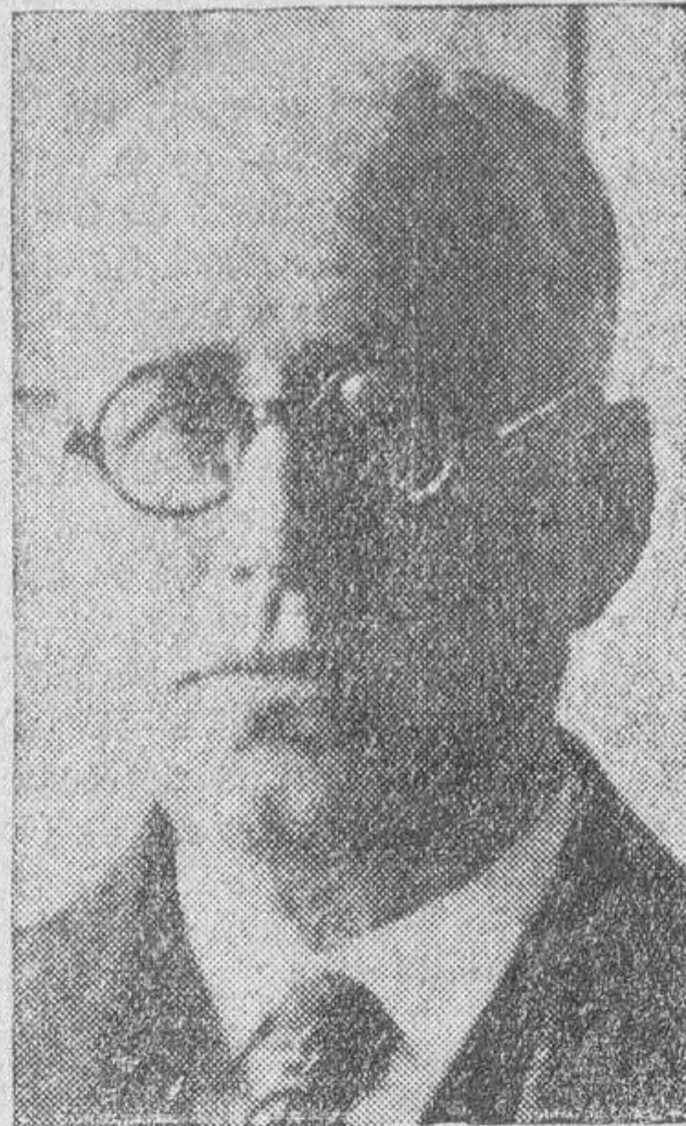
El ilustre escritor y crítico, don Enrique Díez Canedo, que mañana leerá su discurso de ingreso en la Academia Española