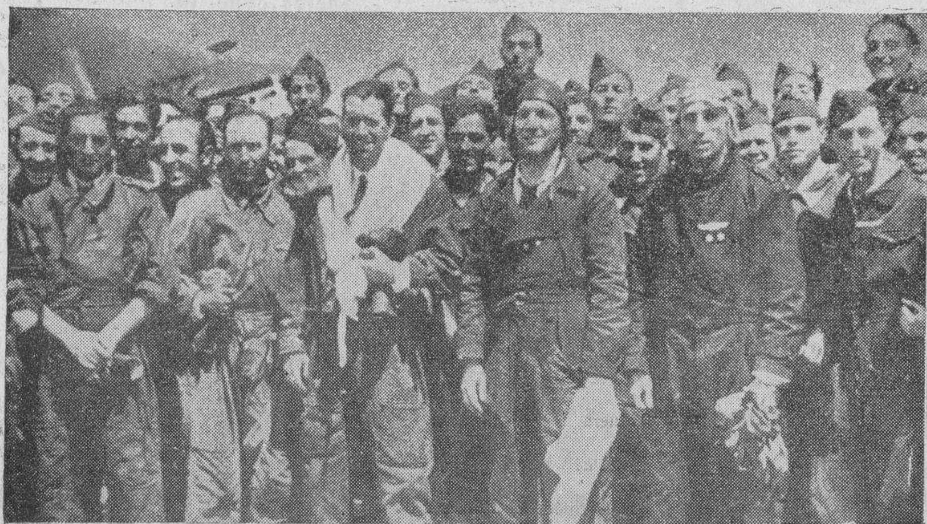
Los aviadores que forman parte de la primera escuadrilla de aviones de caza, vencedores de la etapa Madrid-Los Alcázar-Madrid

CONTINUA ESTA INFORMACION EN LA PAGINA SIGUIENTE