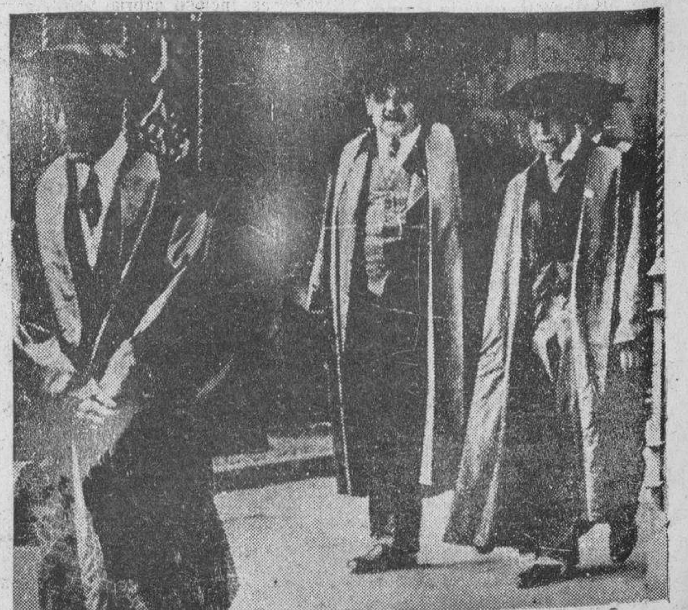
Nombrados recientemente doctores «honoris causa» de la Universidad de Oxford los señores duque de Alba y Herriot, ya han recibido la investidura. En la foto puede verse a los señores de la Universidad, acompañados del señor Bledisloe de Lidney