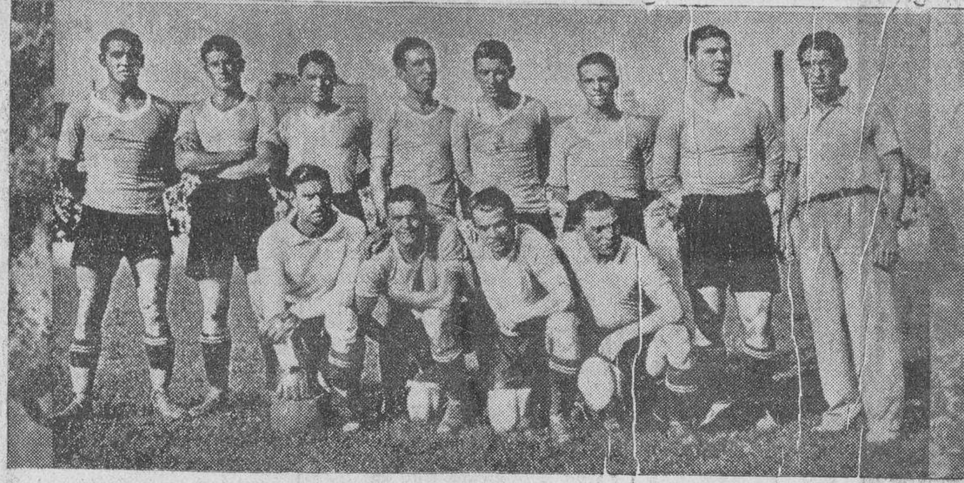
El equipo del Sabadell, que esta tarde se disputará con el Sevilla el título de campeón de España

se encontraban antes de la República quedaron bien vacías en cuanto los socialistas hicieron política obrerista, sin contar con que a la vez, bajaron los ingresos y la recaudación.