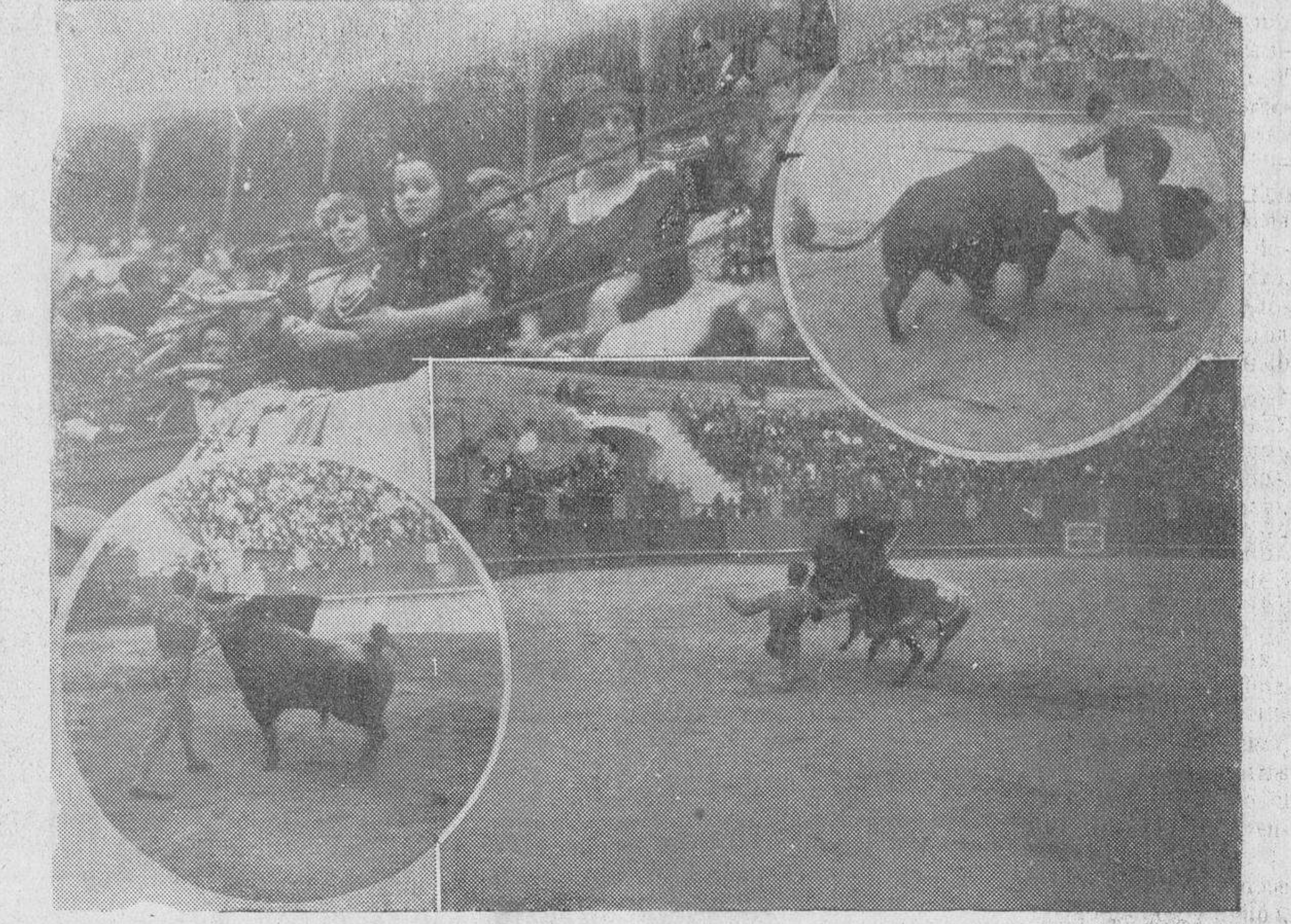
Arriba, a la izquierda, la única alegría de la fiesta: las mujeres; a la derecha, Lorenzo Garza. Abajo, a la izquierda, Armillita; a la derecha, Domingo Ortega.

Sopla el viento. Uno por bajo, ahora por alto, ayudado, superior. Más pases cerca y sufre un desarme. El toro embiste fuerte y con la cabeza alta, saca genio y ca-molechea.