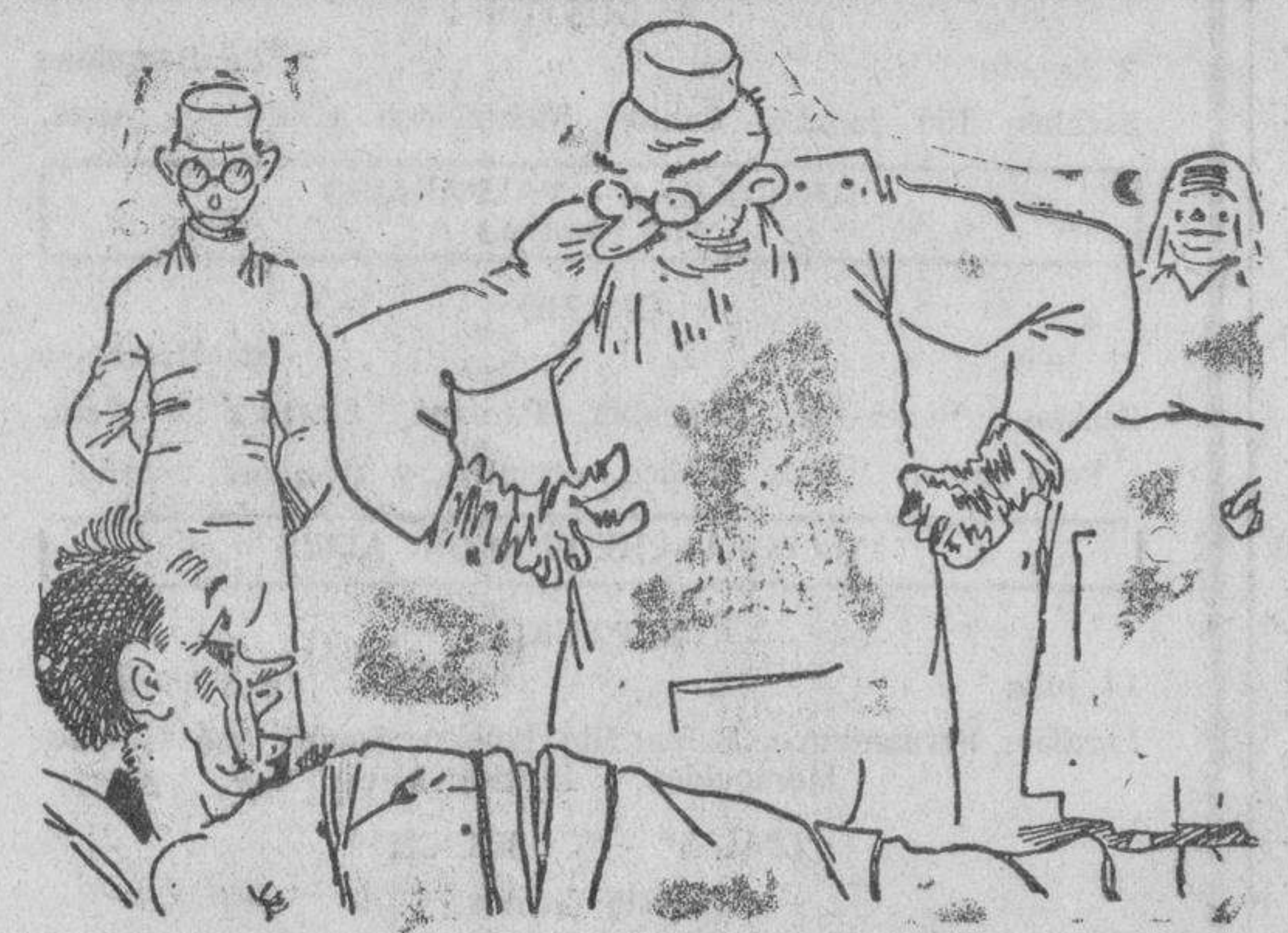
EL SONDEO DIARIO

La diferencia refleja, esa es la verdad, la salida de alejamiento de los socialistas del Ayuntamiento. Porque no hay duda que han laborado para el pueblo, para que coma el pueblo, haciendo obras hasta donde no había posibilidad de hacerlas técnicamente hablando, pero las cajas del Ayuntamiento que tan brillantemente dotadas