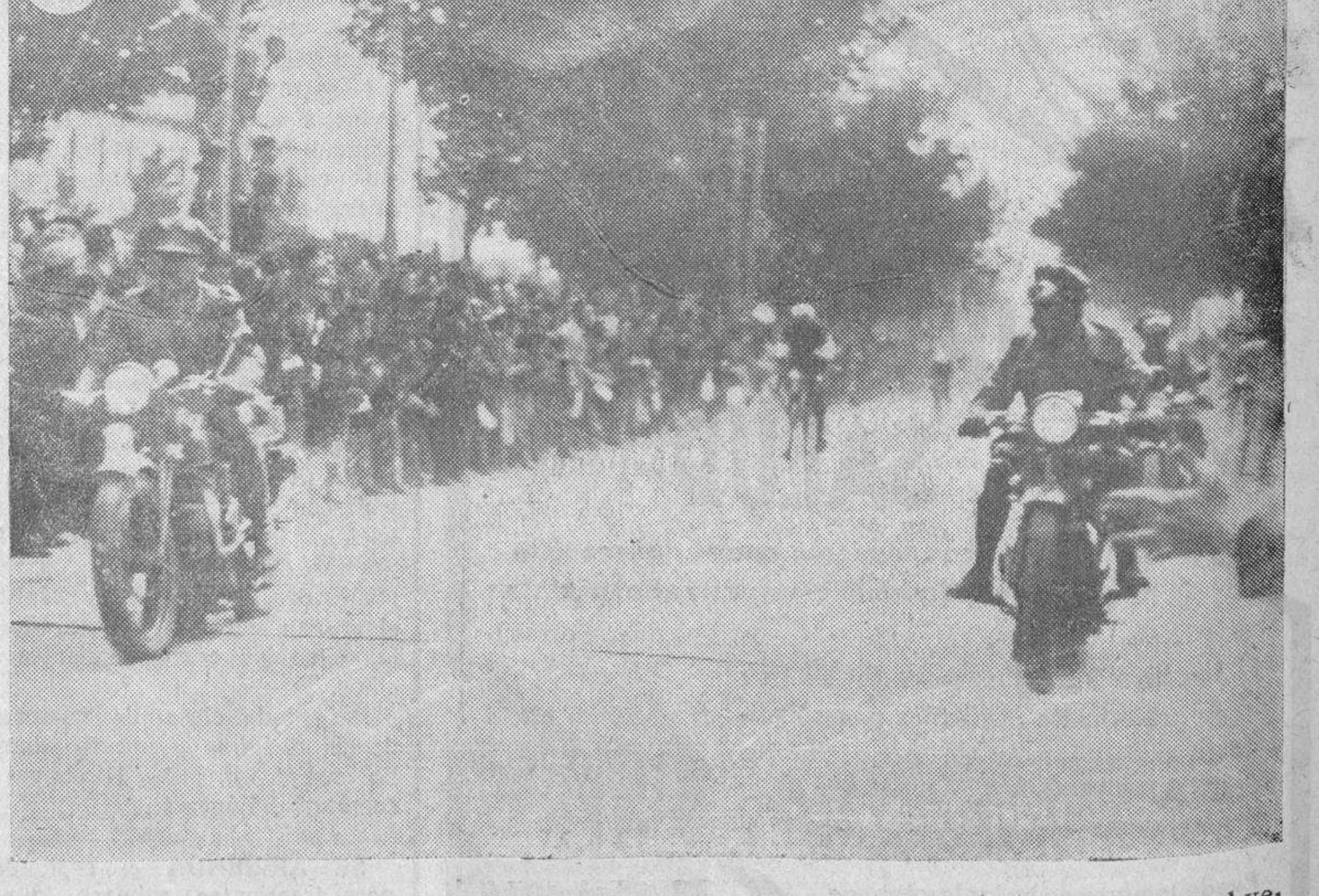
El belga Digneff llega destacado a la meta de Salamanca. Unos metros detrás, Cardona, el veterano corredor español