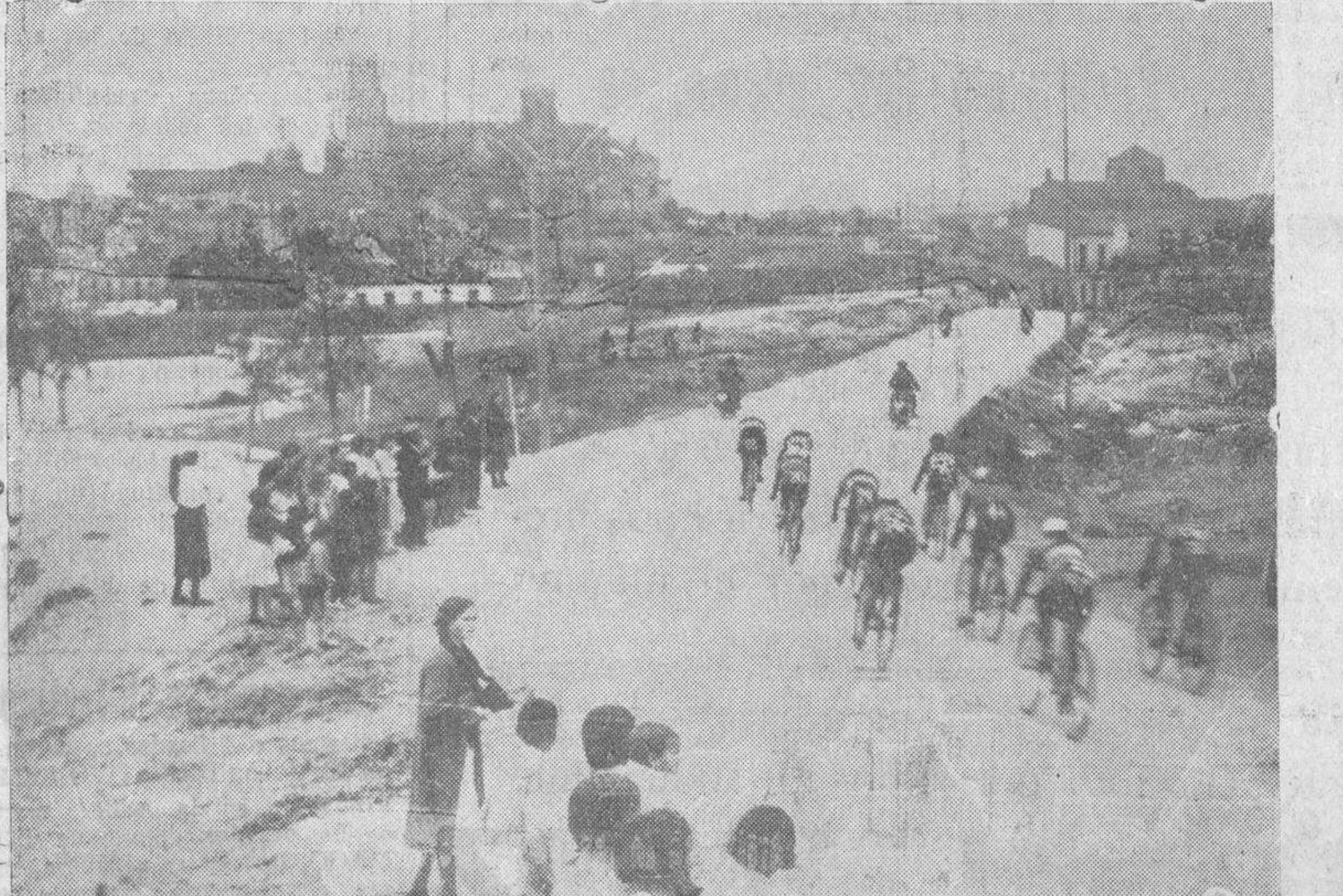
El pelotón de cabeza, al dar vista a Salamanca