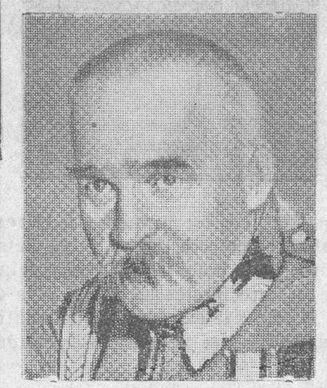
El Mariscal Pilsudski, de cuyo fallecimiento en Varsovia, dimos cuenta en nuestro número de ayer

Las gestiones que se hagan de hoy a mañana serán en torno a estos puntos, y de la impresión, promesas o seguridades que se lleven a la minoría, dependerá la actitud y resolución de ésta.