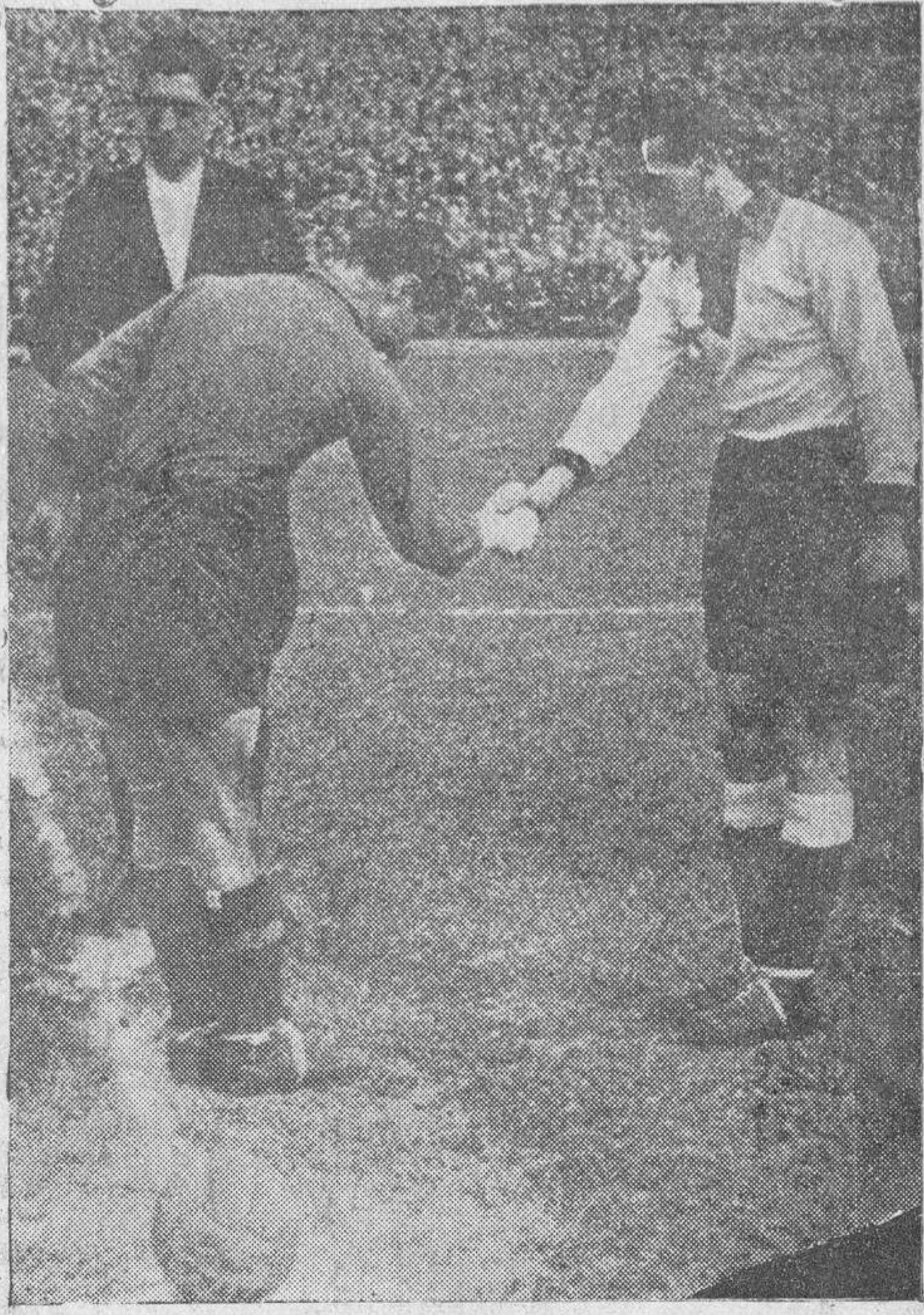
Los capitanes de los equipos español y alemán, cambiándose los saludos de rigor antes de comenzar el partido