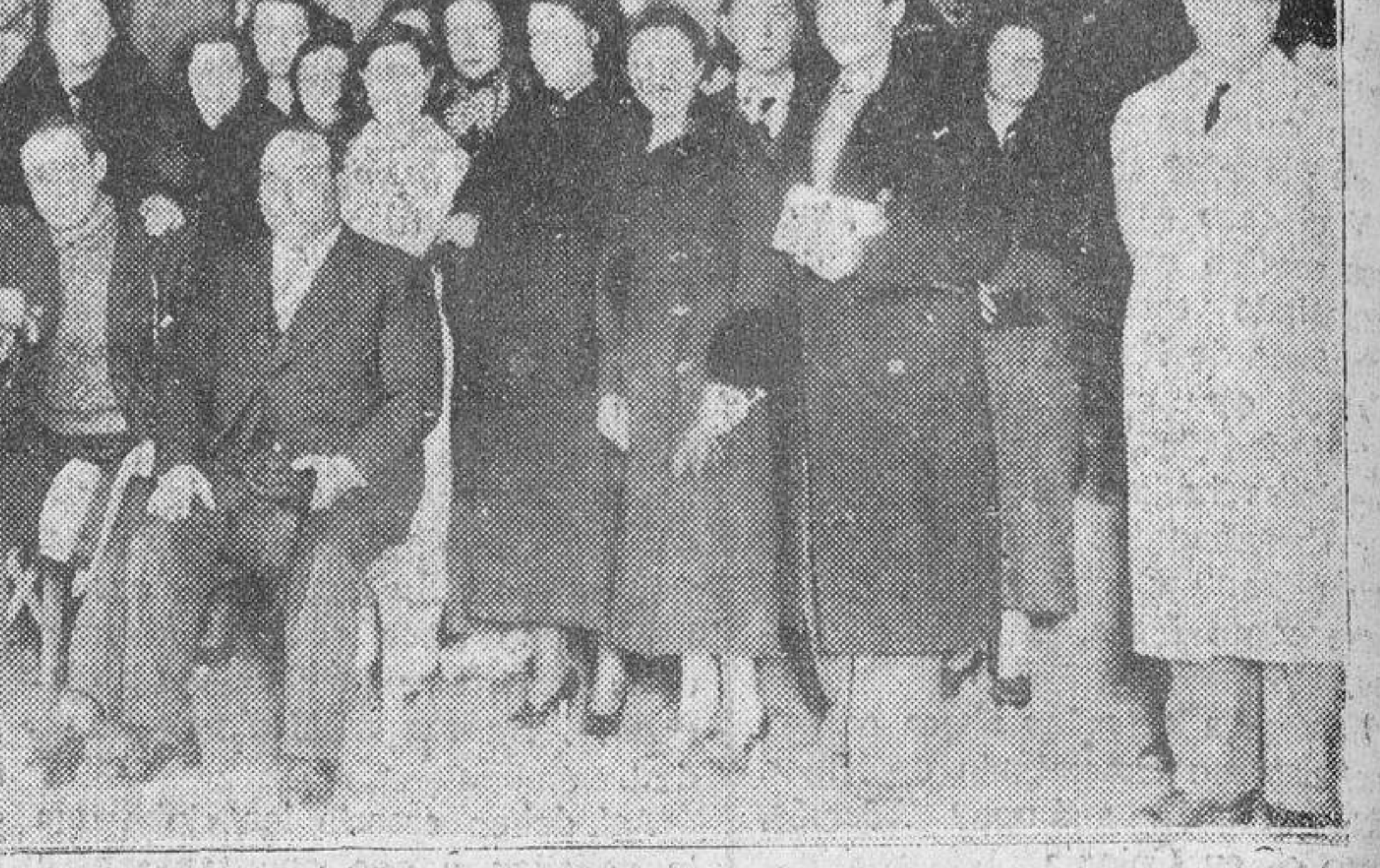
Grupo de asistentes a la Asamblea de maestros, celebrada ayer.

de compañeros de Fregeneda, Abusajo, Mata de Armuña con algunas otras recibidas días pasados, sin contar las que personalmente ostentaban muchos de los asistentes.