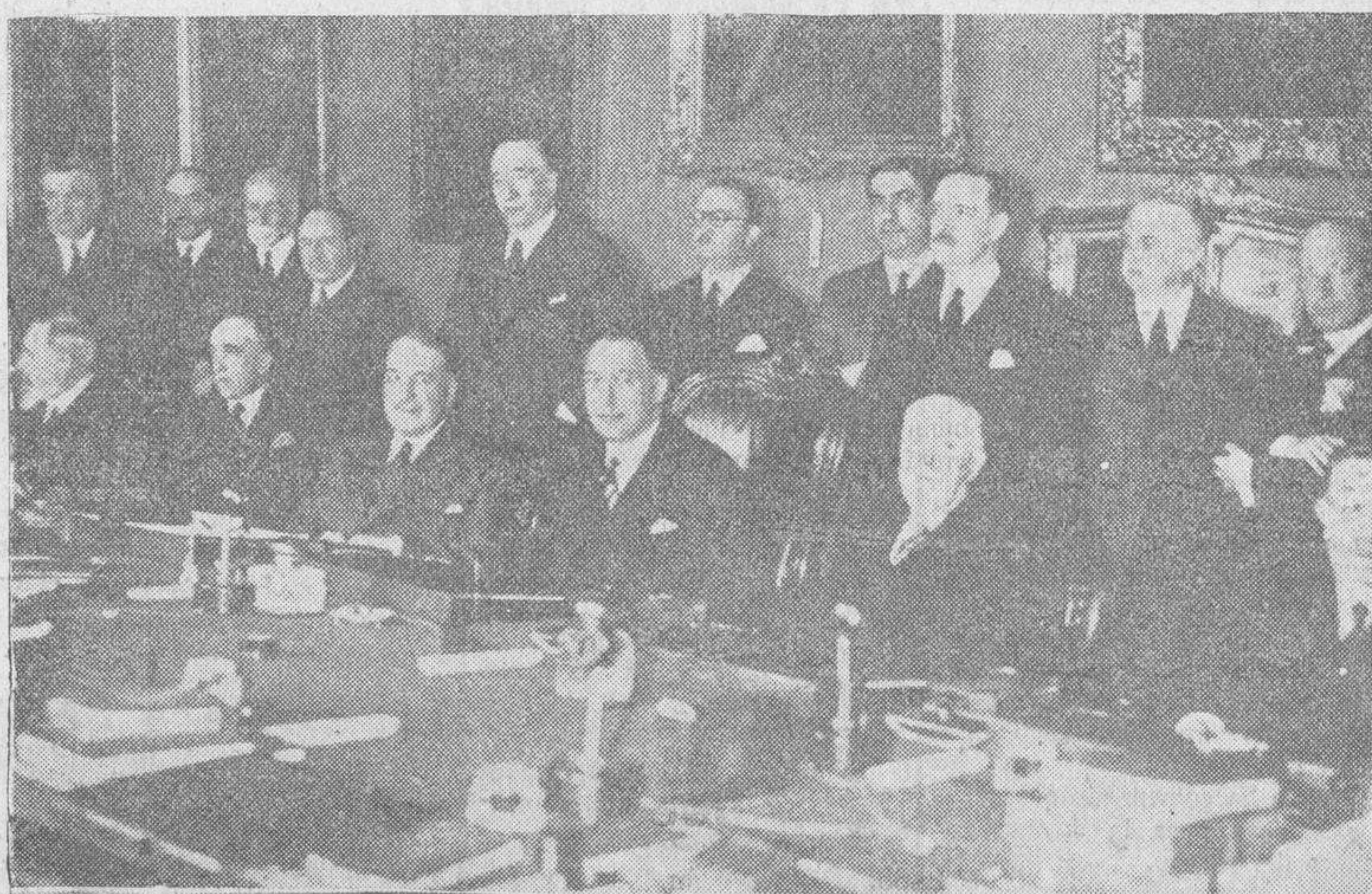
El nuevo gobernador del Banco de España, señor Araoz, rodeado de los consejeros de dicha entidad, en el acto de toma de posesión de su cargo, que revistió gran solemnidad