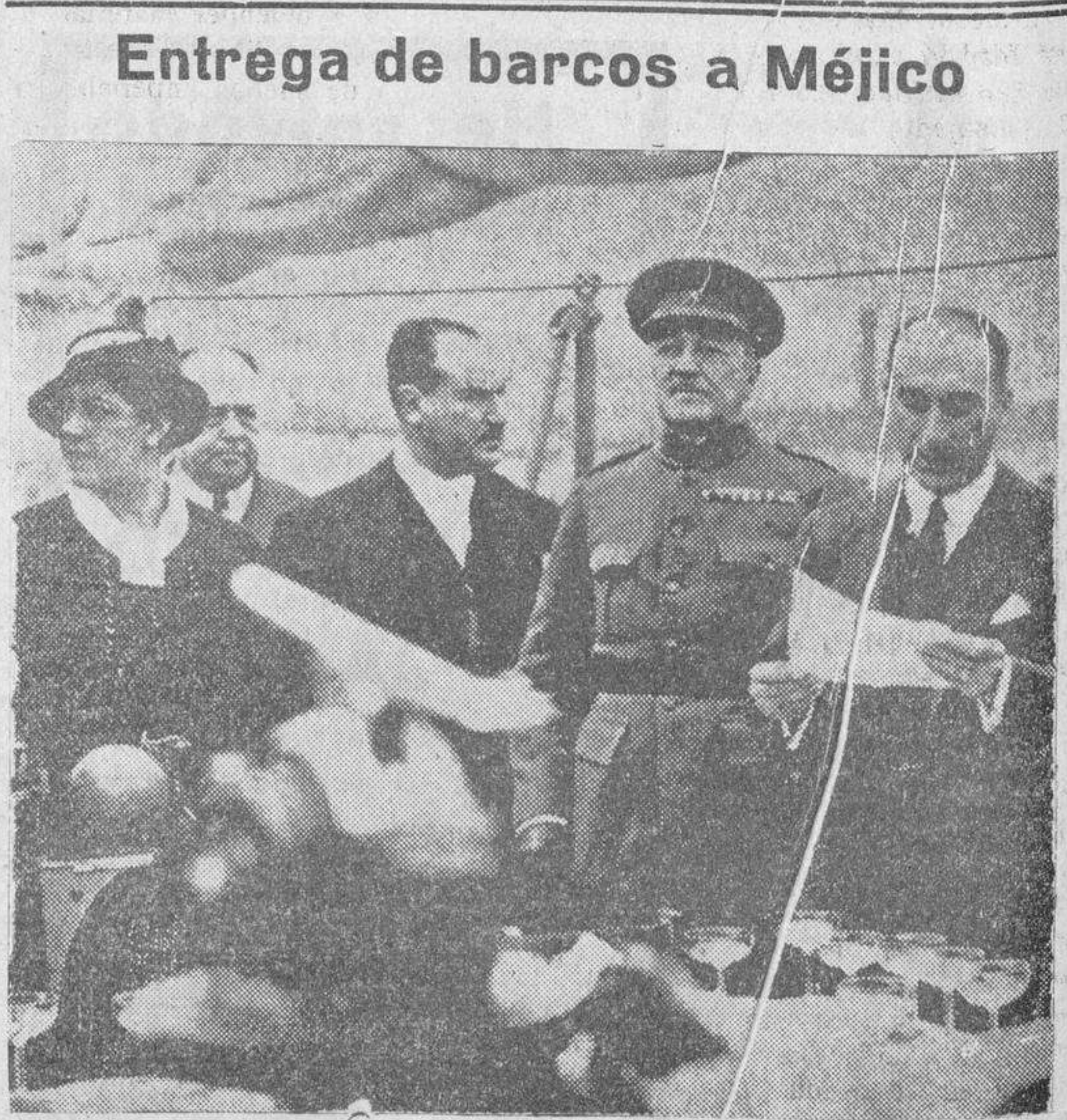
Con asistencia del embajador de Méjico y de las autoridades españolas, se ha verificado en Bilbao la entrega de los barcos de guerra cuya construcción se encargó a los astilleros de la capital vizcaína. He aquí un momento del acto

DOCTOR Miguel Becerro Matriz y Partos Espoz y Mina, núm. 2 (entresuelo) Horas de consulta. De ONCE a DOS Teléfono 1285