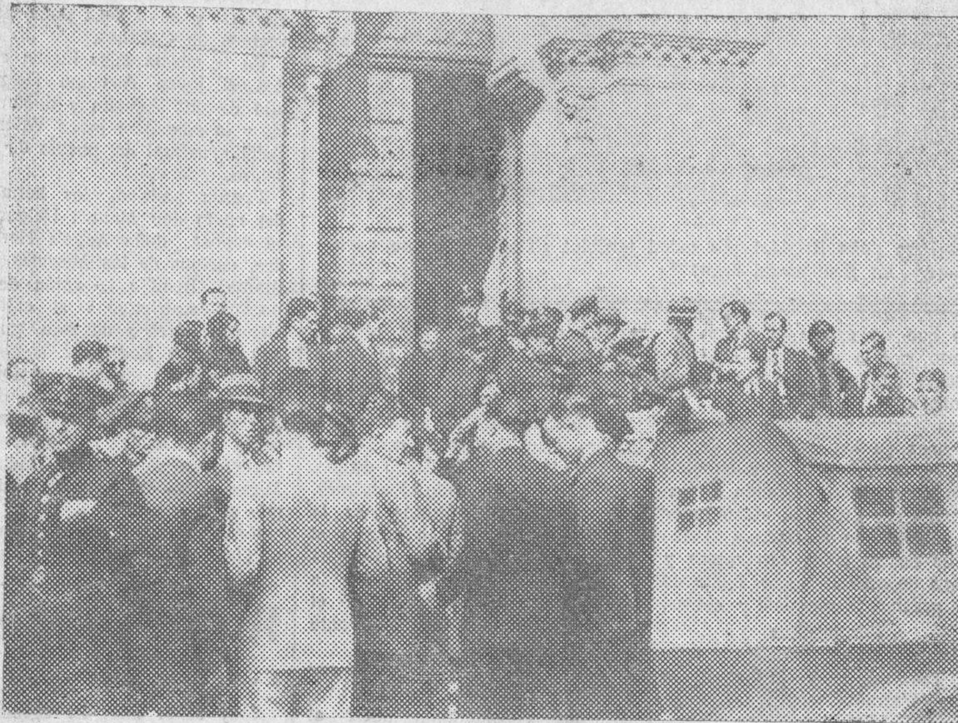
Ayer, en la iglesia parroquial de San Juan de Sahagún, tuvieron lugar solemnes honras fúnebres por el eterno descanso de los infortunados guardias de Asalto que perecieron heroicamente en Asturias. Al piadoso acto asistieron todos los guardias de la plantilla de Salamanca, francos de servicio, así como representaciones y comisiones de los Cuerpos de la guarnición y numerosísimo público. La foto reproduce la salida del público del templo, después de la misa.

que a estas fechas continuara el marco ligado al oro? En particular, debemos tener en cuenta la fuerza estabilizadora de los convenios extraoficiales, que hoy constituyen uno de los factores más importantes en el control de los cambios. Los países europeos noroccidentales y la mayoría de los dominios británicos utilizan virtualmente el "patrón esterlina". Además, la libra ha estado, hasta hace poco tiempo, ligada extraoficialmente a las divisas oro continentales por la intervención de los fondos de cambio de Inglaterra y Francia. Por ello las fluctuaciones han sido más reducidas. Esto quiere decir que será más fácil establecer un nuevo patrón oro cuando llegue el momento; pero también significa que la urgencia no es apremiante. Las autoridades británicas están satisfechas y no han de aprovechar necesariamente la primera oportunidad.