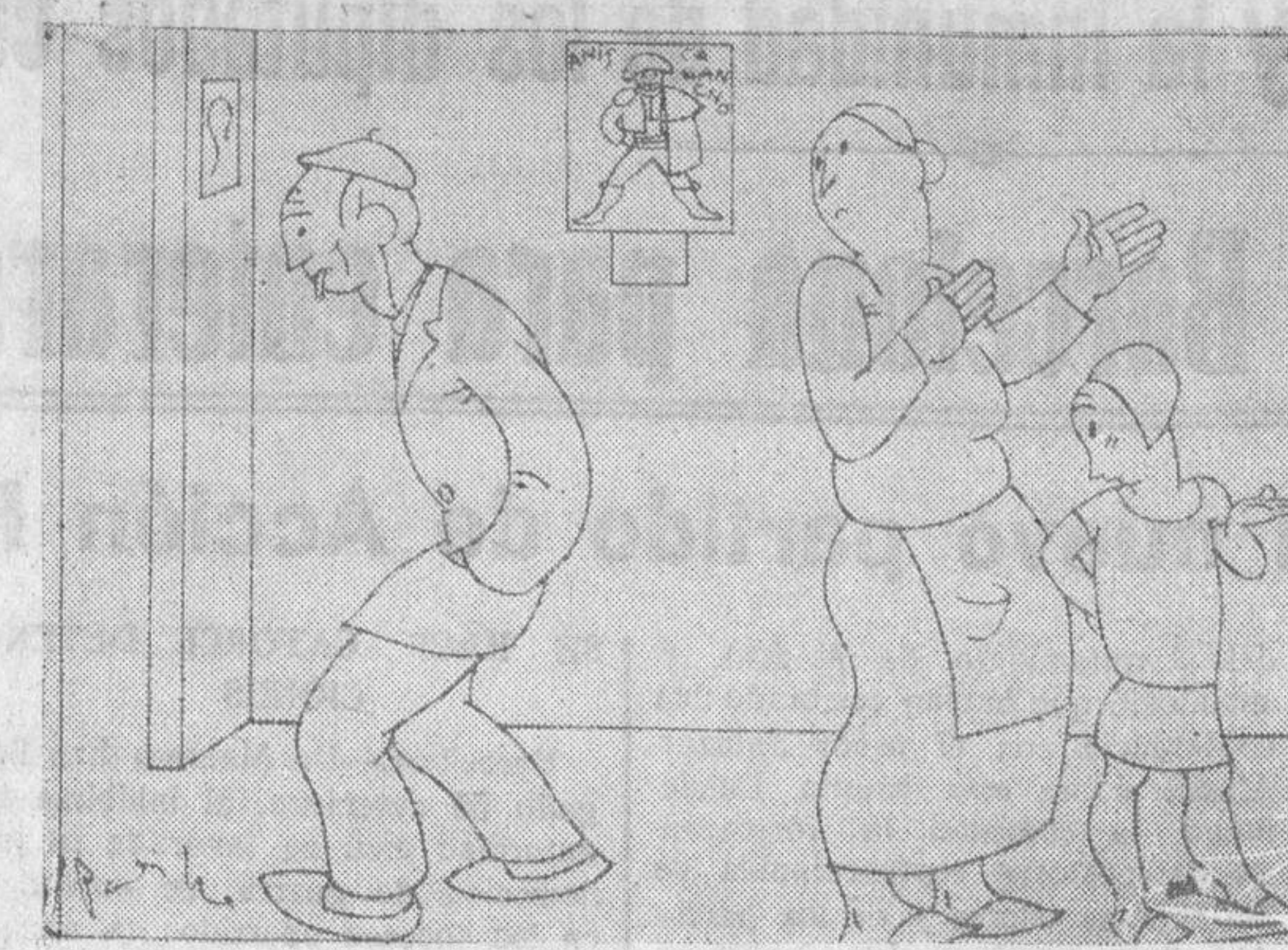
—¡Anda ya y vete! ¡Que de gaudí que eres, estás descando quedarte calvo para no tener que peinarte!