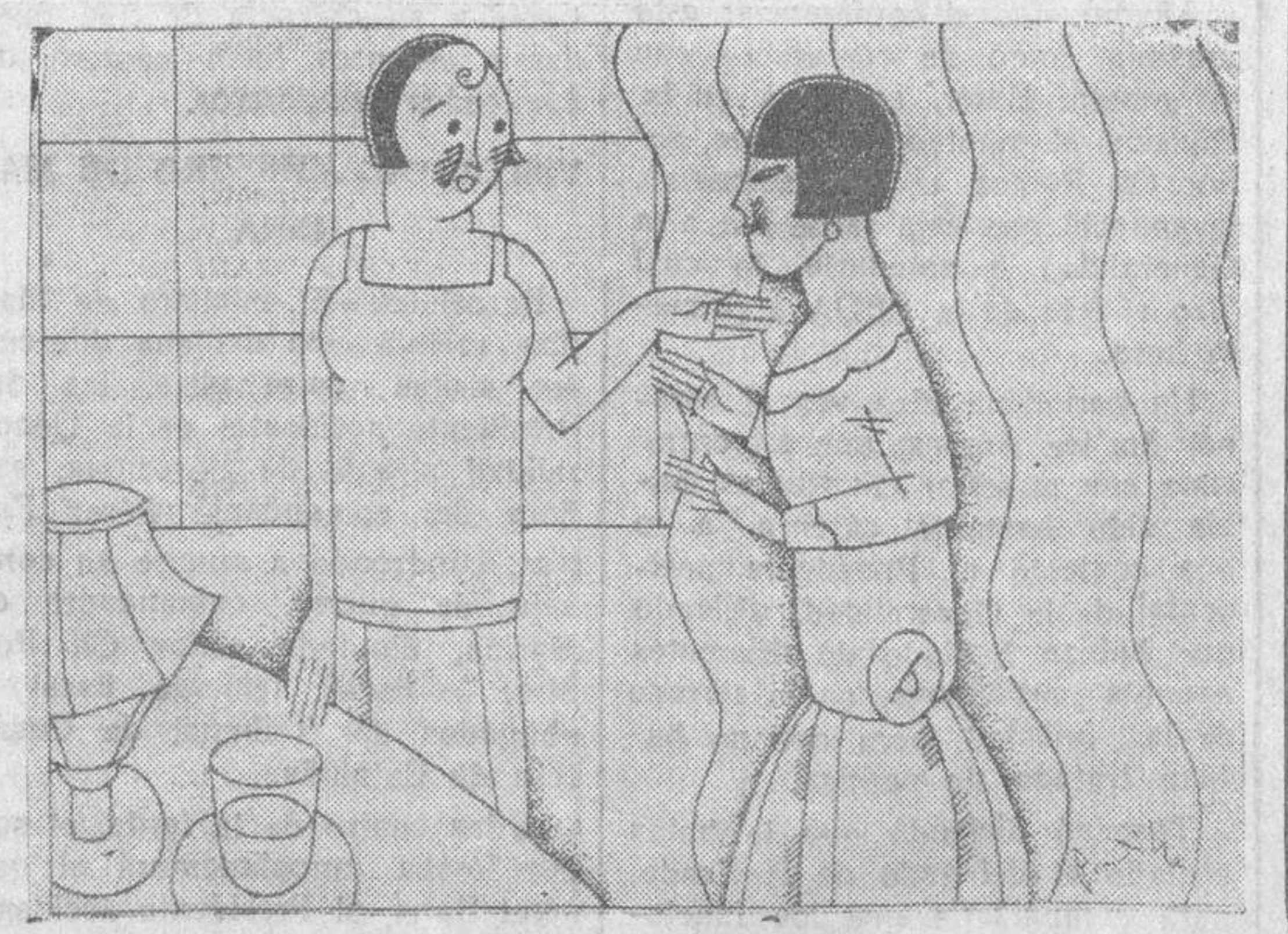
—Chica, estoy contrariadísima. ¡Mira que haberme enamorado de Pepe con lo que quiero a Polito!