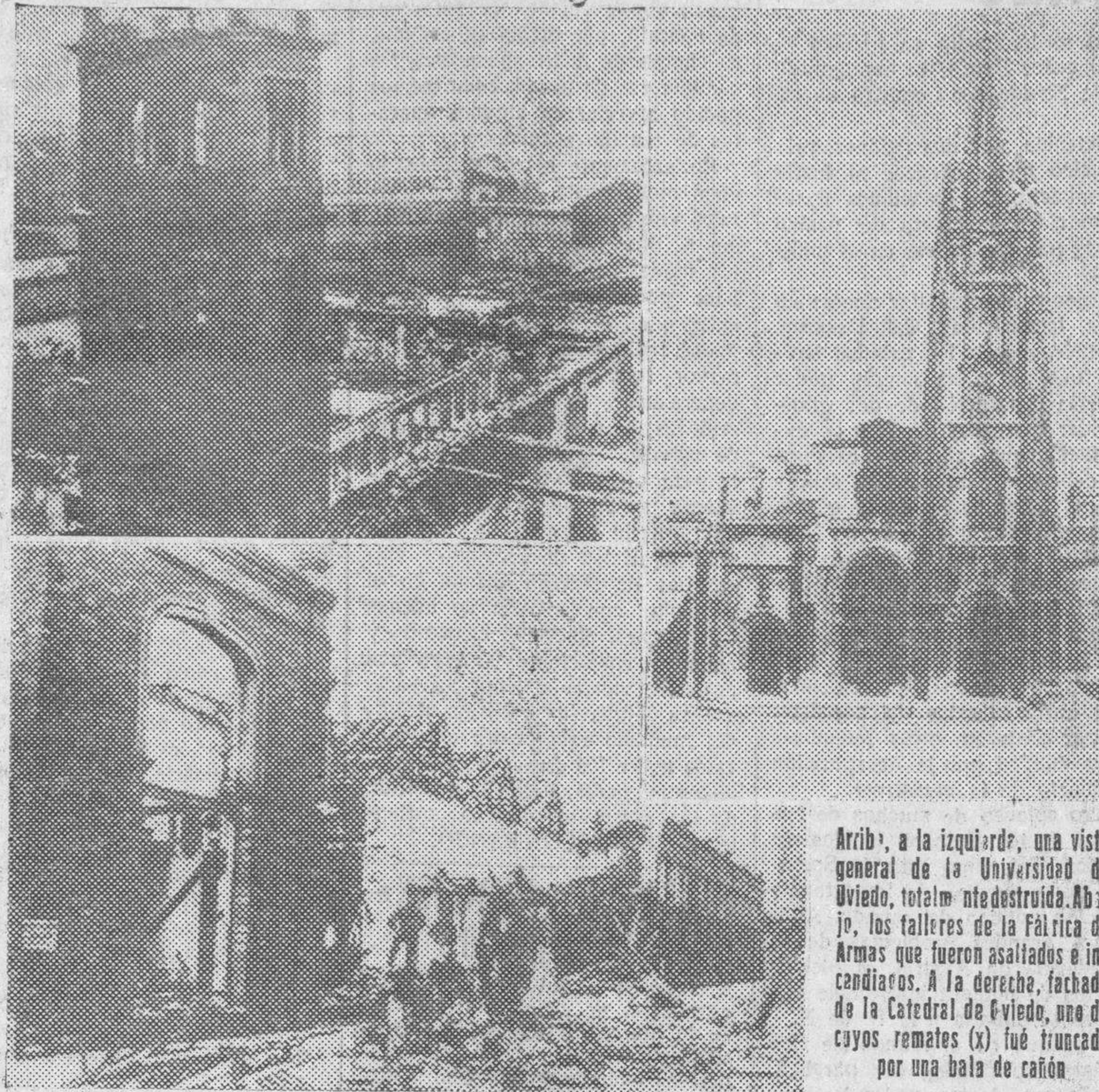
Arriba, a la izquierda, una vista general de la Universidad de Oviedo, totalmente destruida. Abajo, los talleres de la Fábrica de Armas que fueron asaltados e incendiados. A la derecha, fachada de la Catedral de Oviedo, uno de cuyos remates (x) fue trunco por una bala de cañón