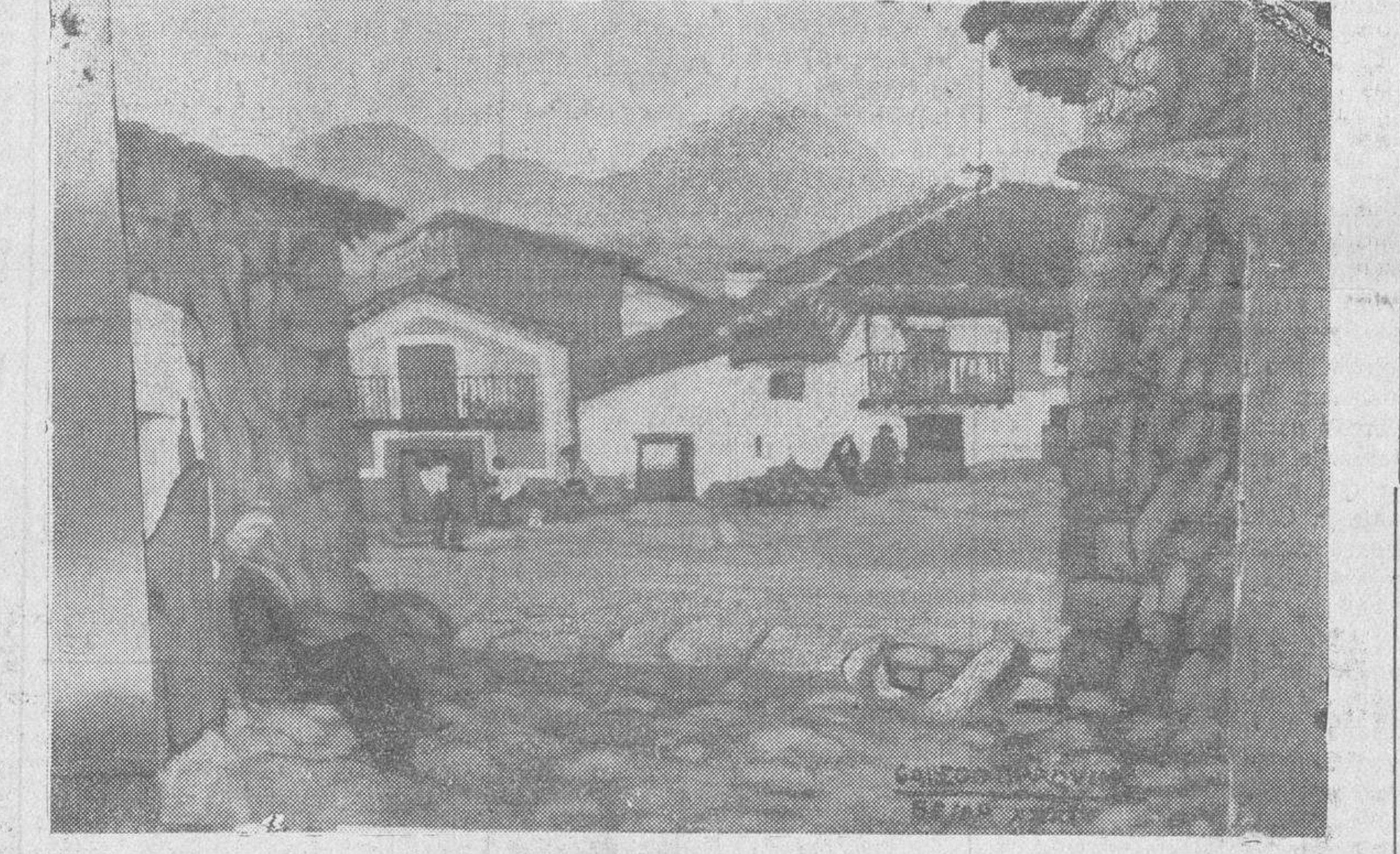
«Paz aldean», cuadro que figura en la exposición de Gallego Marquina, instalado en el Palacio de Anaya

Continúa siendo muy visitada y admirada, la exposición de paisajes de Castilla del pintor Gallego Marquina, instalada en el Palacio de Anaya. El catálogo de las obras es el siguiente: 1. Béjar; 2. La nevada (Béjar); 3. Orillas del río (Béjar); 4. El Lago (Sanabria); 5. Rastrojos de Sanabria; 6. Tierra del Vino (Zamora); 7. Tierra de Campos (Toro); 8. Prados de Cantagallo; 9. Zamora; 10. Encinares Charros; 11. Tierras de pan llevar (Sa'amanca); 12. Paz aldeana (Béjar); 13. El molino de Riolro (Béjar); 14. Atardecer (Béjar); 15, 16, 17. Los pueblos; 18, 19, 20. La Sierra; 21, 22, 23. Los barbechos; 24, 25, 26. La nieve; 27, 28, 29. Rincones de Béjar; 30, 31, 32. Estampas pueblerinas; 33. Candelario con sol; 34. Candelario con nieve; 35. Apunte; 36. Apunte; 37. El Cántero (dibujo); 38. Un gañán (dibujo); 39. Dibujo; 40. Dibujo. La Exposición del pintor Gallego Marquina, continuará abierta al público hasta el domingo próximo.