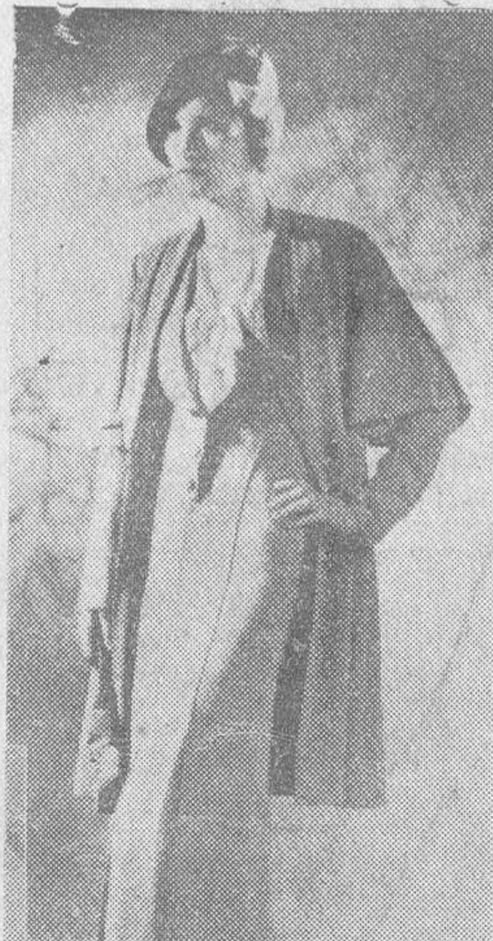
Completo de lana color gris