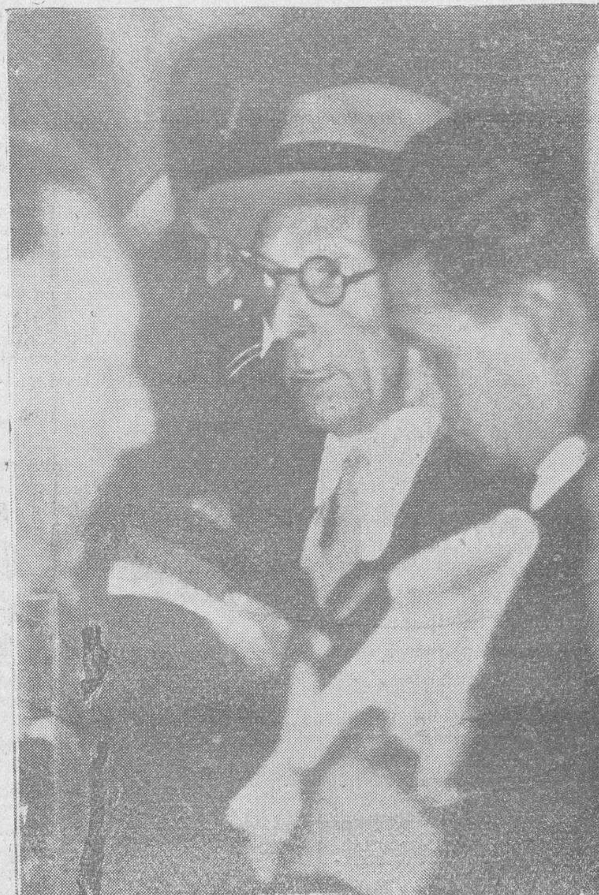
El señor Samper, conversando con los periodistas, al salir del Palacio Nacional, después de presentar la dimisión del Gabinete

—Al decir que las cosas están muy claras—dijo un informador—