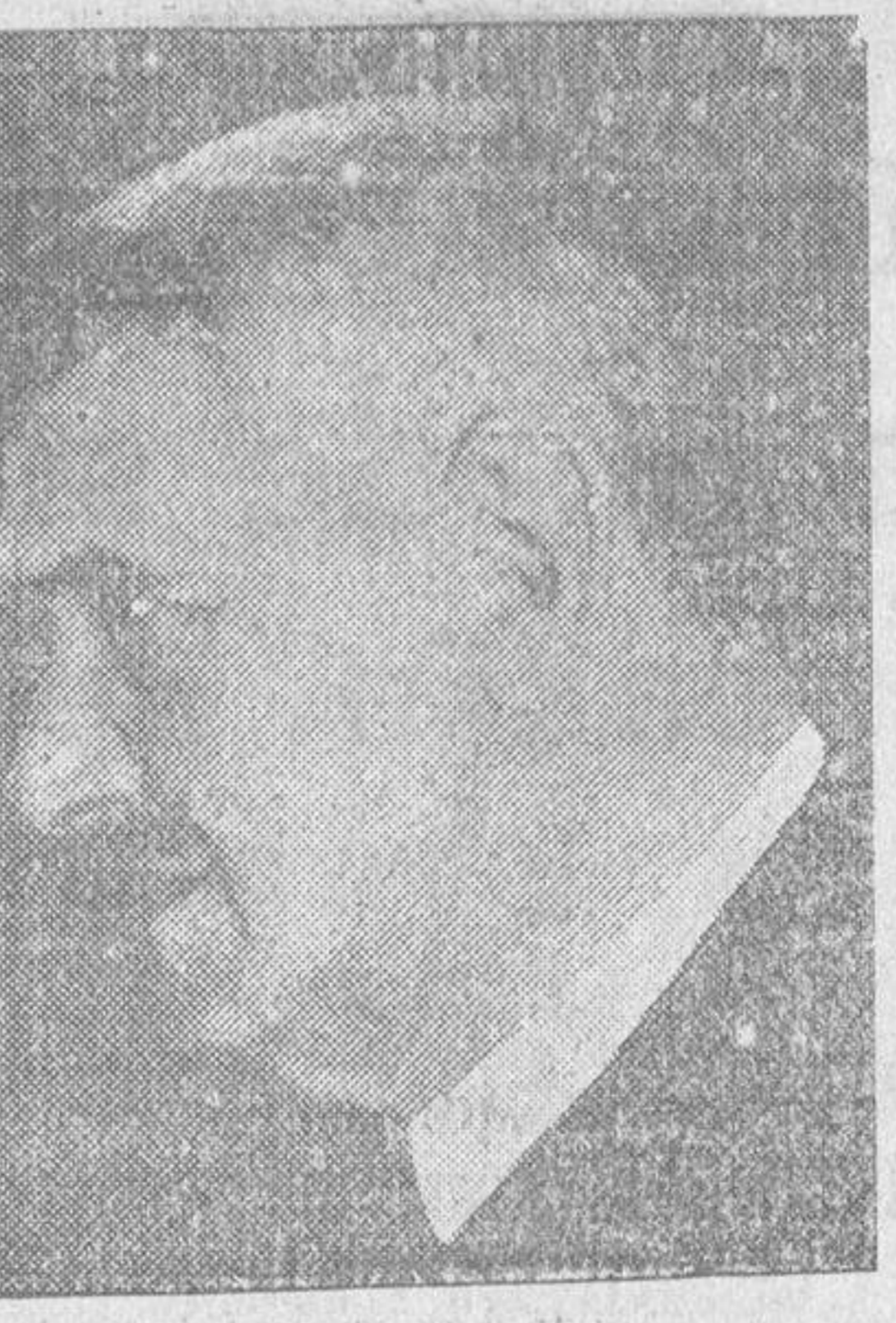
El ex ministro de Hacienda de la República, don Jaime Carner, que ha fallecido de madrugada, en Barcelona.

Santa Cruz de Tenerife.—Continúa la huelga general y el paro es absoluto. La ciudad presenta hoy aspecto animado.