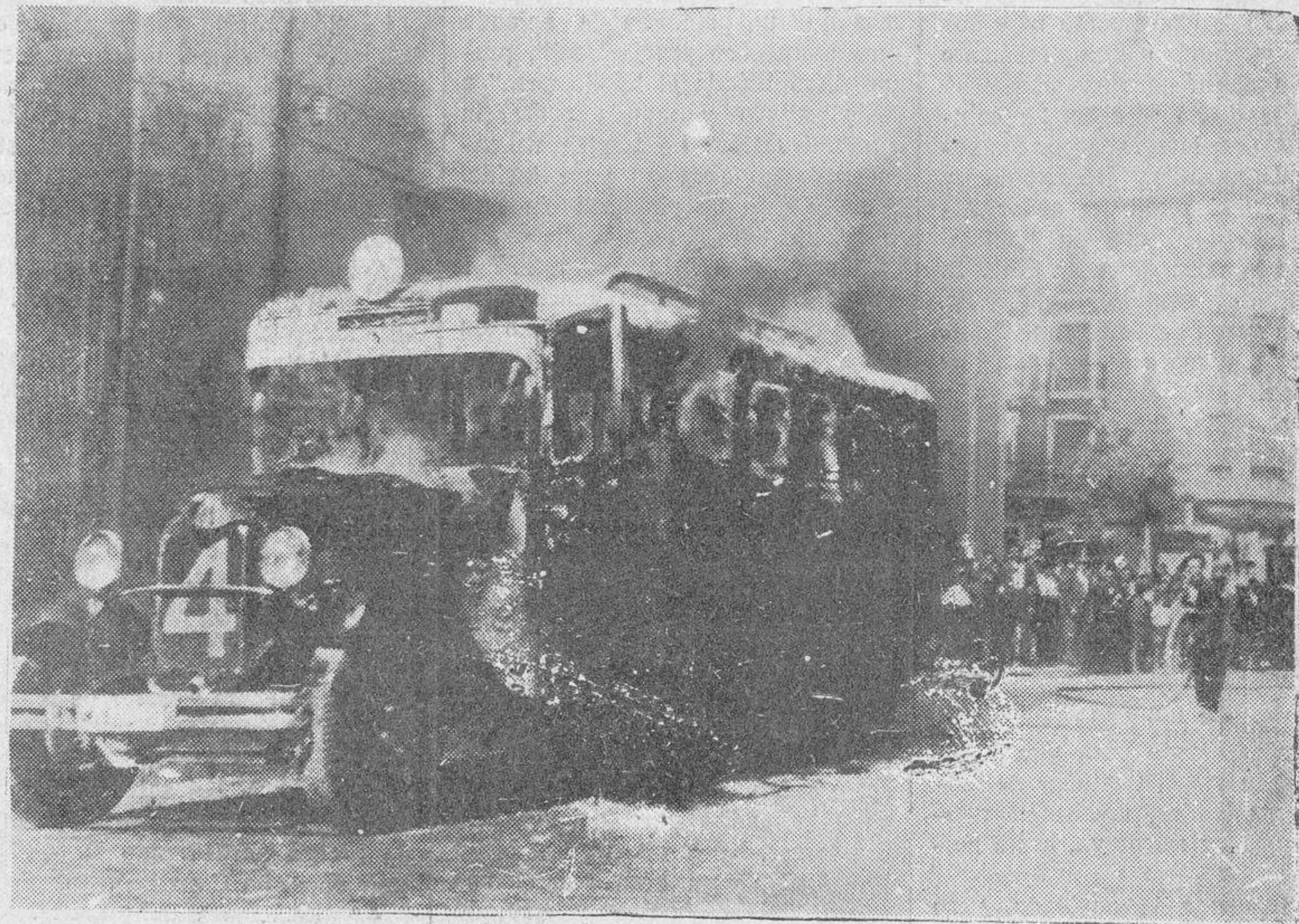
El autobús incendiado a los pocos momentos de comenzar el siniestro