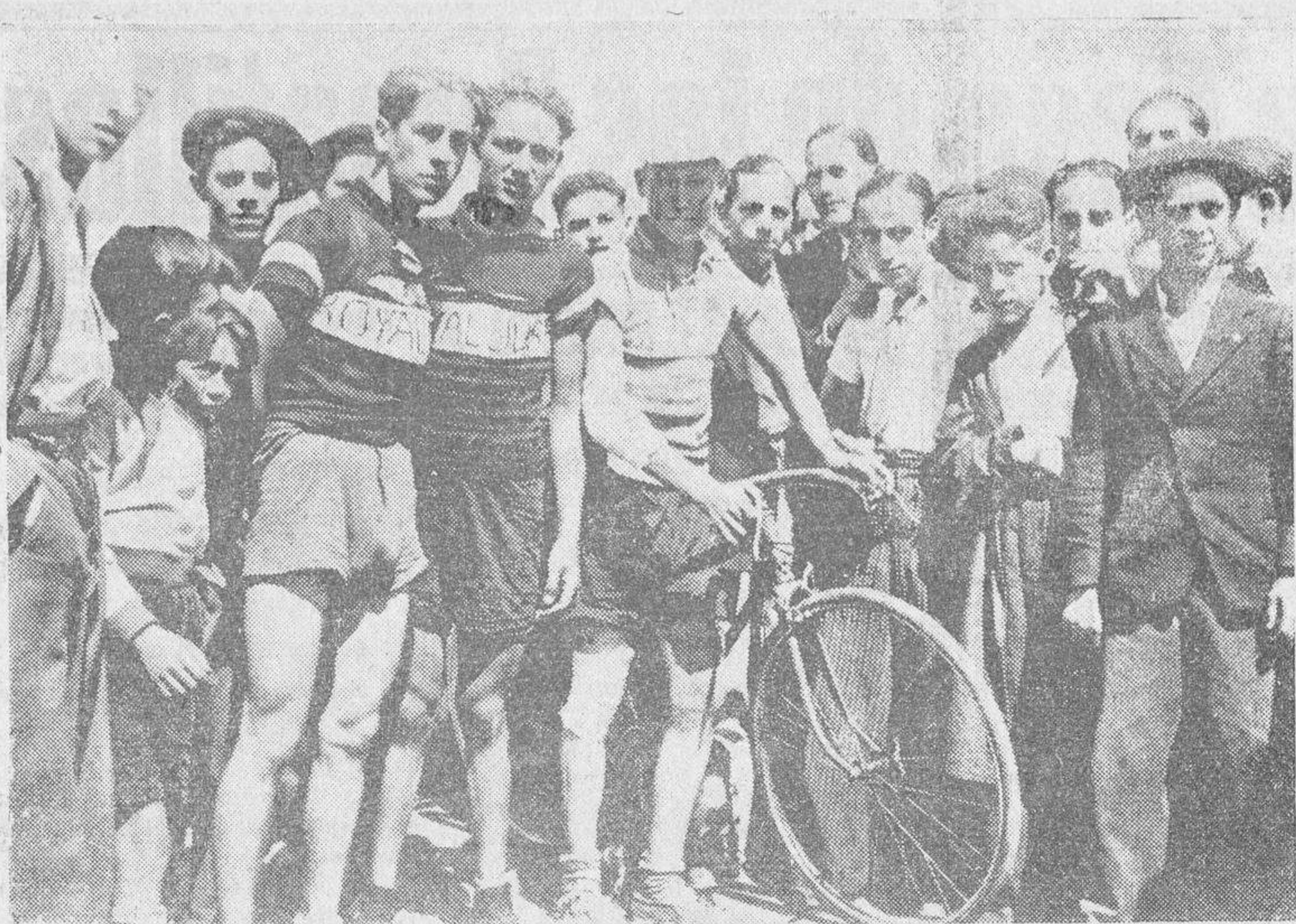
En el centro, el vencedor de la carrera, y a sus lados, dos de los más destacados participantes.