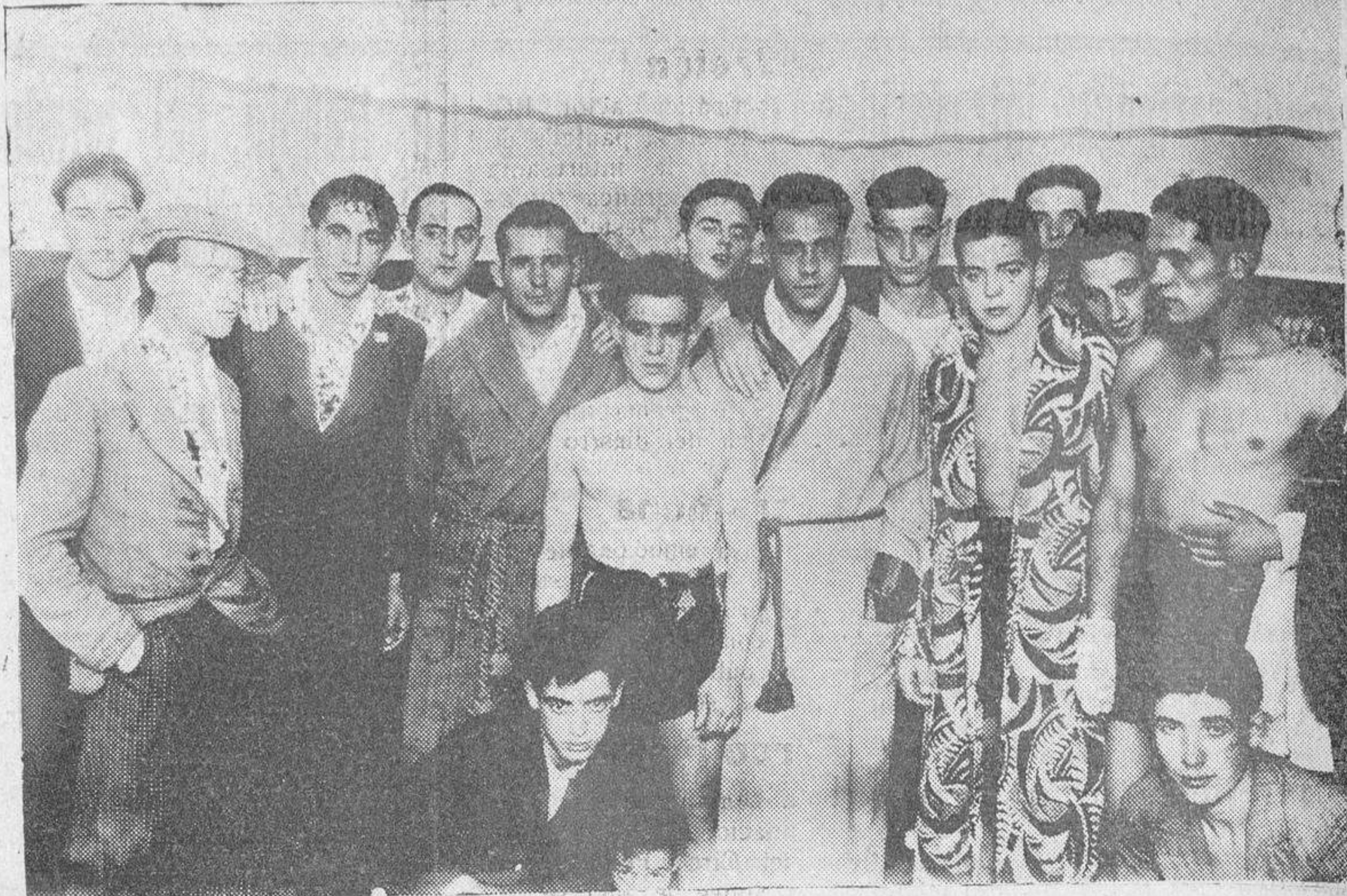
Grupo de boxeadores que tomaron parte en la velada de anoche en el Salón Estambul.

Se celebró anoche la anunciada velada de boxeo, cuyos resultados fueron los siguientes: