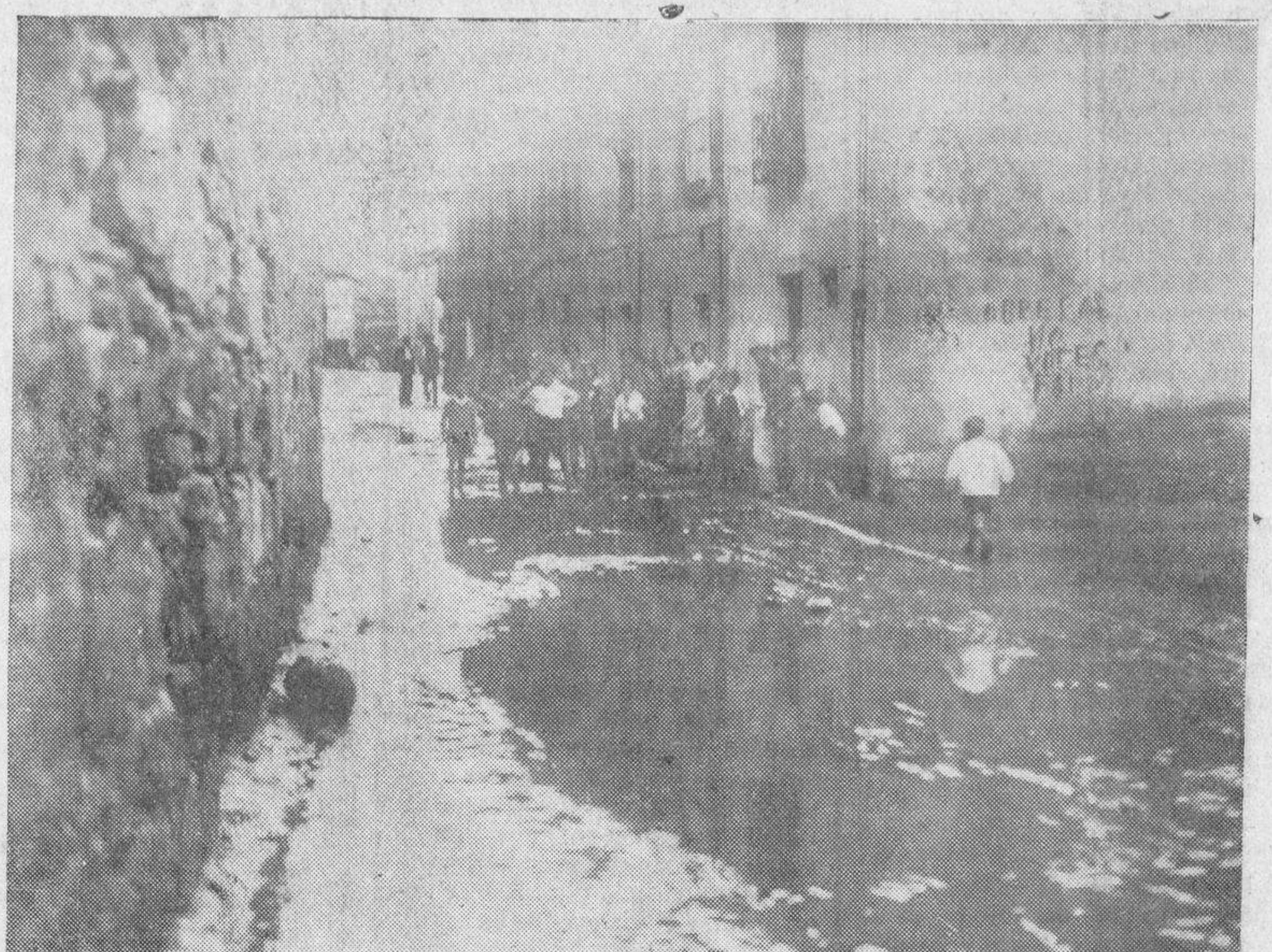
La tormenta de agua de ayer produjo las inundaciones "de siempre". En la calle de la Cárcel, se formaron grandes lagunas, que interrumpieron durante algunos minutos la circulación. Afortunadamente, el agua no hizo estragos de gran consideración.

romanización pacífica y civil; es la historia de un grandioso proceso de penetración recíproca, por el cual, bajo la égida de Roma, la civilización greco-romana se mantuvo en Oriente y penetró el Occidente, mientras ambos suministraban sus hombres mejores en las letras y en las ciencias, en el derecho y en las armas, al servicio de aquella civilización y del Estado romano — mundial. Proceso grandioso e inmenso del cual todavía hoy notamos los beneficios efectos, maduro para una vida unitaria, para una civilización común, había encontrado en un gran romano el hombre capaz de derribar las estrechas barreras del viejo romanismo tradicional y para hacer del Urbe el corazón del Orbe. Y ésta fué la obra vital de César, pudo haber paros, pero nada de retornos y mucho menos de destrucción. La historia positiva del imperio romano es la historia de la oración y del gobierno regular y beneficioso de las provincias, de la igualdad de sus derechos, de su