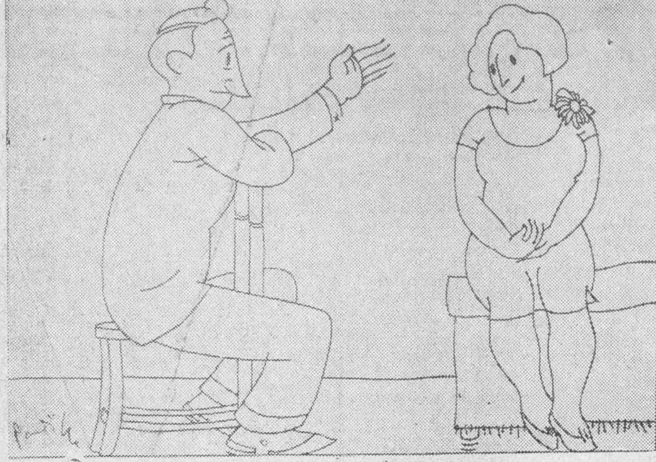
—Diga usted, Toñito, ¿es peligroso poner un pie sobre el riel de un tranvía? —No es peligroso, pero procure usted no tocar al mismo tiempo con el cable de arriba.

2.º Solicitar igualmente del ministerio de Agricultura, el riguroso cumplimiento de lo dispuesto en la Orden dada por expreso minis-