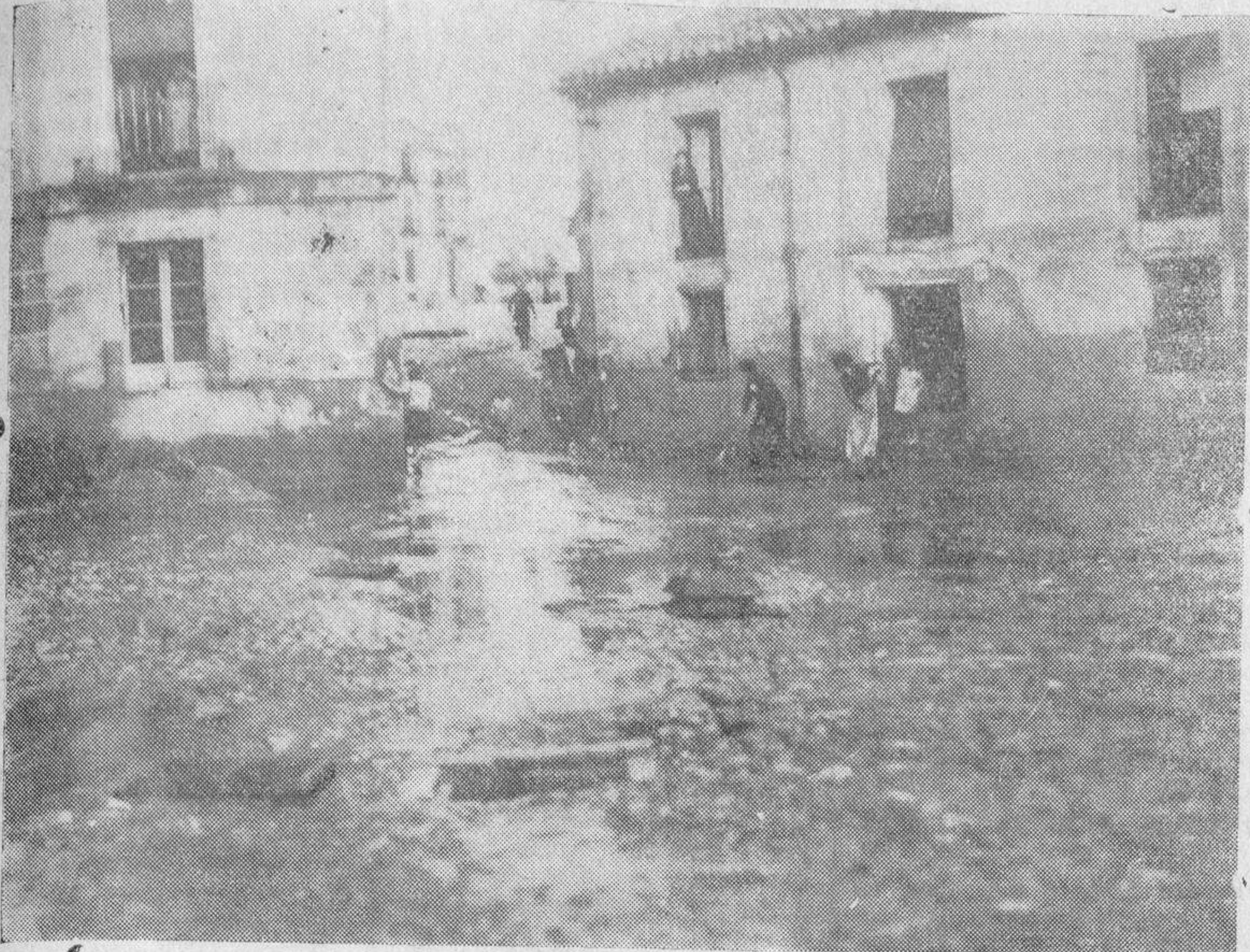
Las casas del Pozo del Campo sufren siempre las consecuencias de las lluvias. Aunque la de ayer no revistió caracteres serios, por su poca duración, hubo que desalojar el agua de algunas viviendas, como lo están efectuando esas dos vecinas