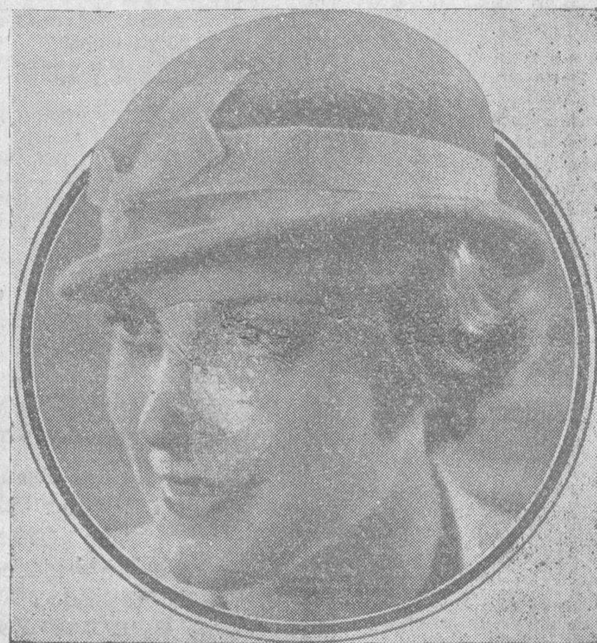
Un sombrero en lino azul celeste, adornado sencillamente con esa cinta que se anuda en un lazo ejemplarmente conciso y gracioso, tal como lo luce esta rubita, es lo más «chic» para los trajes matinales