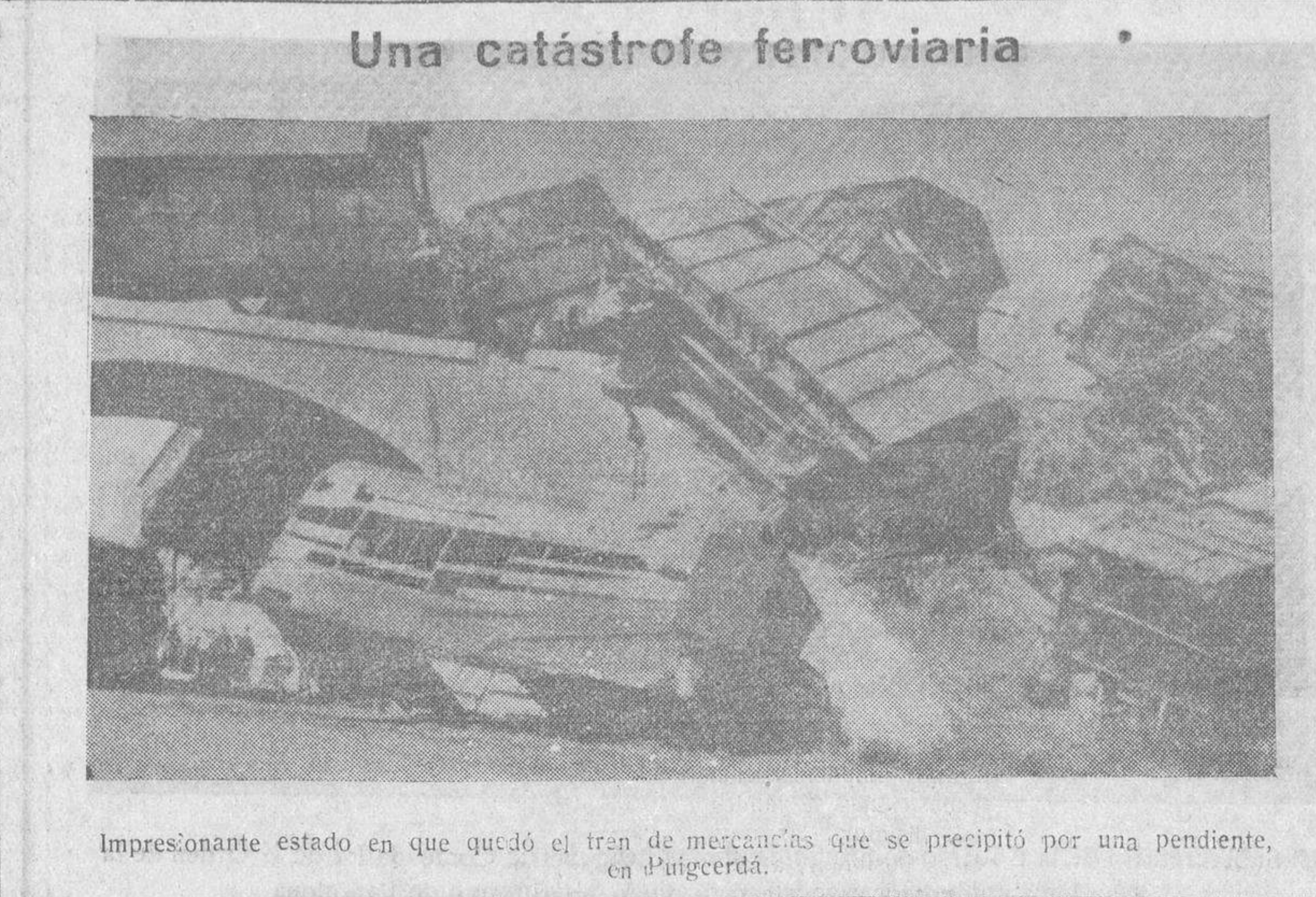
Impresionante estado en que quedo el tren de mercancías que se precipito por una pendiente, en Puigcerdá.