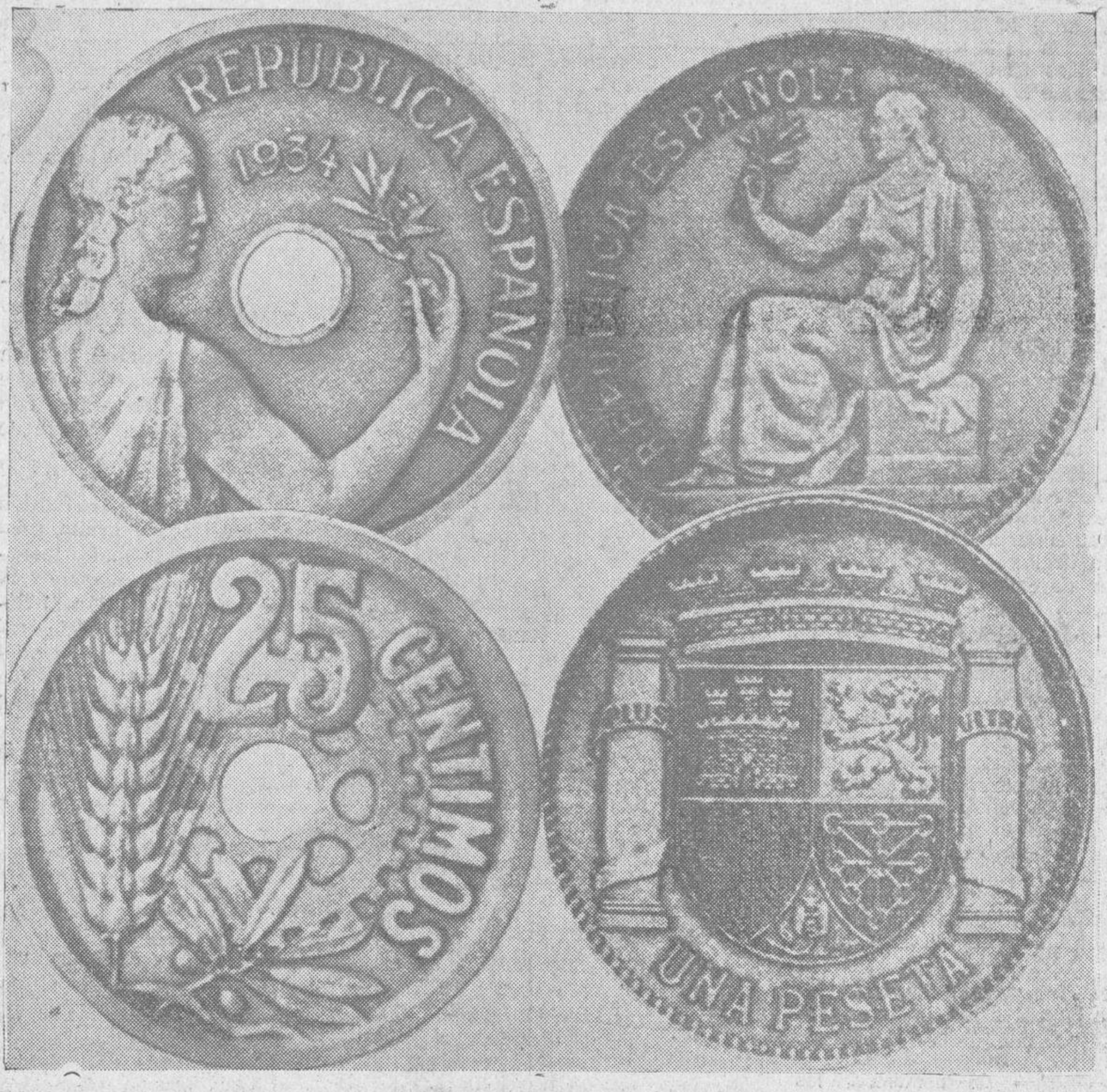
Diseño de las primeras monedas de la República, que se pondrán pronto en circulación

nuestra atención se concentra en la cosa política y en las discusiones que ésta engendra. Un diputado que amenaza con separarse de un partido o un concejal que se disgusta con el alcalde, ofrece más interés que la acometida de una empresa de gran envergadura patriótica. Y, naturalmente, gracias a esto ni tenemos marina mercante, ni líneas aéreas, ni grandes colonias, ni una economía fuerte y sana, ni abundantes riego para nuestras secas tierras, ni marina de guerra como corresponde a una primera potencia mediterránea, ni un turismo crecido que rinda abundantes ingresos, ni... ¡A qué seguir! No tenemos nada de lo que deberíamos tener y de lo que la imaginación española es muy capaz de crear.