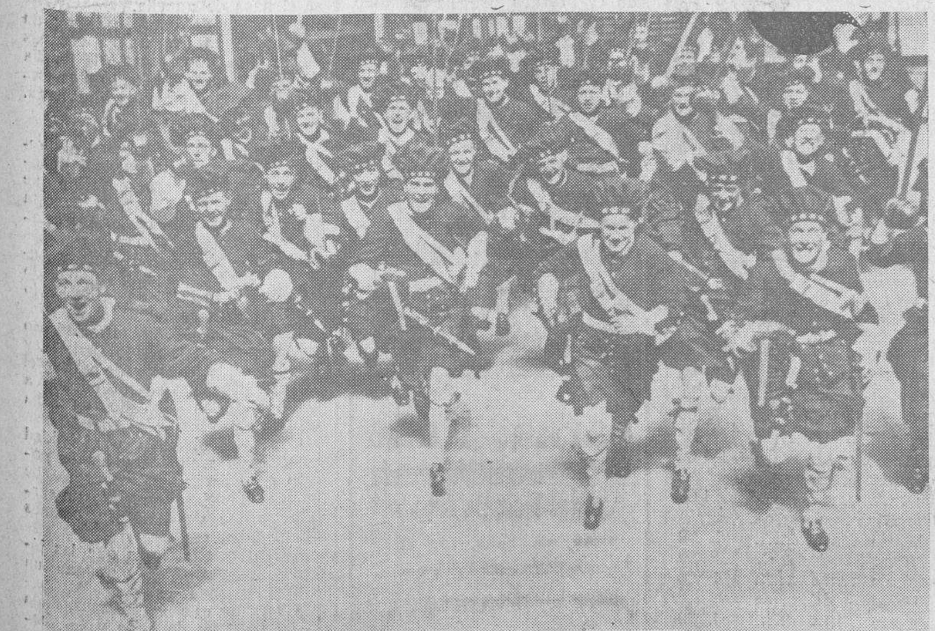
Vista del gran torneo militar real de Aldershot, que el rey Jorge V ha inaugurado ayer.