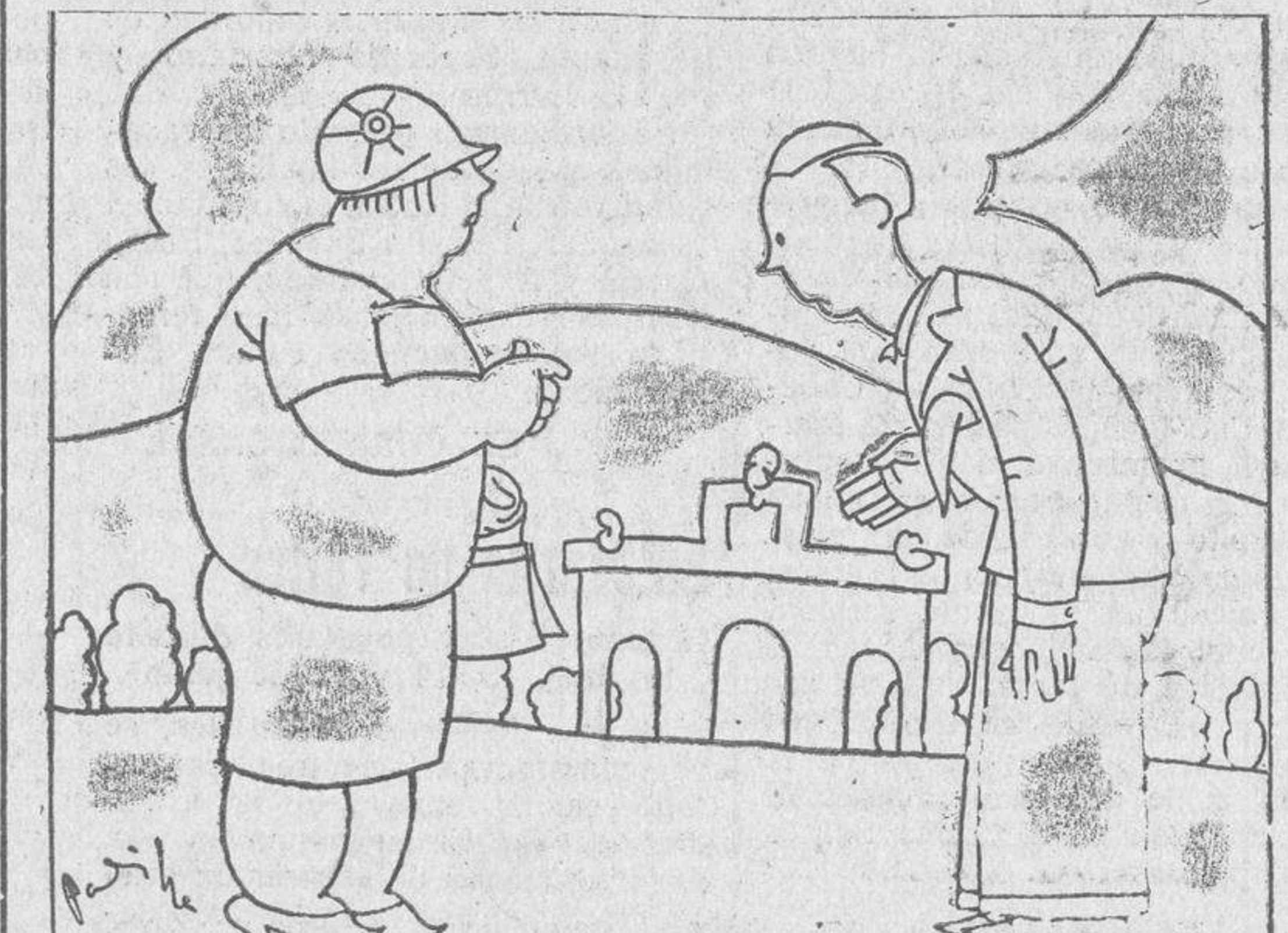
—Todos tenemos momentos flacos, Corito. —¿También usted, doña Flérida?

En sus luchas juveniles al frente de la F. U. E. El señor Joven, al frente del gobierno de varias provincias, entre ellas Salamanca, dejó la huella de su política noblemente republicana. El señor Barcia, por su gestión al frente de los altos cargos del Estado y en la actualidad desde el alto puesto de la Jefatura de la minoría de Izquierdas, no ha hecho sino ir acrecentando su prestigio muy anterior a la República y no necesita presentación ante el pueblo de Salamanca.