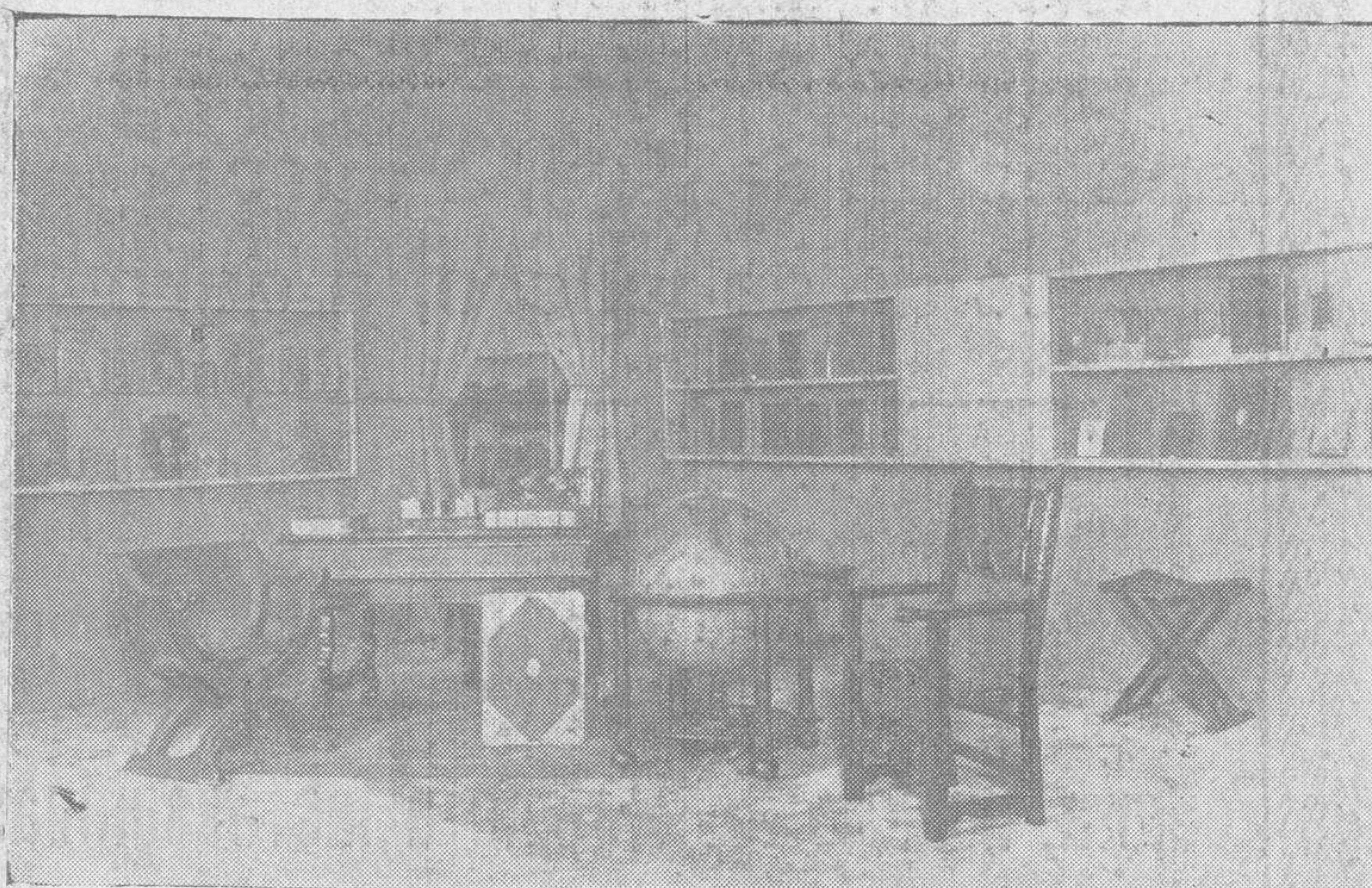
Sala del Escorial.—Encuadernaciones del siglo XVI y muebles de esta época.