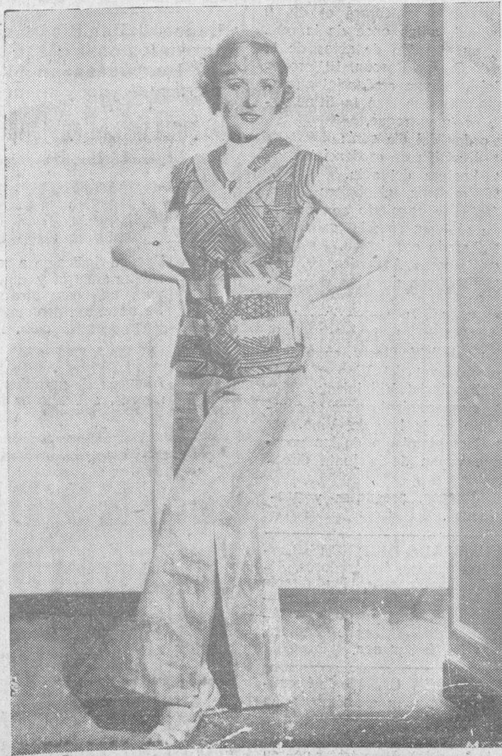
Magde Evans, famosa actriz de la Metro-Goldwyn-Mayer, haciendo un nuevo y original piyama con pantalón de lino, abierto al lado, y chaqueta de seda estampada