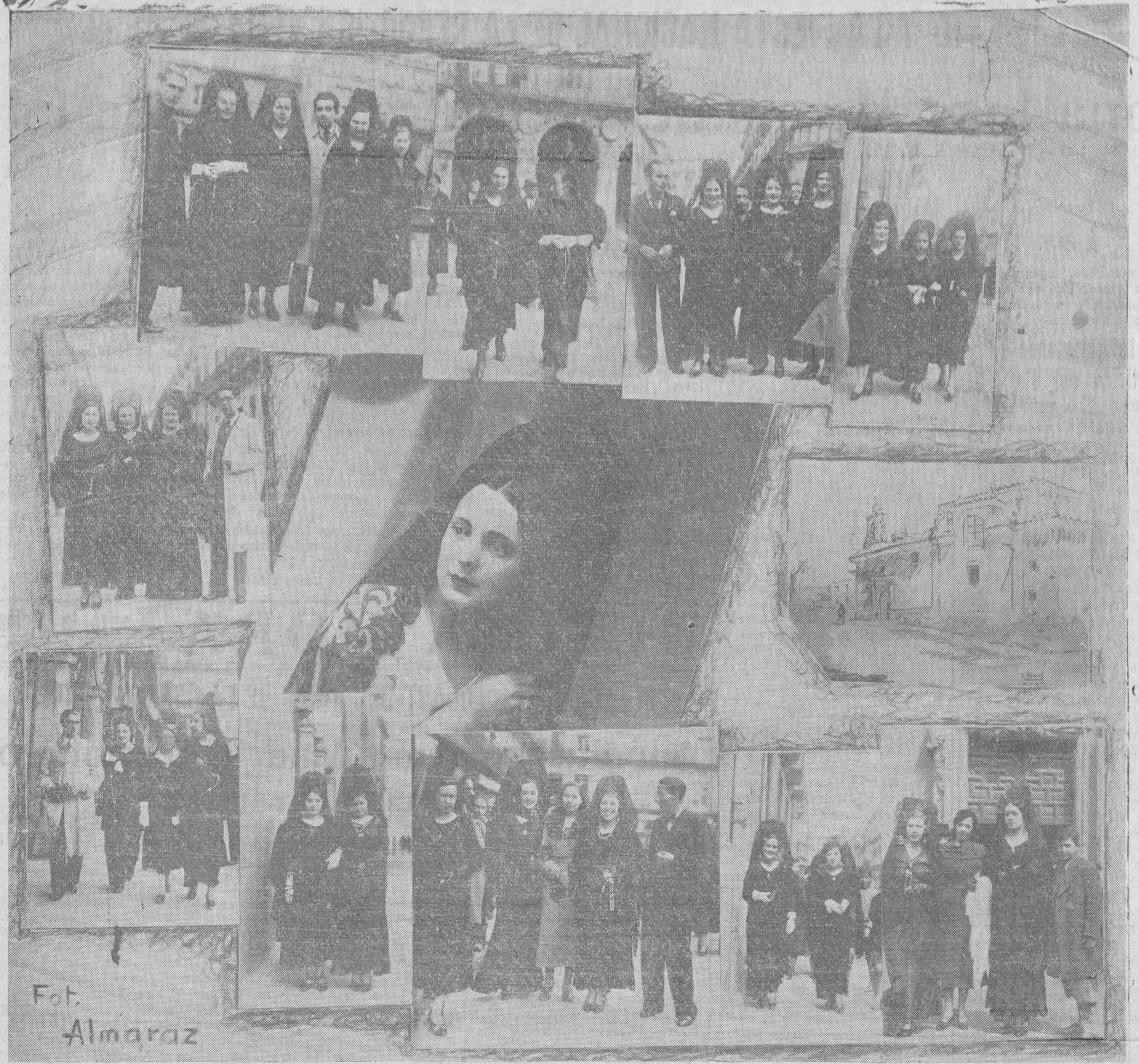
El primer jueves del año, de los tres "que relucen más que el sol"—Jueves Santo—hizo honor al refranero. Las muchachas salmantinas, que llevan arraigada la fe religiosa, hicieron la tradicional visita a los Sagrarios, tocadas con la españolisima mantilla, que realizaba aún más la belleza de nuestras damitas. De los numerosos grupos que durante todo el día pasearon por la ciudad, de iglesia en iglesia, con sus rosarios de nácar y sus devocionarios en las manos, Almaraz supo recoger los más representativos de la hermosura y el donaire de la mujer charra