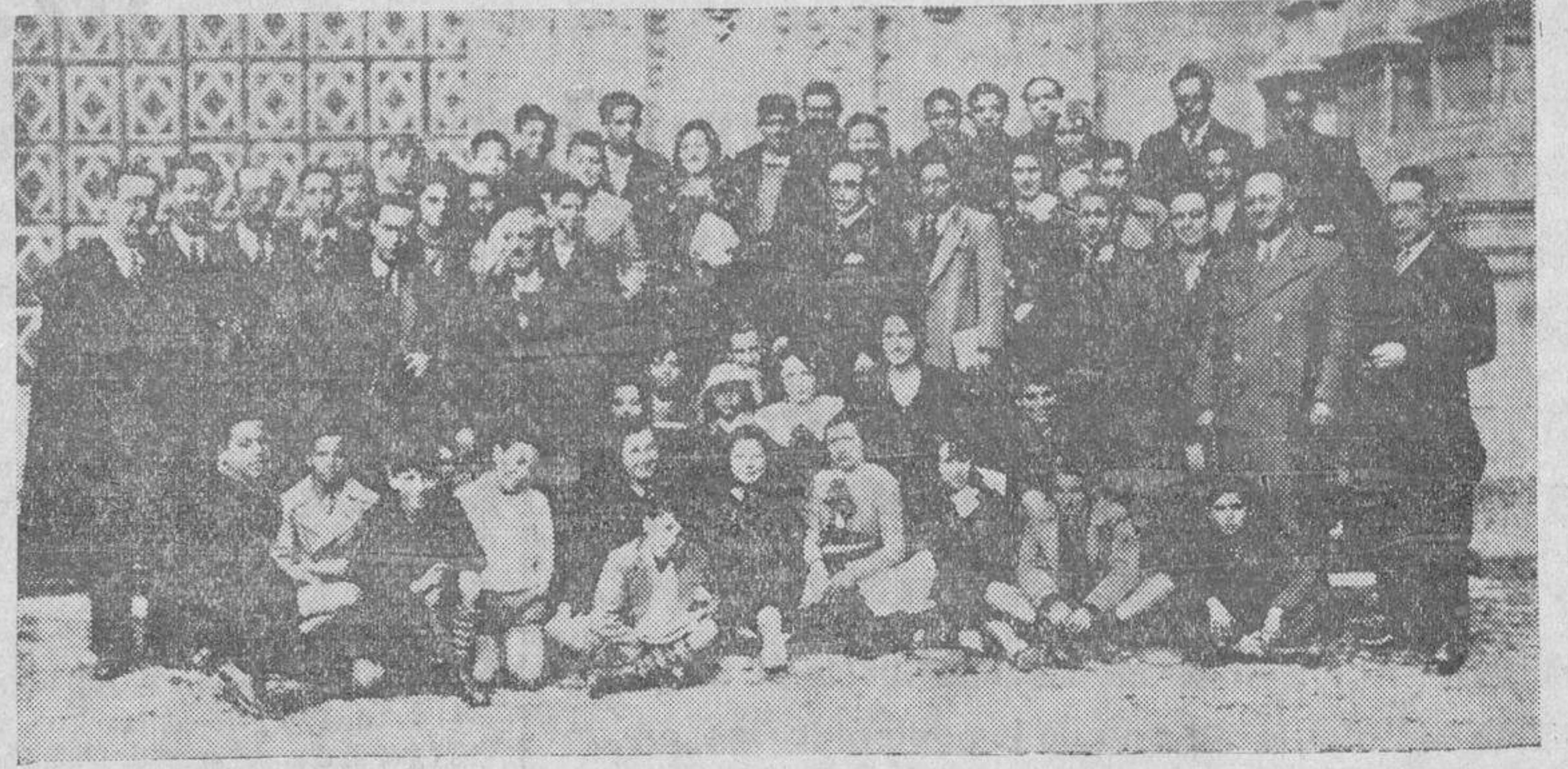
Huérfanos y directores del Hogar-Escuela del Cuerpo de Correos, con los funcionarios técnicos e hijos de esta Central

es el Colegio de Huérfanos del Cuerpo. Visitaron igualmente la sección de Telégrafos, en donde los funcionarios de servicio, les recibieron cordialmente. Ya entrada la noche partieron para Zamora, para continuar su viaje por Valladolid y Medina del Campo, siendo despedidos por los