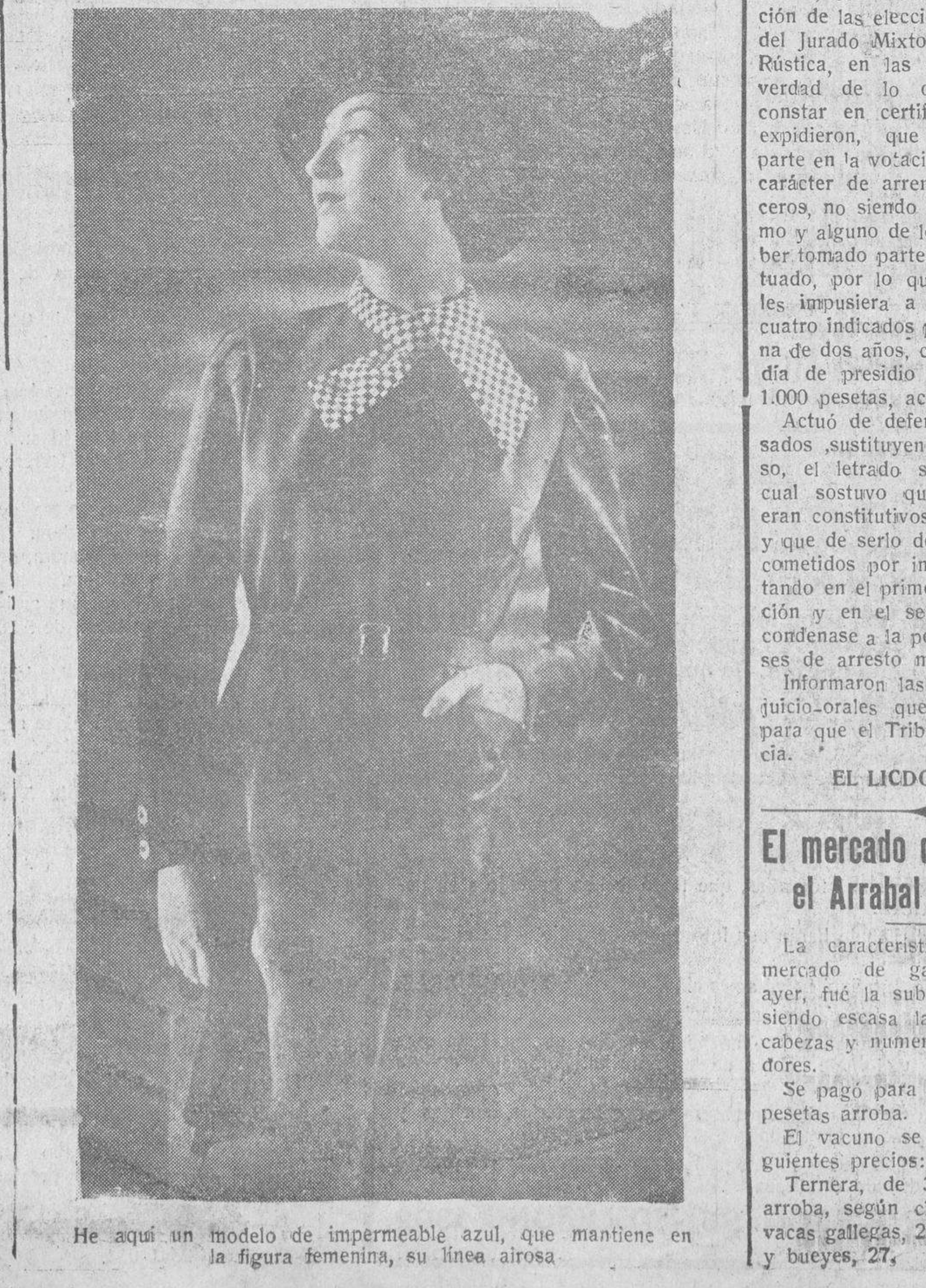
He aquí un modelo de impermeable azul, que mantiene en la figura femenina, su línea airosa.