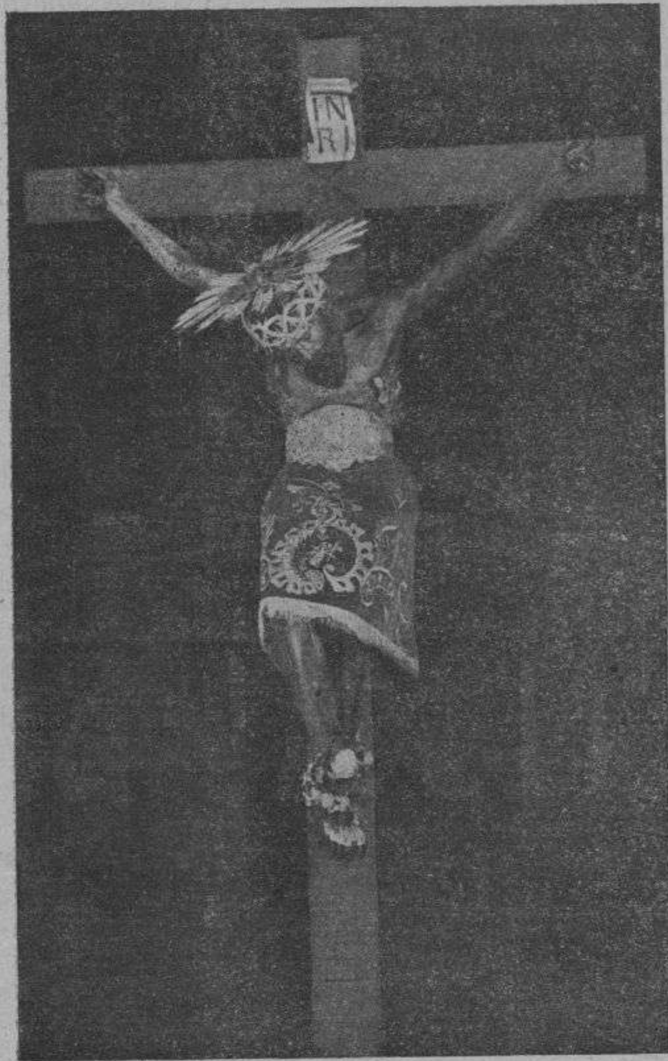
El Santeristo d'Inca que en 1607 va suar per espai de tres dies