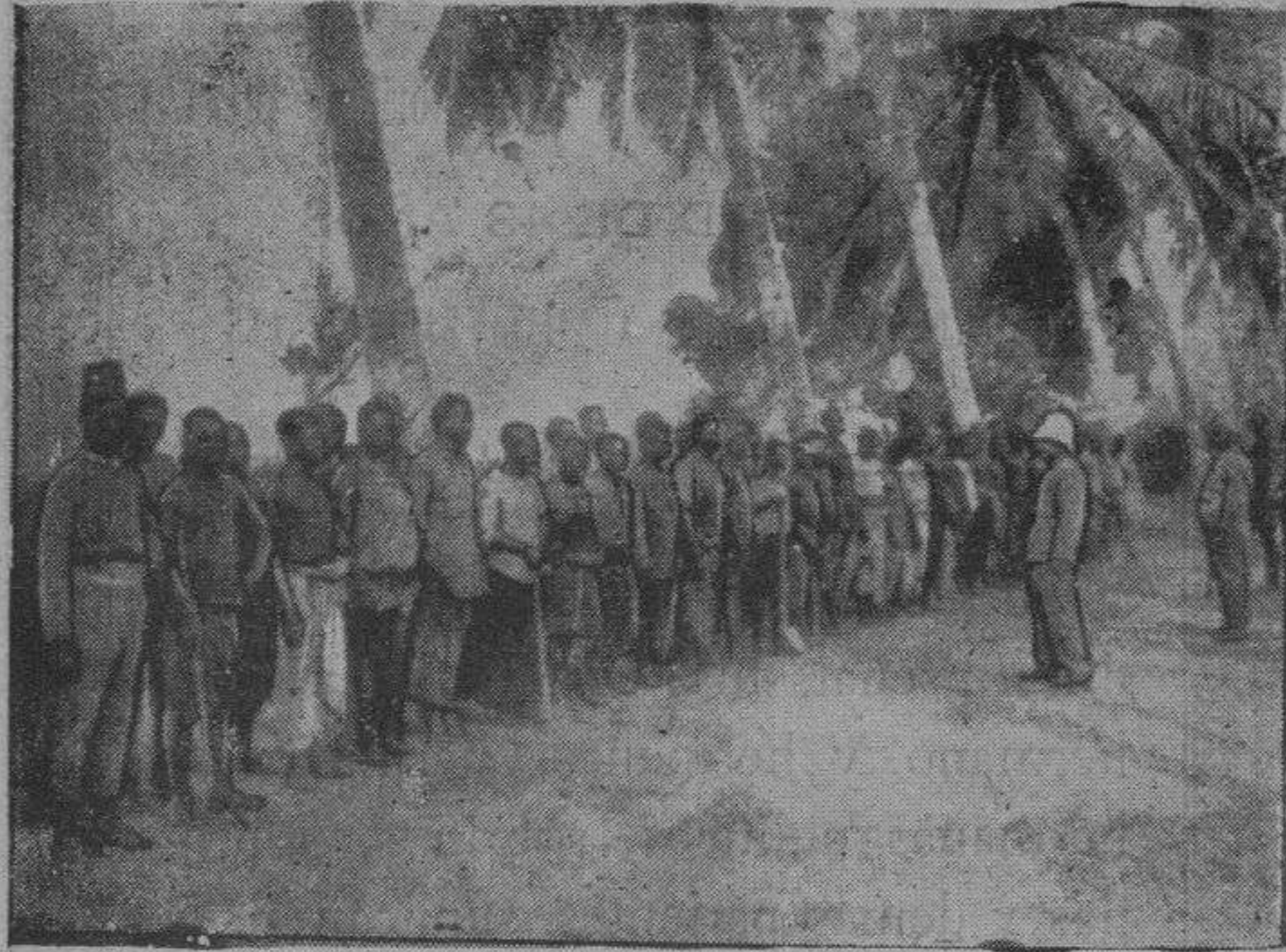
Bajo la nieve