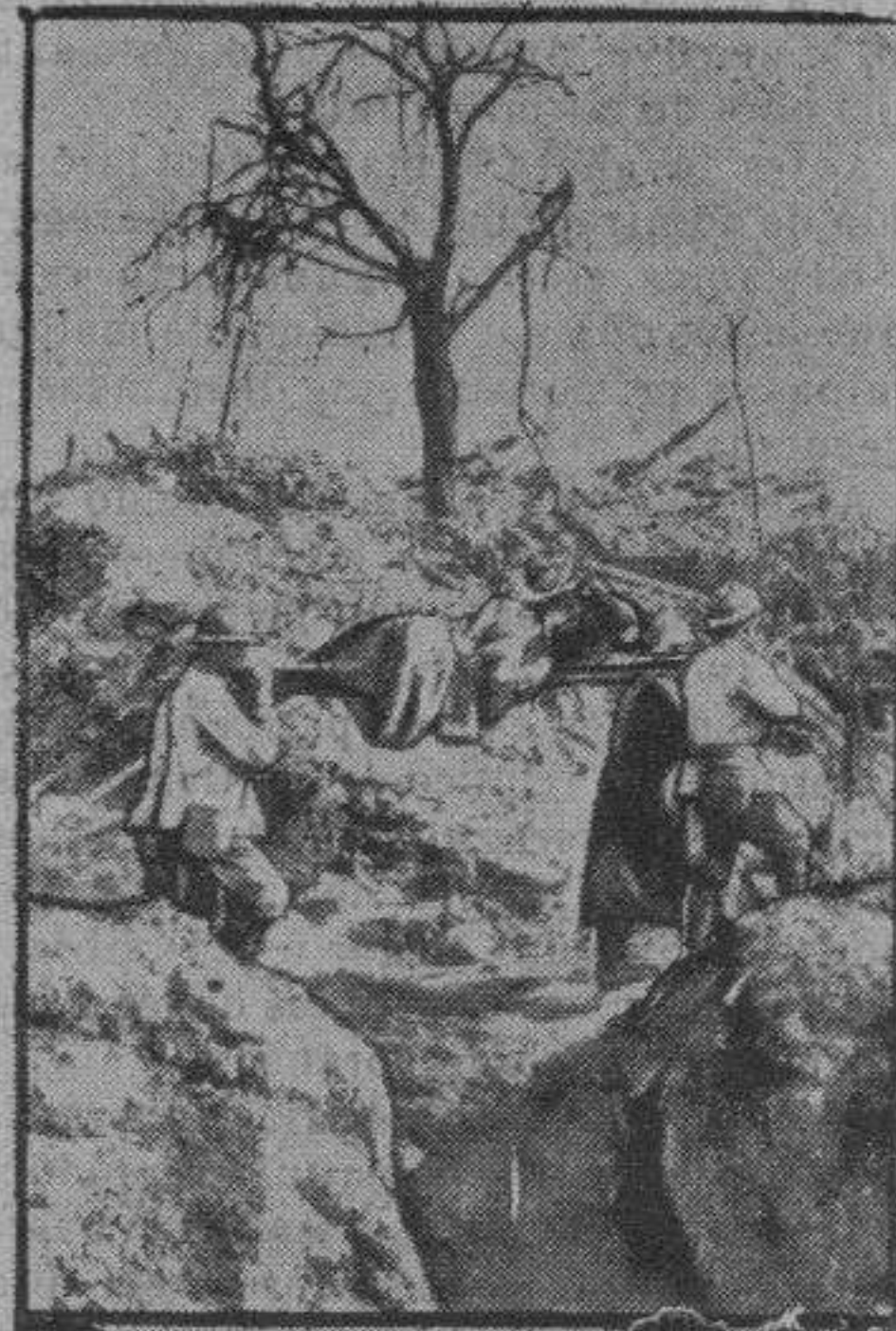
Transporte de un herido

podría decir durante toda mi vida—una vez cumplidas las múltiples obligaciones a que me sujetaba la lucha por la vida, junto con otras de un orden más secundario que en bien de mi país o por el deseo de ser útil en algo a mis semejantes yo mismo voluntariamente me había impuesto, no me quedaba ni una hora siquiera libre en todo el día. Ya dije que aquella «mi fantasía» de implantar en Sóller un servicio de vapor que uniera directamente nuestro puerto con el de Barcelona, estaba en aquellos momentos en vías de realización; pues bien, las dificultades de todo género que hubimos de vencer los veinte accionistas de una tan temeraria empresa, fueron muchas, más, muchísimas más todavía de las que podrían figurarse cuantos hoy, después de veinte y ocho años de tener establecido el importante servicio, quisieran darse de ellas cuenta, como más todavía de los que puede figurarse la juventud actual que aquéllas ignora fueron los sacrificios a que nos obligó nuestro empeño patriótico de llevar a cabo una mejora tan original y que, como todas las que se salen de los moldes de la rutina, tan combatida había de ser por la generalidad de los sollerenses, aún por aquellos que por su conveniencia particular más debieron acercarse y trabajar a nuestro lado para que no se malograran nuestras iniciativas y nuestros afanes.