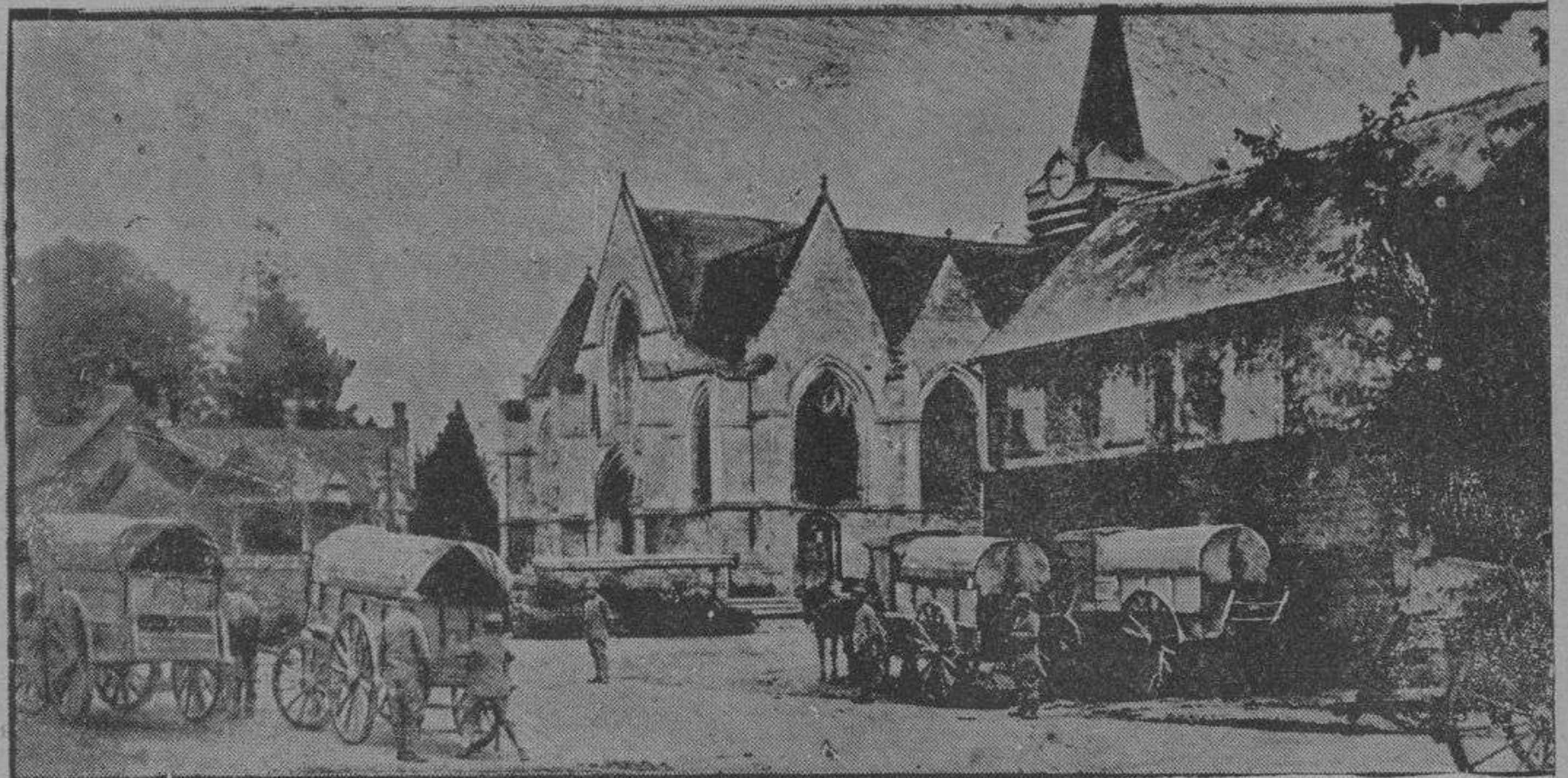
Del frente de Picardía

Don Ramón extraía del sobre un «vale» de Prensa.