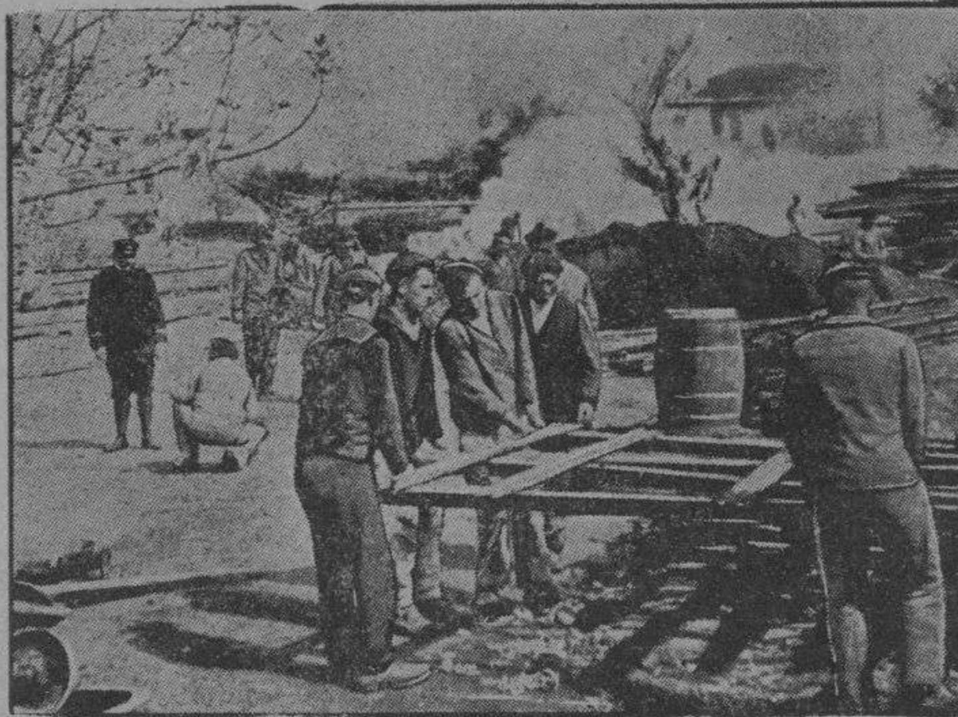
Colocación de hilos telefónicos

y una alimentación tan deficiente, no podían dar otro resultado. Es el galardón que aguarda á los pobres luchadores de esta clase.