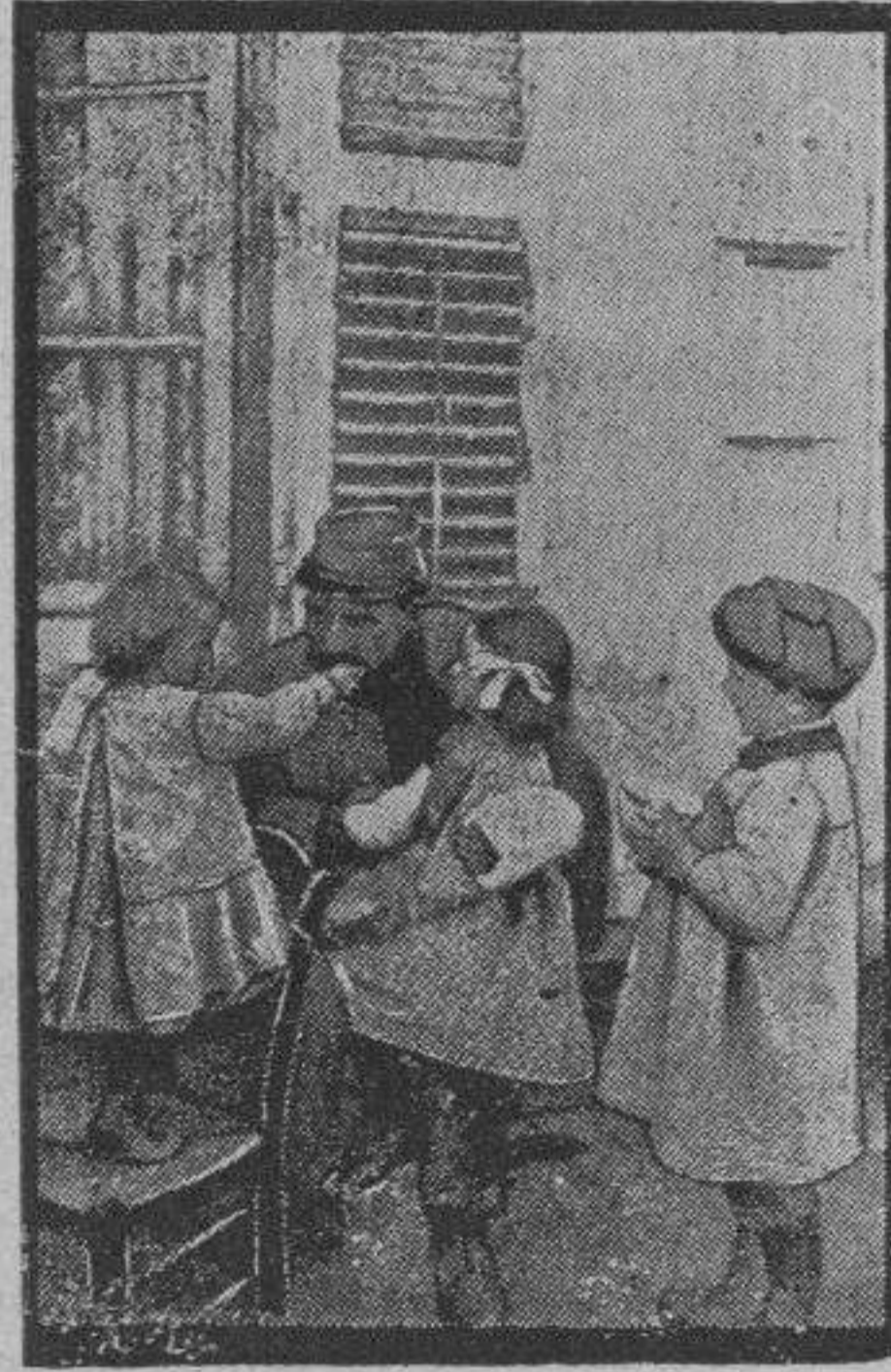
Un herido en la retaguardia

gunda vez me involucraba y decidí demostrarle que eran temerarias y vecinas de la injusticia las opiniones que aquella buena señora tenía de la justicia y de sus auxiliares.