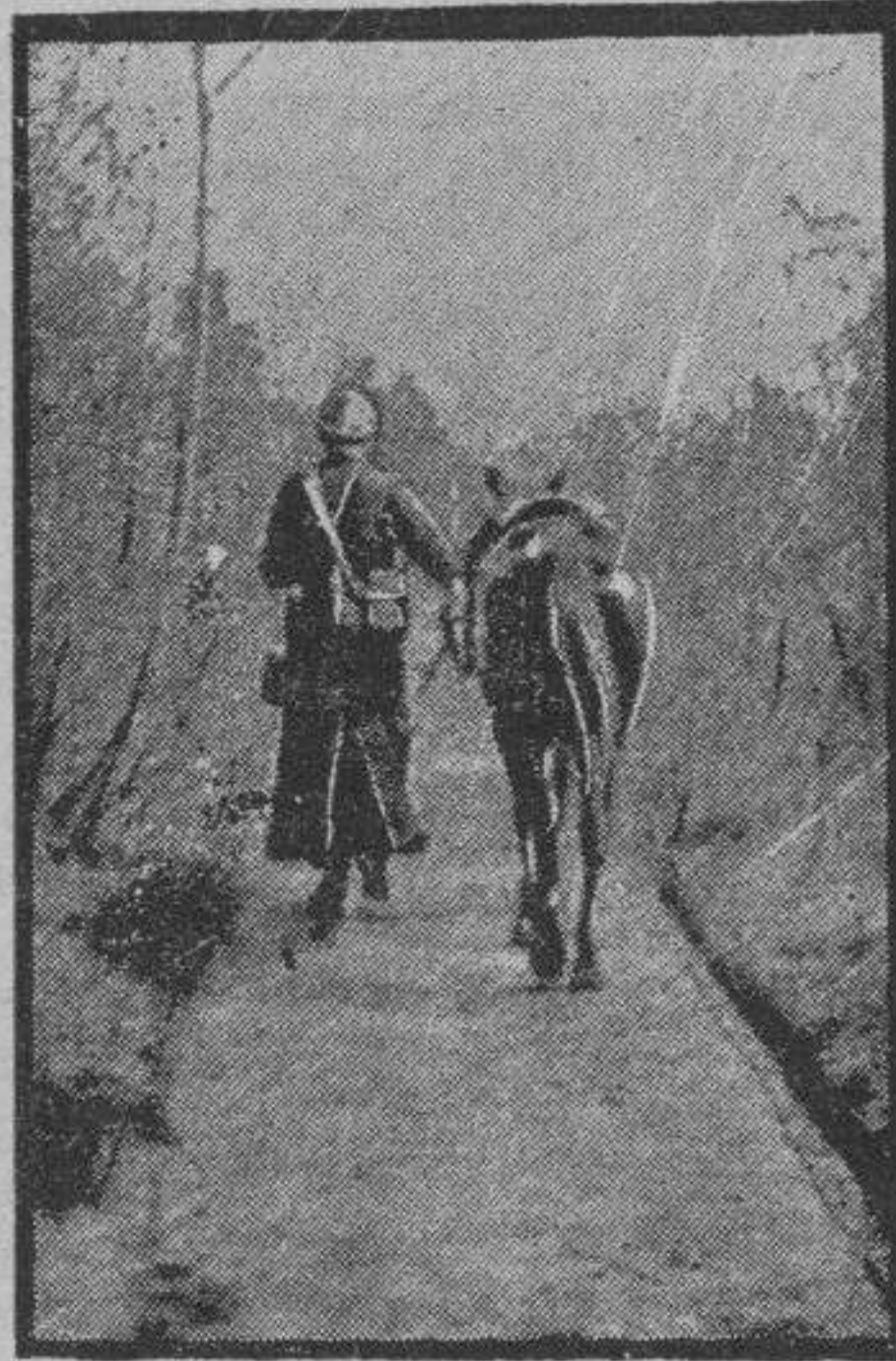
En buena unión en las avanzadas