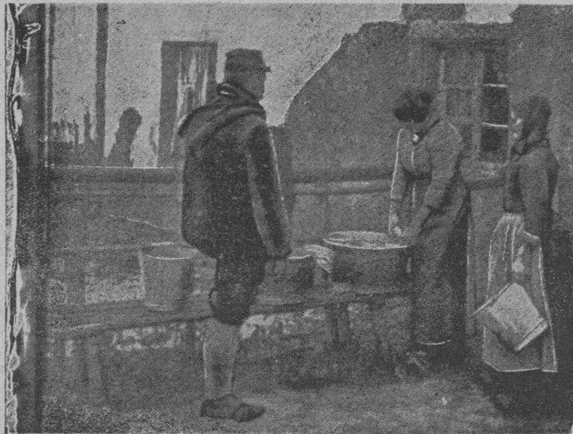
La colada detrás de la línea de fuego

comido?...» ¡Mira!—le diré, mostrándole el «menú»—; y ella, leyéndolo con algún trabajo, y sin sacar fuera de las sábanas más que los dos dedos con que aprisione la cartulina impresa, exclamará, cada vez más fuerte: «¡Puré parmentier!»... «¡¡Salmón con mayonesa!!»... «¡¡Pollo con champignon!!»... ¡Vinos... postres, Champagne... café!»... Y devolviéndome el «documento» me dirá... como todos los años: «¡Chico, que cosas!»