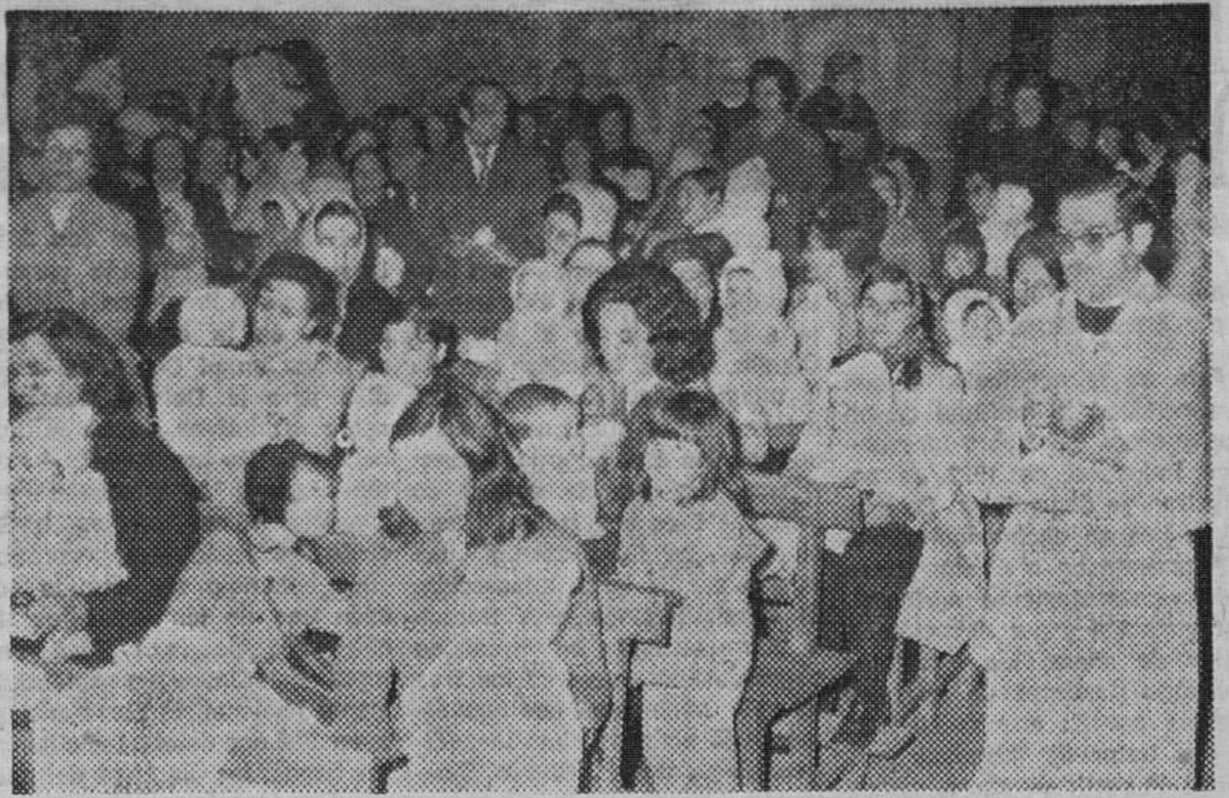
Un momento de la emotiva ceremonia de presentación y ofrenda de niños en la iglesia de Gamonal.

Hoy, a las once y media, se oficiará un funeral por los jóvenes del barrio que fallecieron el año último.