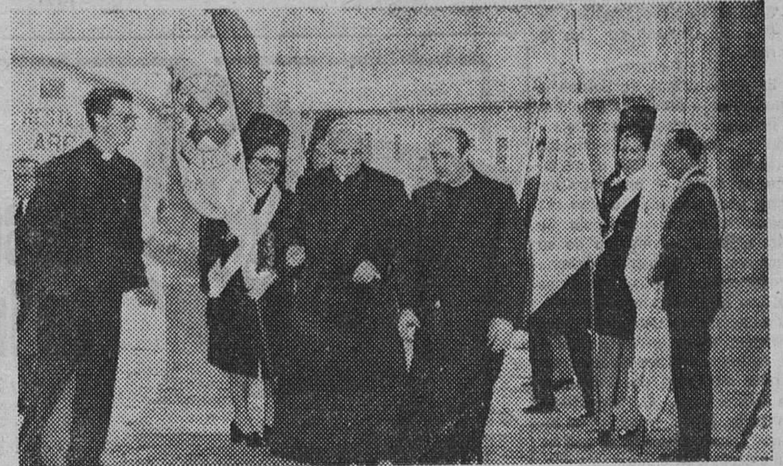
Nuestro Rvdo. Prelado a su llegada a la parroquia de Nuestra Señora la Real y Antigua, de Gamonal, para asistir a los cultos de la festividad de las Candelas.