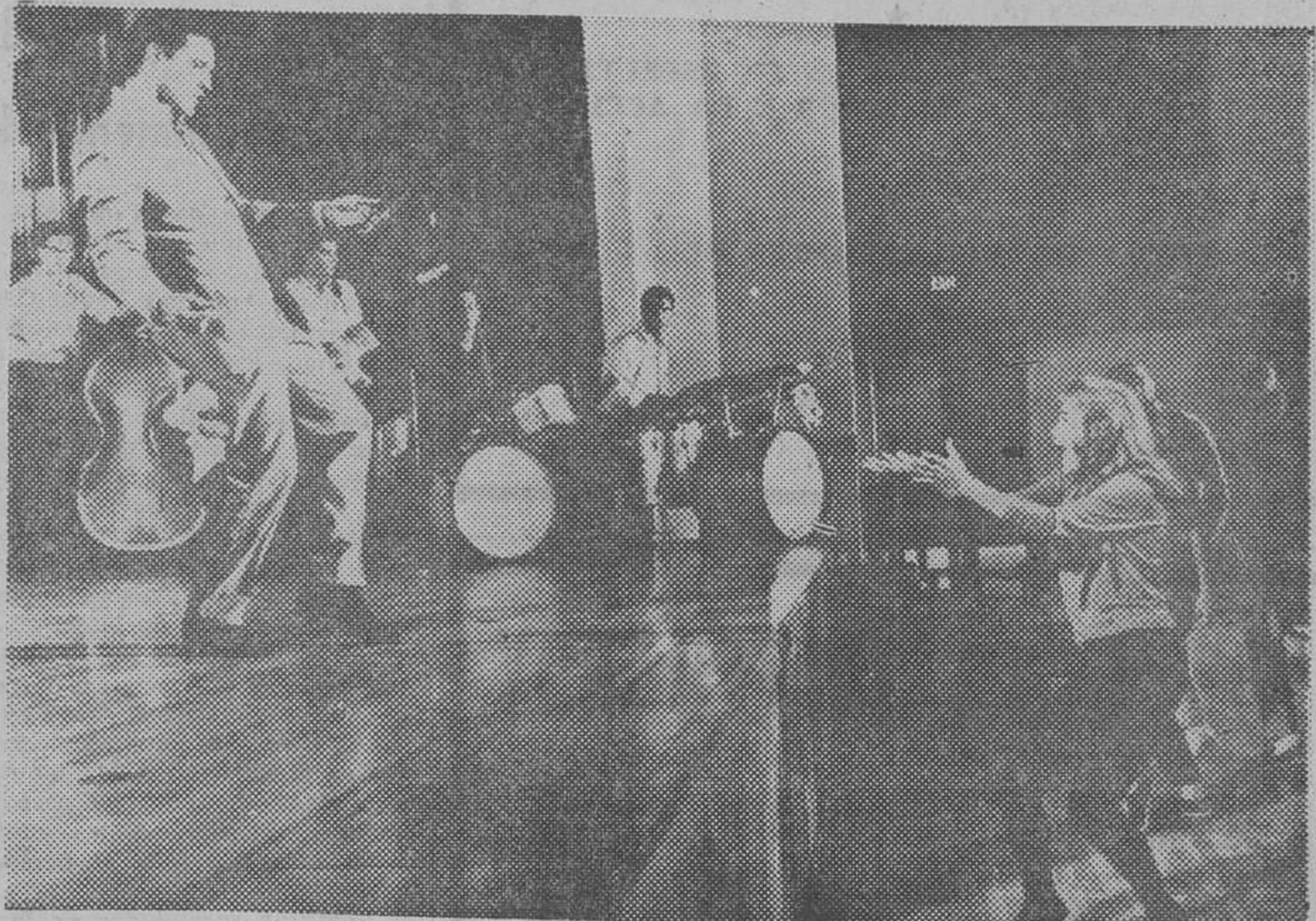
Elvis Presley arrebató a sus «fans» en sus interpretaciones, pero tiene auténtico pánico a viajar en avión.

Pero, no. Elvis Presley se ha negado. Y no porque la cifra le parecía insuficiente. No, no. El motivo es más simple. —Les tengo verdadero terror a los aviones. Y prefiero no viajar largas distancias. Esa es la causa. Y es cierto. Elvis no ha viajado a Europa más que en una