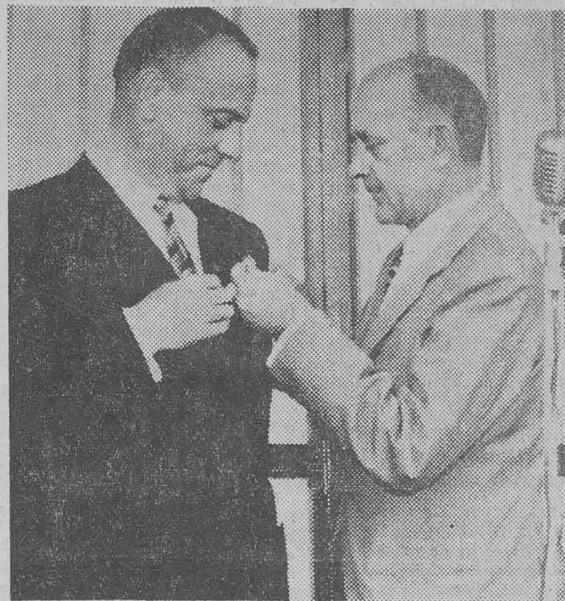
Villalba. — En el transcurso del homenaje que su pueblo natal tributó, el pasado día 23, al ex-ministro de Información y Turismo don Manuel Fraga Iribarne, hijo predilecto de la villa, el gobernador civil de la provincia don Guillermo Ruipérez, en nombre del señor Sánchez Bella, impuso a don Manuel Fraga la medalla de oro al Mérito Turístico. En la foto, un momento del acto.