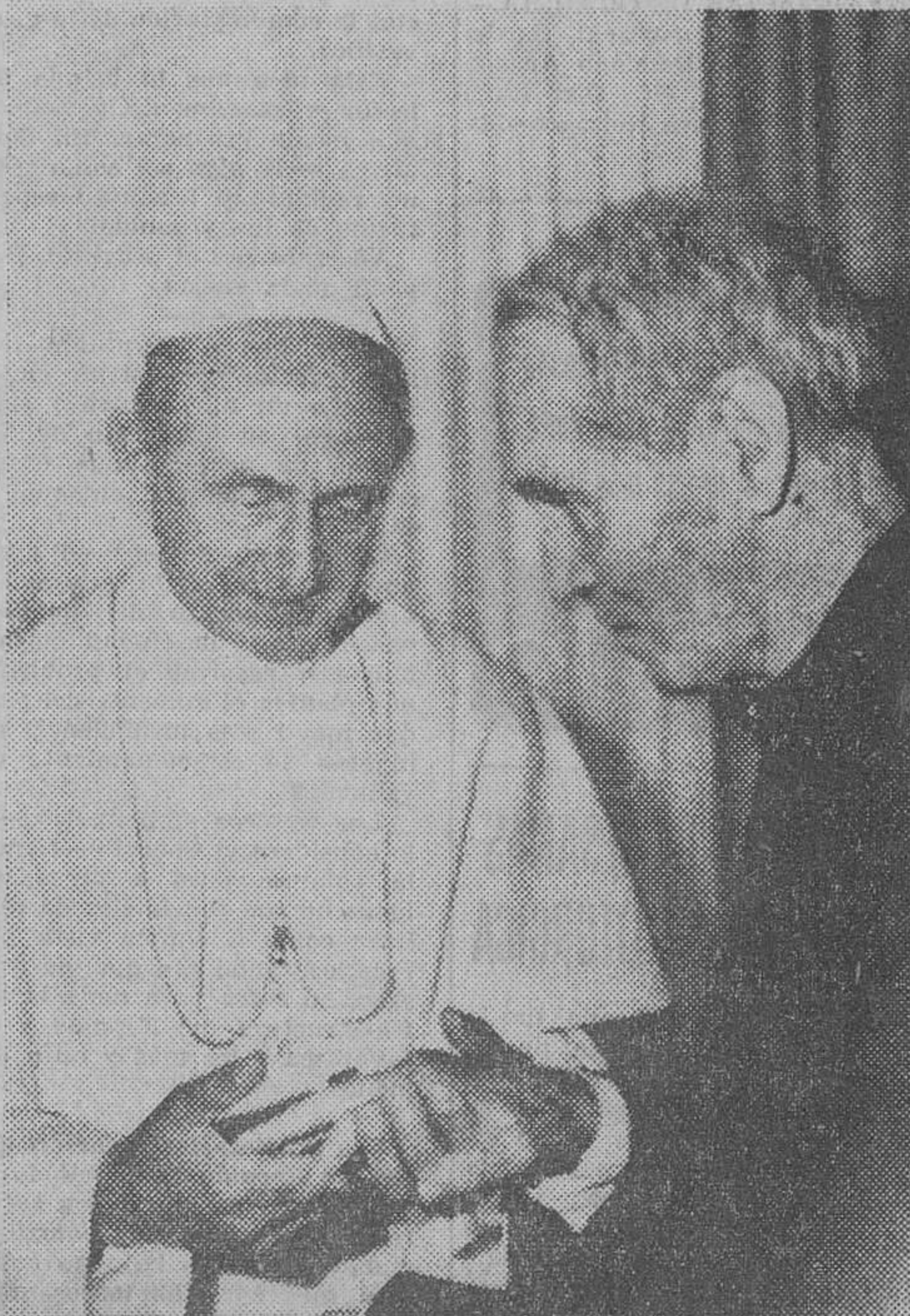
Castelgandolfo (Italia). — El Papa Pablo VI da la mano al obispo de Estados Unidos, James E. Walsh, el cual estuvo doce años prisionero en una cárcel comunista de China, durante la conversación, en la residencia de verano del Papa.