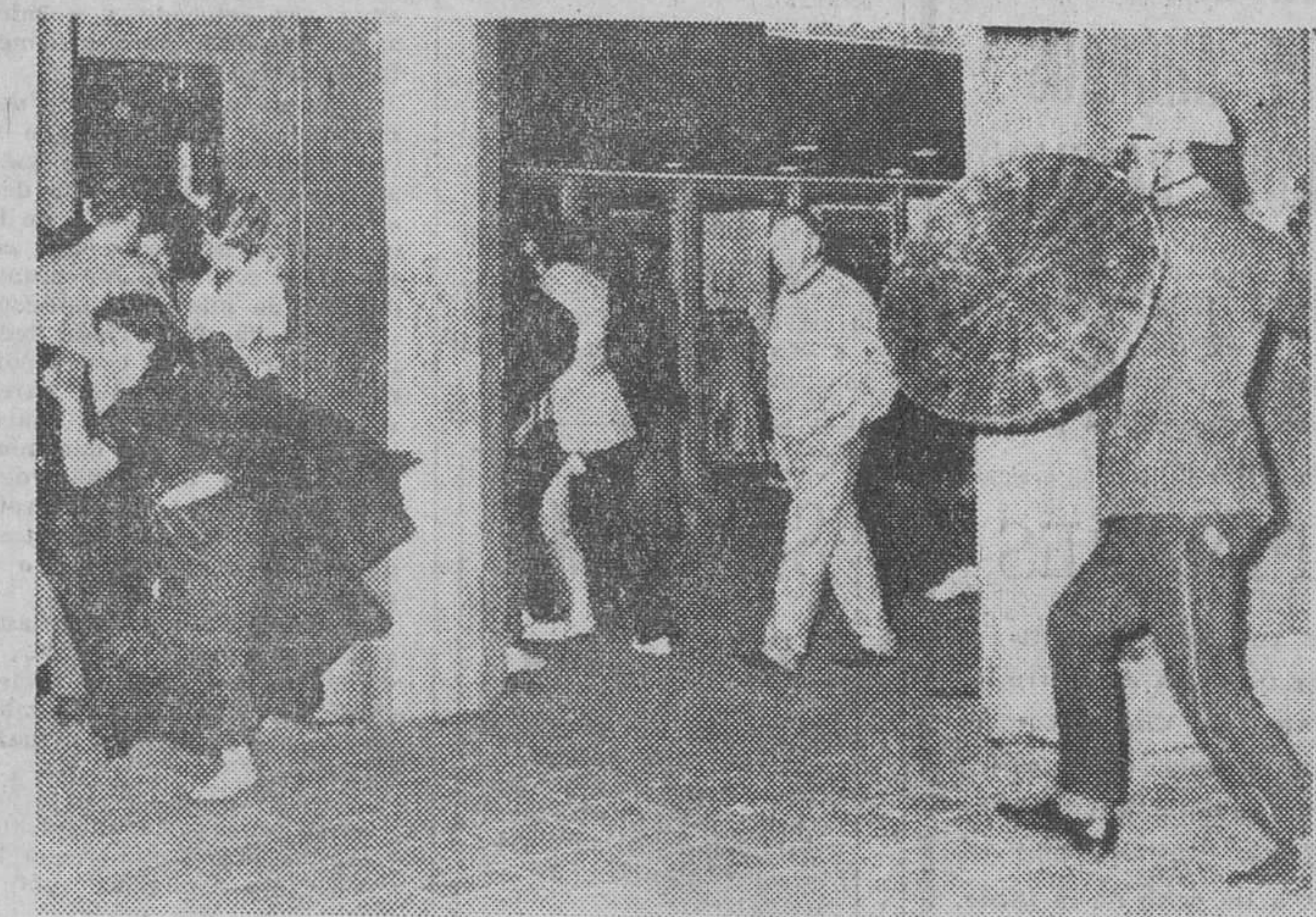
Amsterdam. — El Dam, en Amsterdam, fue el lugar de un violento enfrentamiento entre la Policía y un grupo de jóvenes «hippies». En la foto, un policía preparado para atacar, y a la izquierda, una joven con un ladrillo en la mano.