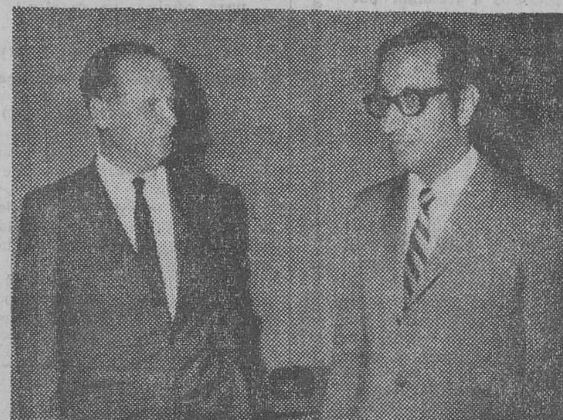
Naciones Unidas (Nueva York). — El mediador de las Naciones Unidas, Gunnar Jarring, ha celebrado conversaciones en la sede de la ONU con los embajadores de Israel, de la R.A.U. y de Jordania, sobre la situación en Oriente Medio. En la fotografía, Jarring (izquierda) conversa con el embajador jordano, Abdu Hamid Sharaf.