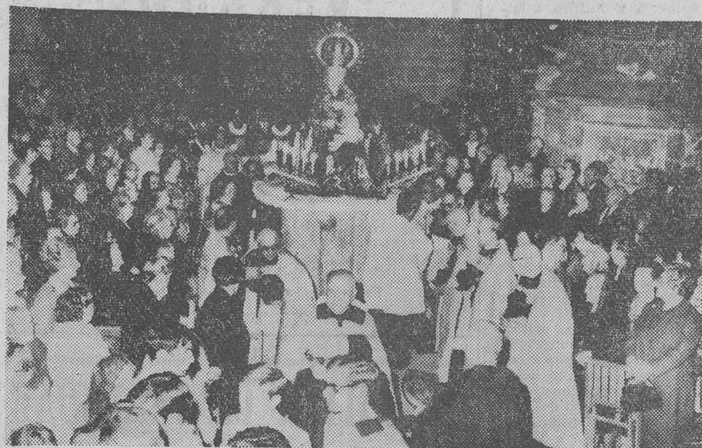
Con la solemnidad de años anteriores, se efectuó ayer tarde la renovación de la consagración de la ciudad al Inmaculado Corazón de María, como culminación del octavo día en honor de Santa María la Mayor. — He aquí el aspecto que ofrecía la nave mayor de nuestro templo catedralicio durante la ceremonia. — Foto FEDE. (Información, en cuarta página).