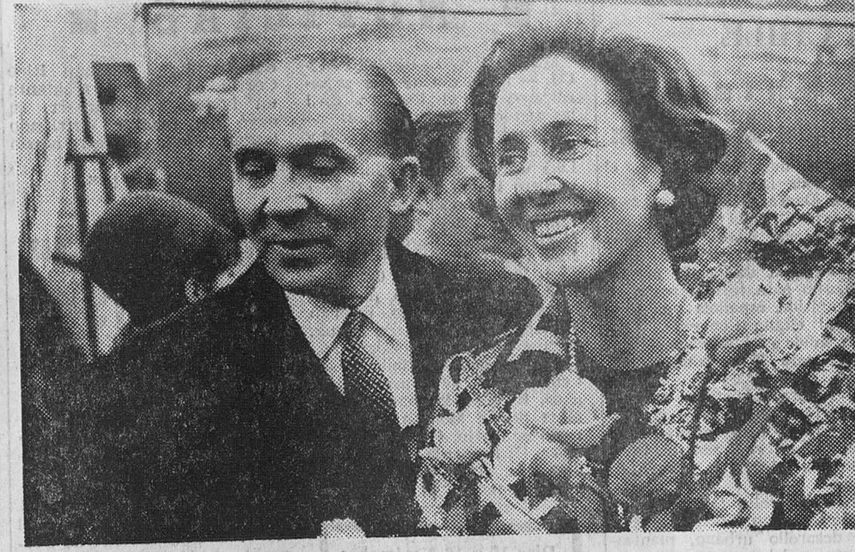
Procedente de Bruselas llegó a Madrid la Reina Fabiola de Bélgica para realizar una visita privada que durará varios días. En esta foto la vemos en el aeropuerto de Barajas, donde fue recibida por el embajador belga y otras autoridades españolas.