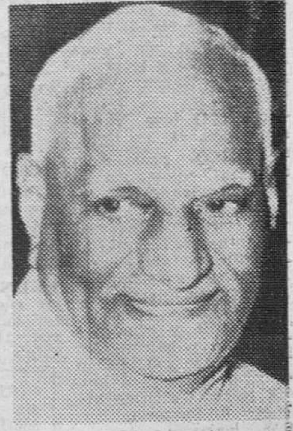
Nueva Delhi. — Fotografía de archivo del nuevo presidente indio V. V. Giri. Respaldo por la primer ministro Indira Gandhi, Giri ganó las elecciones presidenciales.