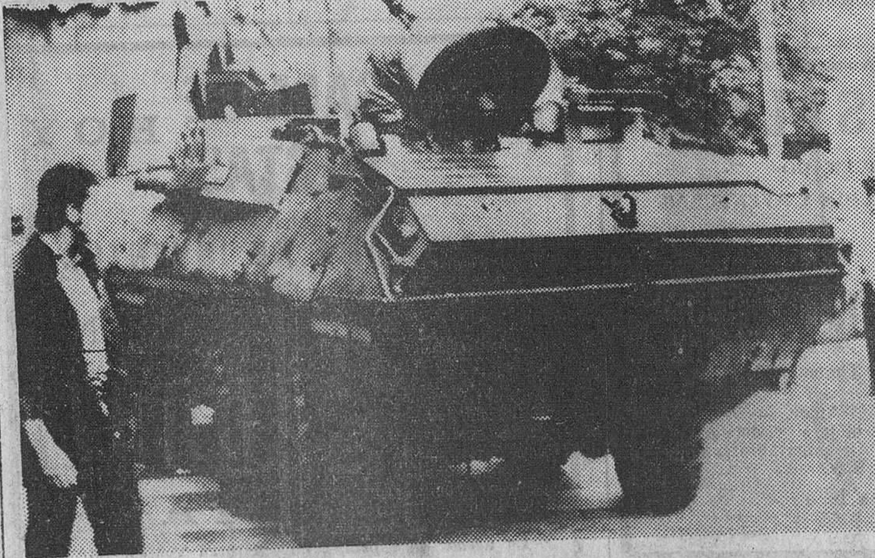
Praga. — Un checo observa un coche de Policía blindado y armado que bloquea una calle que conduce a la plaza de San Wenceslao, después de que la Policía impidiera la reunión de miles de checos en el primer aniversario de la invasión soviética a Praga.

San Sebastián (Logos). — En su despacho del Ministerio de Jornada, el ministro de Asuntos Exteriores, señor Castiella, ha recibido en audiencia al embajador de Estados Unidos en España, mister Robert Hill, y al embajador de España en Bruselas, don Jaime Alba. Igualmente, el señor Castiella recibió a las primeras autoridades civiles y militares de la provincia y al coronel jefe del aeropuerto de Fuerteventura.