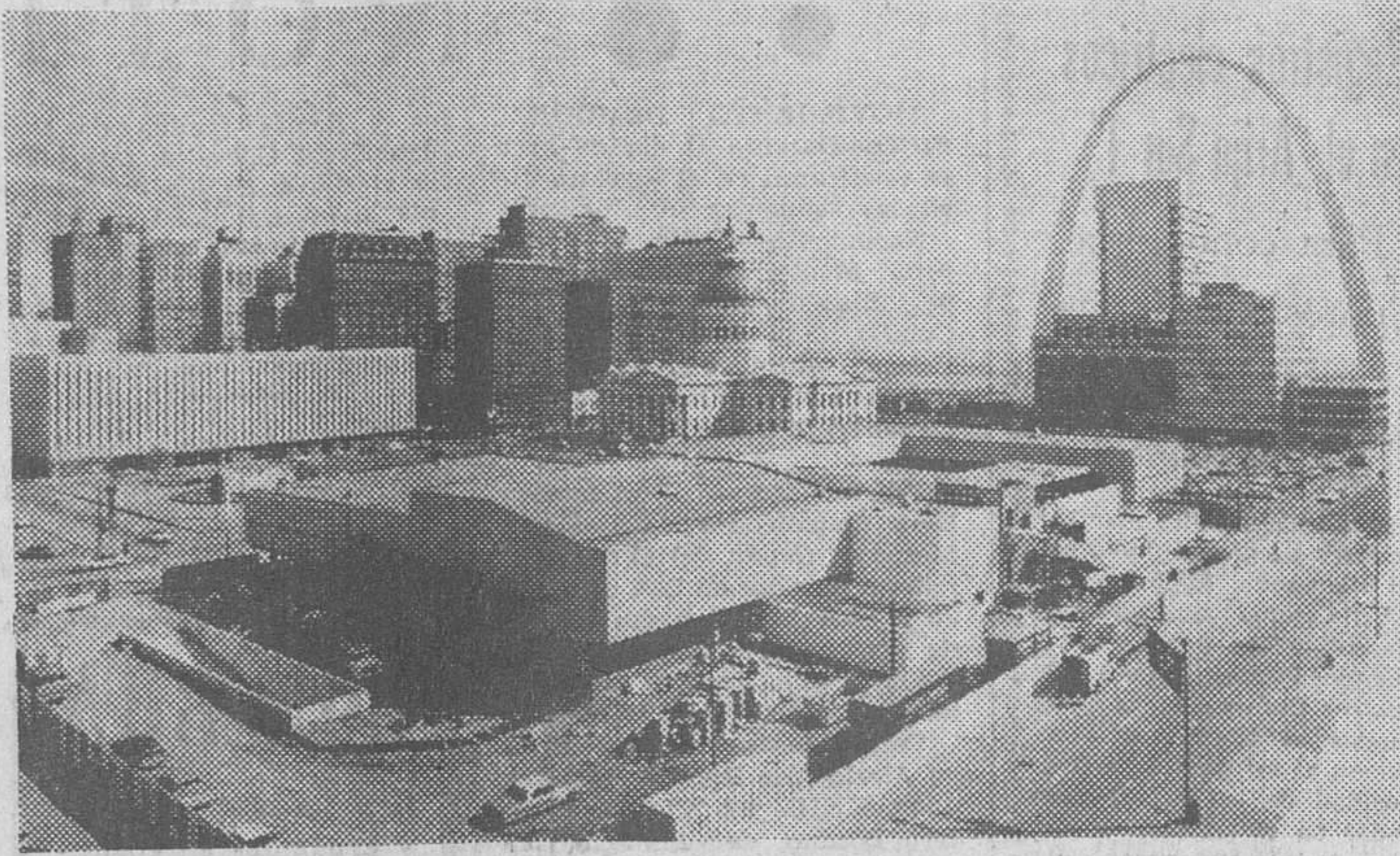
St. Louis. — El pabellón español de la Feria Mundial de Nueva York 1964-65, que obtuvo el calificativo de «joya de la feria», está siendo reconstruido en la ciudad norteamericana de St. Louis (Missouri), a la que se hizo donación del mismo, a petición de su Ayuntamiento. El pabellón estará dedicado a diversas actividades de orden cultural, principalmente españolas e hispanoamericanas. Su inauguración está prevista para el 19 de Abril de 1969. En la foto, el pabellón en la actualidad. A la derecha, el famoso Arco de Lerc Sarinen, monumento federal a la gesta de la apertura del Oeste en las orillas del Mississippi.