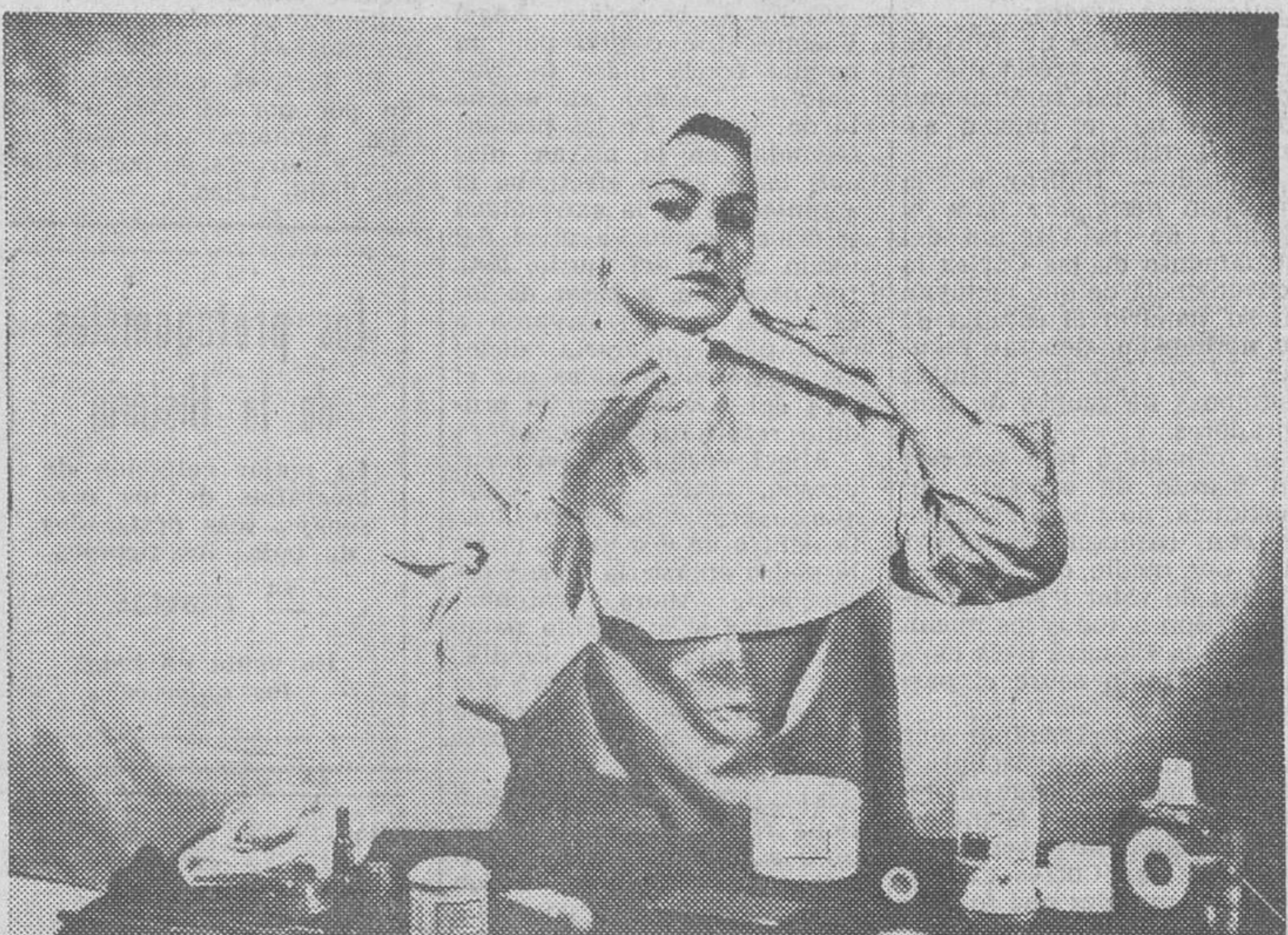
¡Manos a la obra! Esta joven limpia y prepara su cutis para hacer frente a los fríos del otoño. No cabe duda de que con estos cuidados, estará guapa esta temporada.

Empecemos pues, a hacer frente a esta nueva etapa que se inicia y preparemos el cutis para recibir, más tarde, el aire frío del Invierno y los duros contrastes entre los tibios interiores y el frío de la calle.