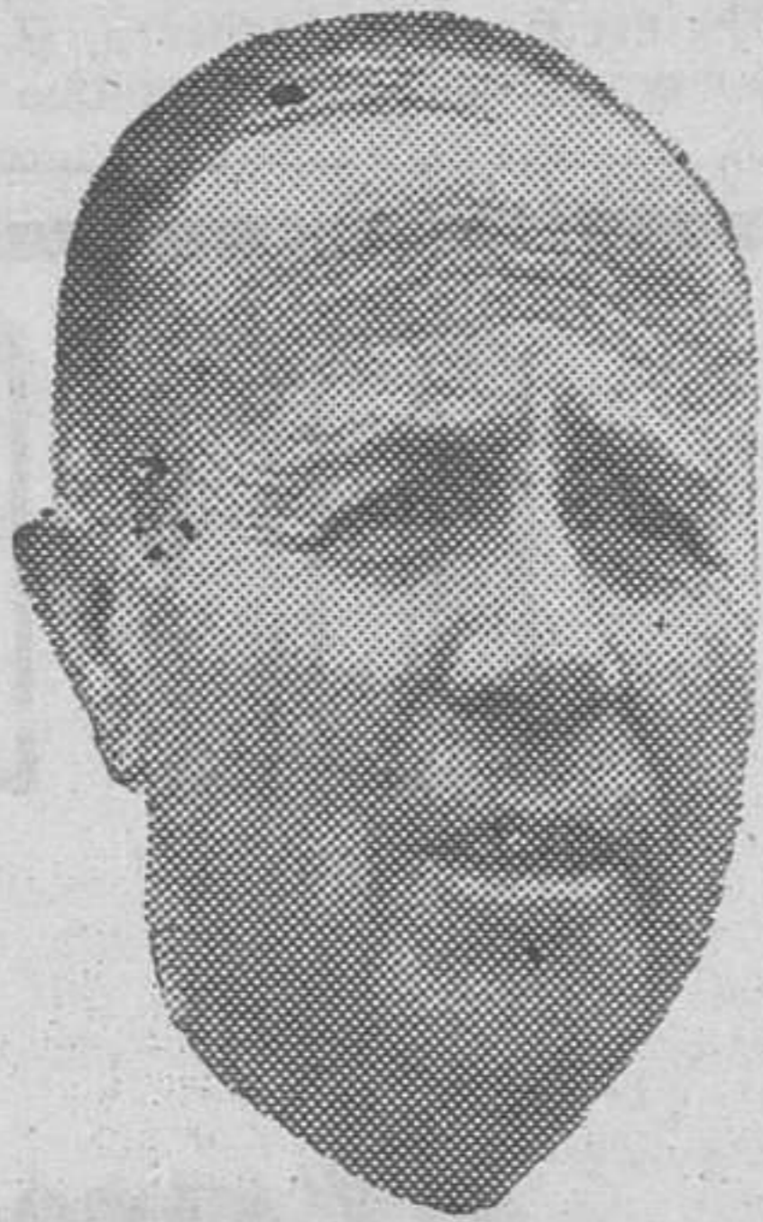
Por PEDRO ESCARTIN

Madrid. (Crónica deportiva de la Agencia LOGOS). — Hay dos sistemas para hacer un equipo de fútbol. El primero, y más fácil, entregarse en brazos de los intermediarios y comprar los teóricos fenómenos que ellos ofrecen; el segundo, camino más largo e incómodo, pero de mayor gloria y mejor economía, proteger la cantera propia por medio de equipos infantiles, juveniles y aficionados, para formar así a los jugadores. Es curioso que el aún imbatido Real Madrid cuida hace años su vivero de producción y busca en todas partes lo que precisa, sin necesidad de acudir a intermediarios ni entrar en la subasta de los traspasos de jugadores.