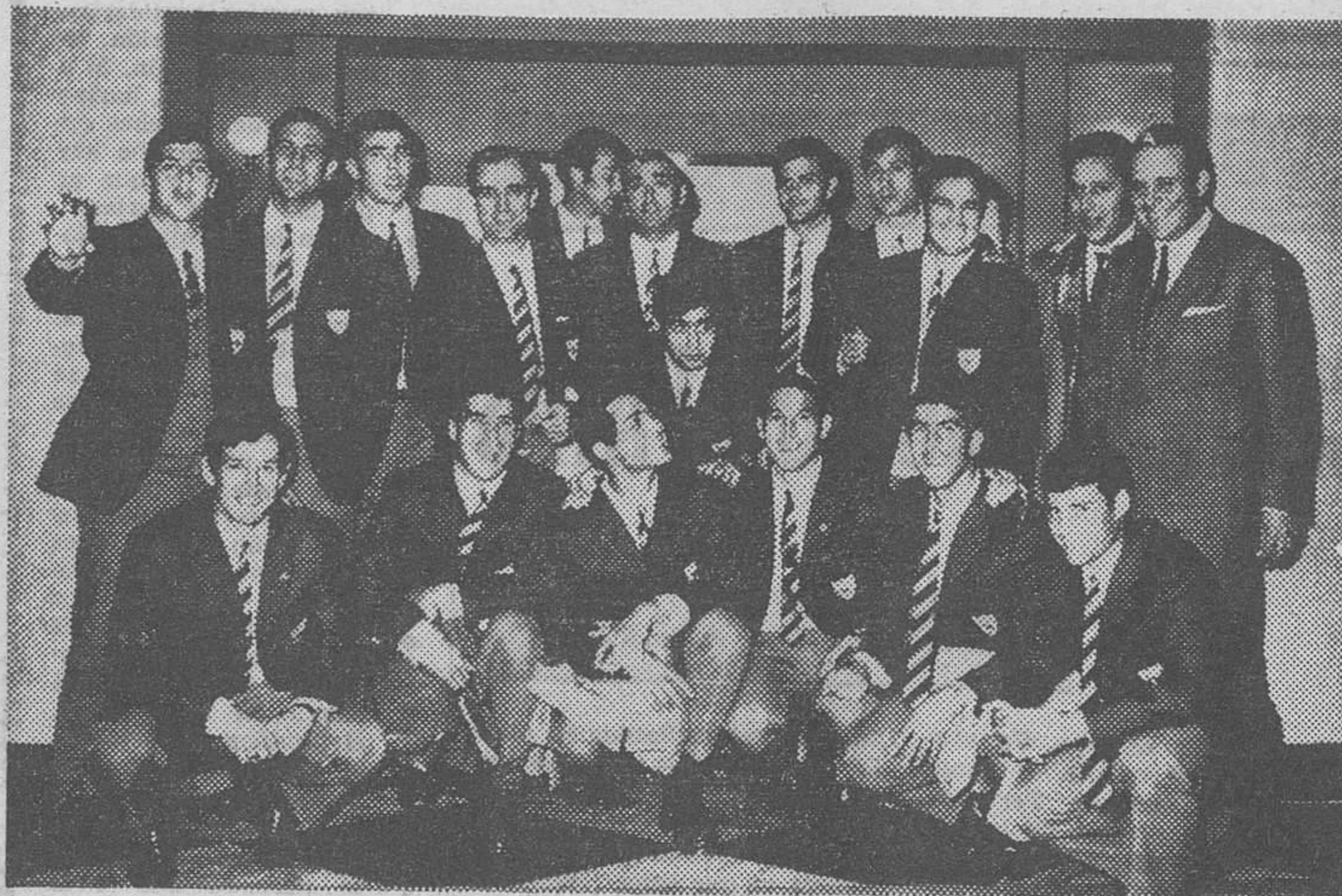
La expedición sevillista posa para DIARIO DE BURGOS, poco después de su llegada a nuestra ciudad.

El Sevilla tiene decidida su alineación mientras el Burgos mantiene una duda