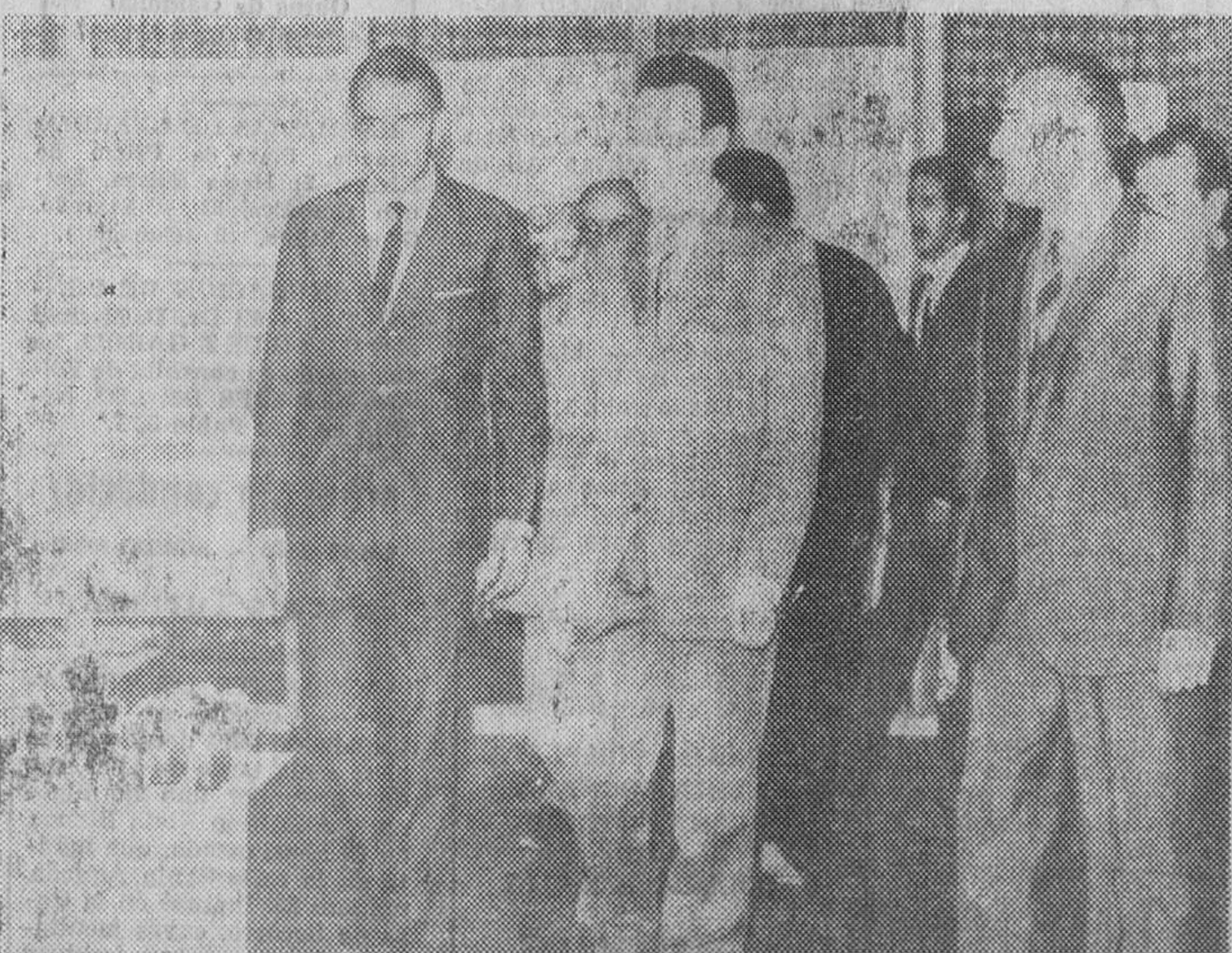
Argel. — El presidente Bumedian, acompañado por el embajador de España y el consejero comercial, visita el interior del pabellón español en la Feria internacional de Argel.