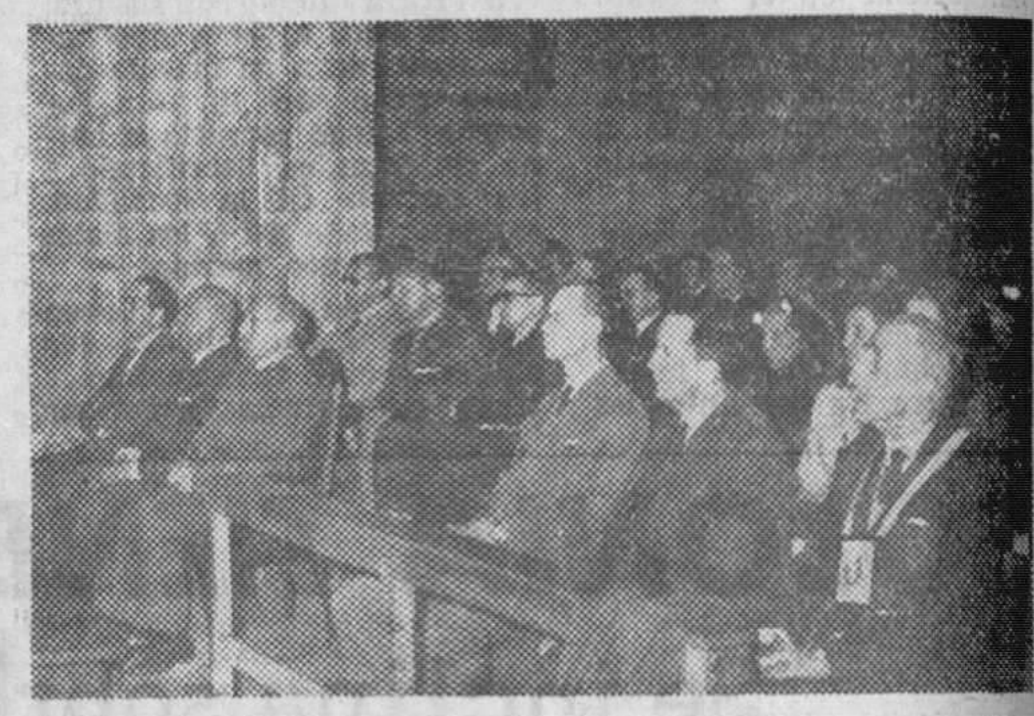
Actos de la festividad de San Francisco de Asís, patrono de los Cuerpos Forestales.