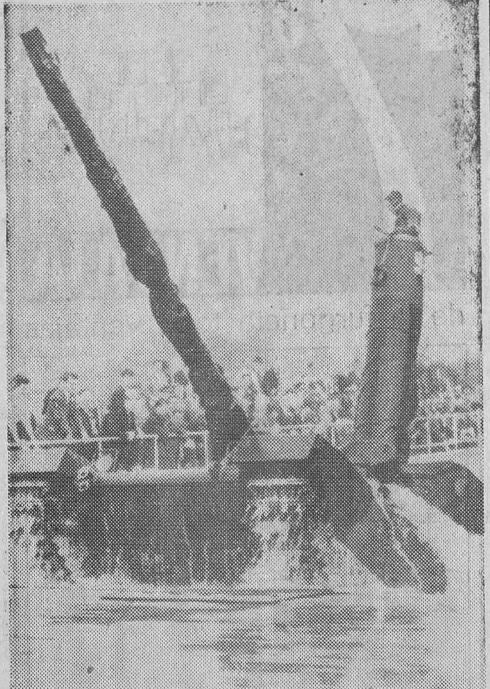
En el Establecimiento de Investigación y Desarrollo de Vehículos Militares de Chertsey, Surrey (Inglaterra), ha tenido lugar una exhibición de diversos tipos de esta clase de vehículos. En la fotografía vemos un nuevo tanque, el «Chieftain», que será entregado a finales de año al Regimiento estacionado en Alemania. Pesa 45 toneladas, tiene un cañón de 125 milímetros y una torreta rotatoria con puesto de observación, para una más completa visión del comandante del vehículo, quien desde allí transmite las órdenes oportunas a los artilleros.