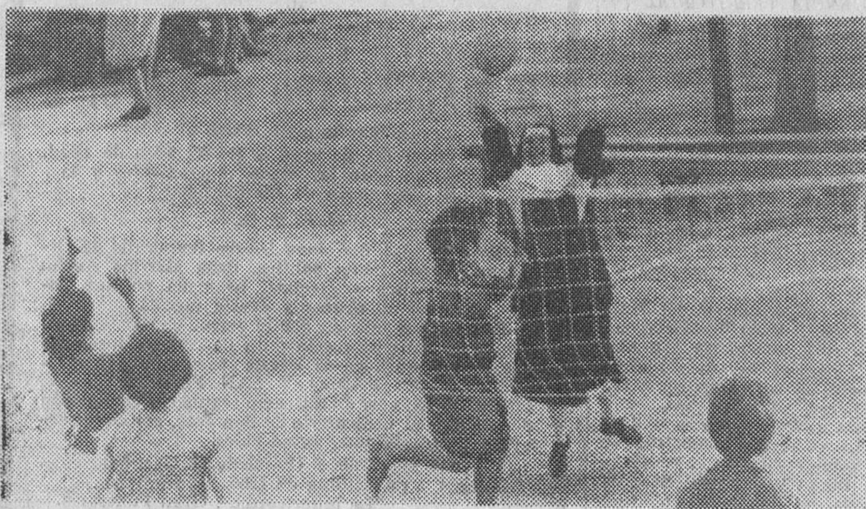
Esta curiosa escena tiene lugar en la Casa Correccional de Mujeres de Santiago de Chile. Una simpática monjita anima uno de los partidos de balonvolea con que se distraen las reclusas. Su espontánea alegría contrasta con la triste vida de las mujeres que pagan su deuda con la sociedad.