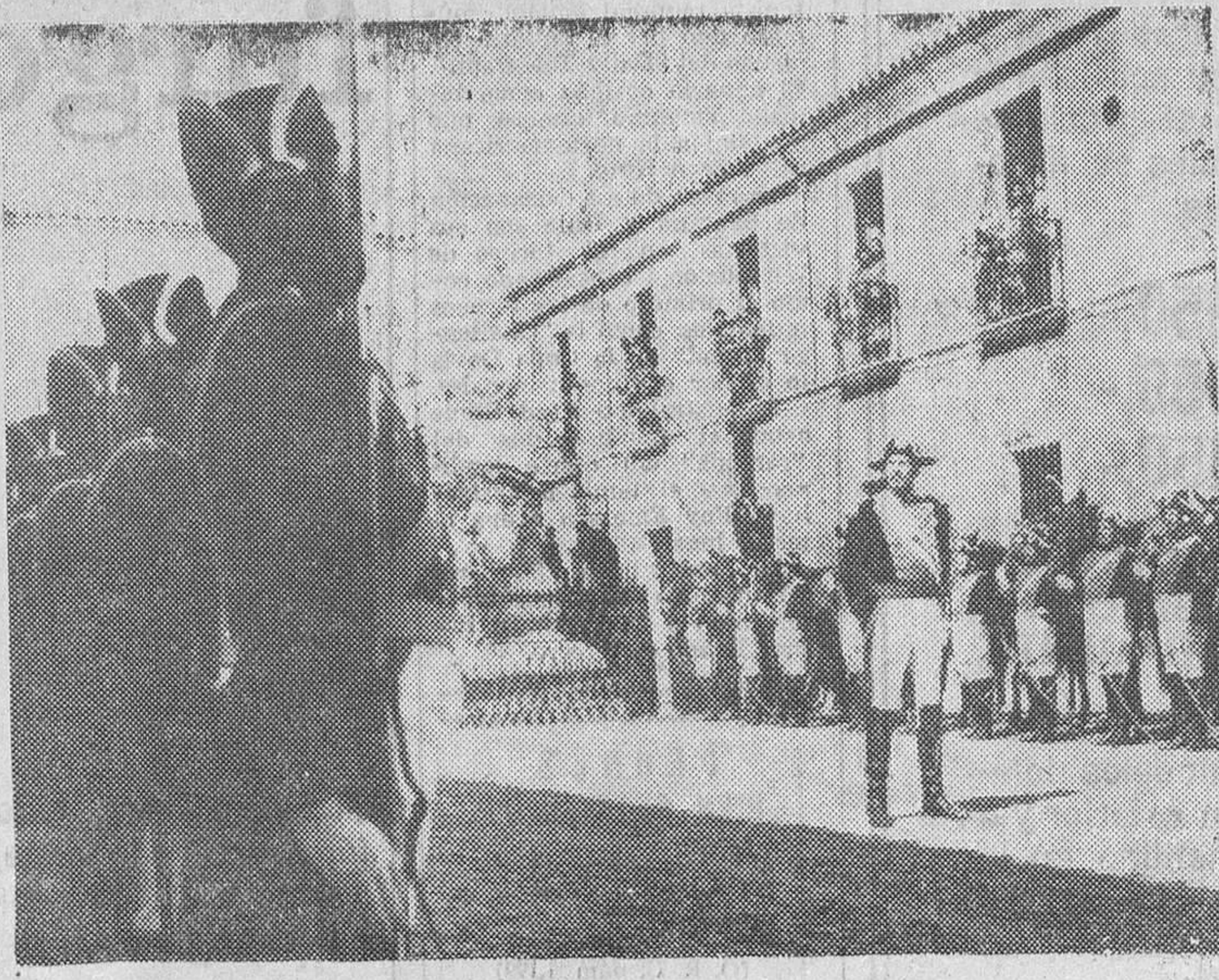
Madrid. — He aquí una de las escenas de la película «El primer cuartel», historia novelada sobre la fundación de la Guardia Civil, estrenada ayer en el cine «Conde Duque» de Madrid en función de gran gala a beneficio de los colegios de huérfanos de la benemérita Institución.