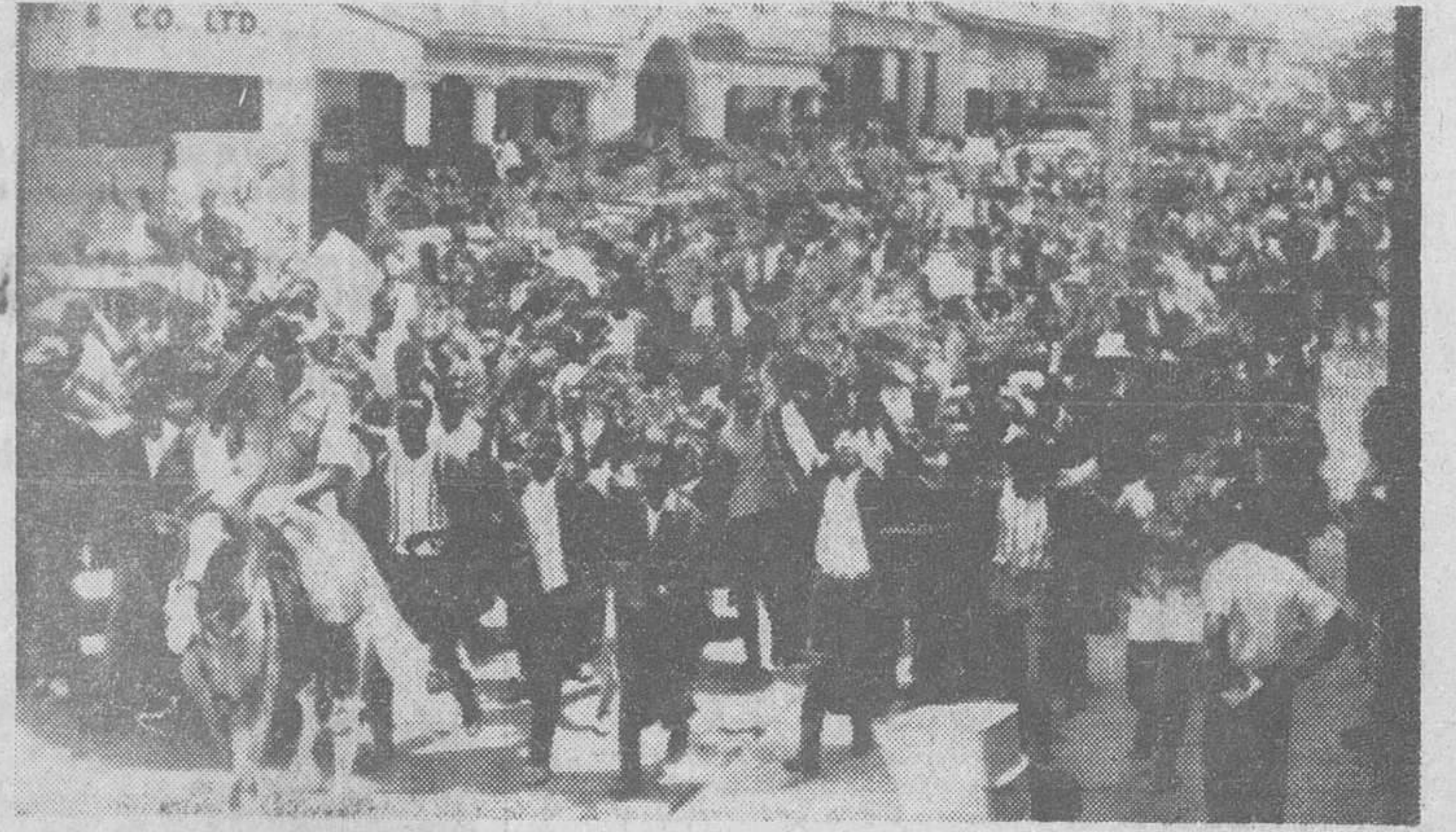
Accra (Ghana). — Manifestaciones de estudiantes por las calles de la capital, en apoyo del golpe de Estado que expulsó del poder al presidente Nkruman.