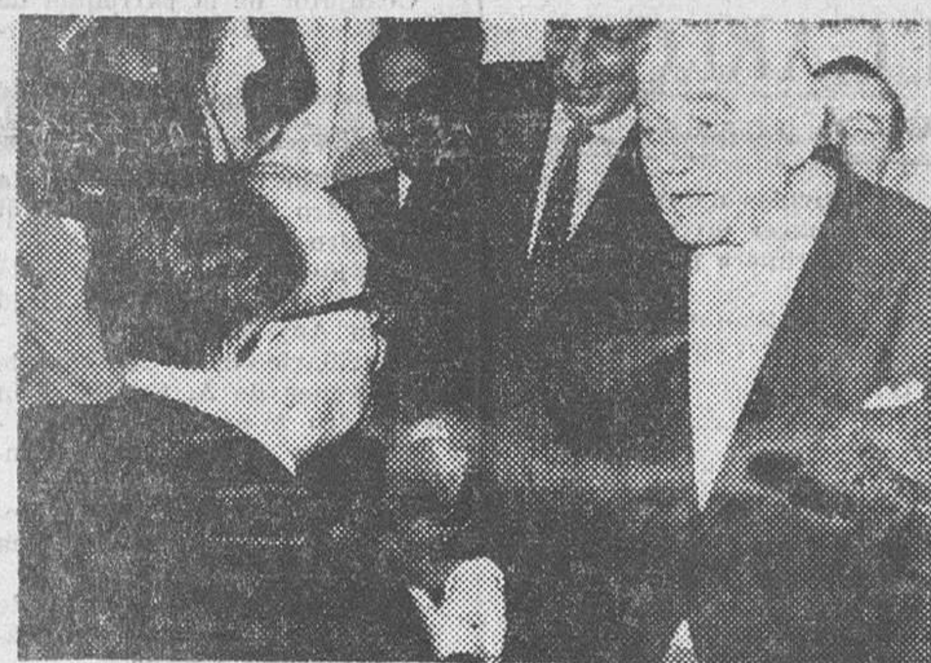
Atenas.—El ex-primer ministro, George Novas (derecha) felicita al nuevo primer ministro de Grecia, Elias Tsirimokos.