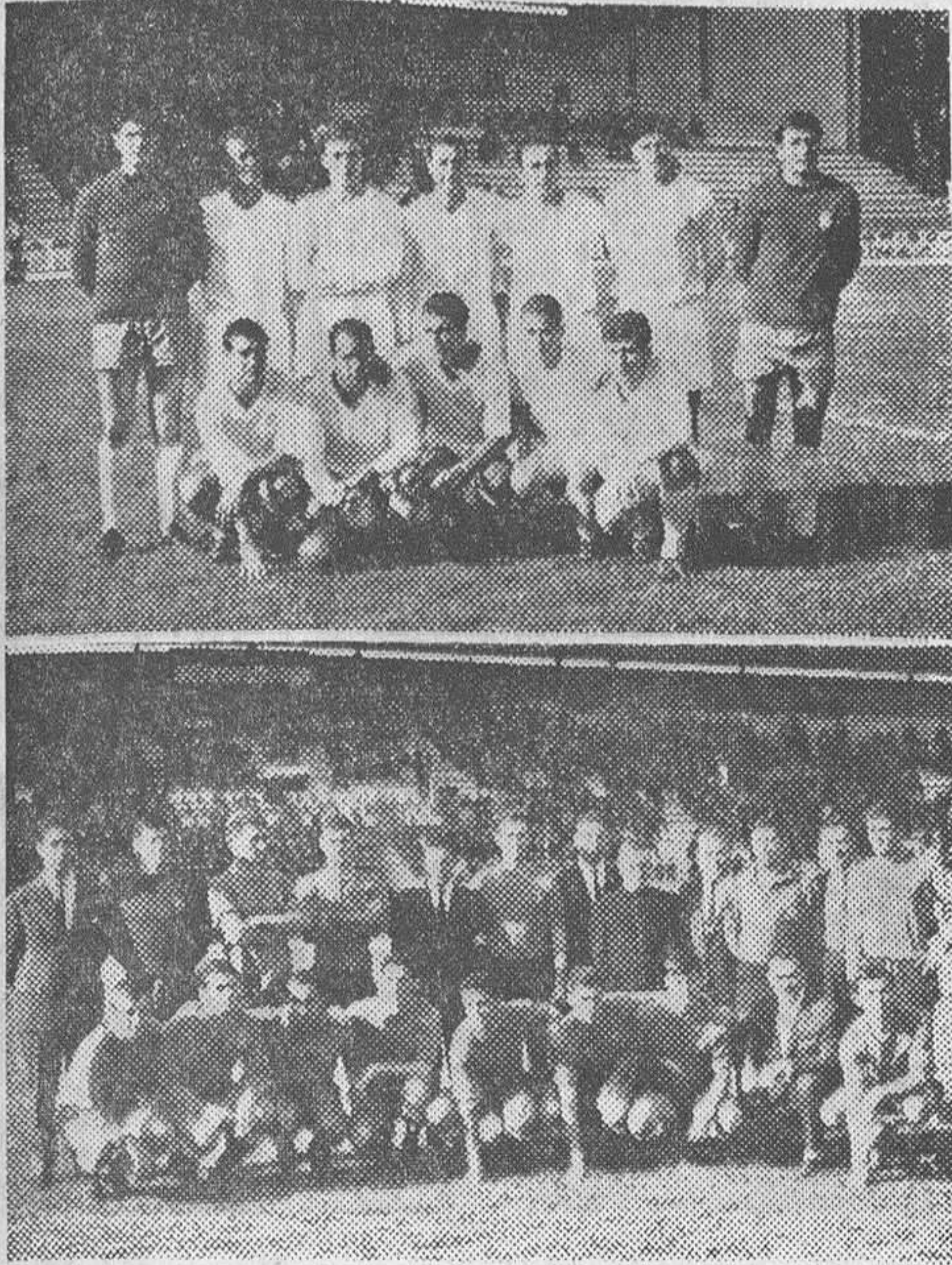
Los equipos del Real Madrid y del Burgos, alineados en "El Plantío", momentos antes de dar comienzo el partido del domingo.

Los jugadores locales causaron buena impresión, habiendo que registrar la expulsión de Suárez en el bando madridista