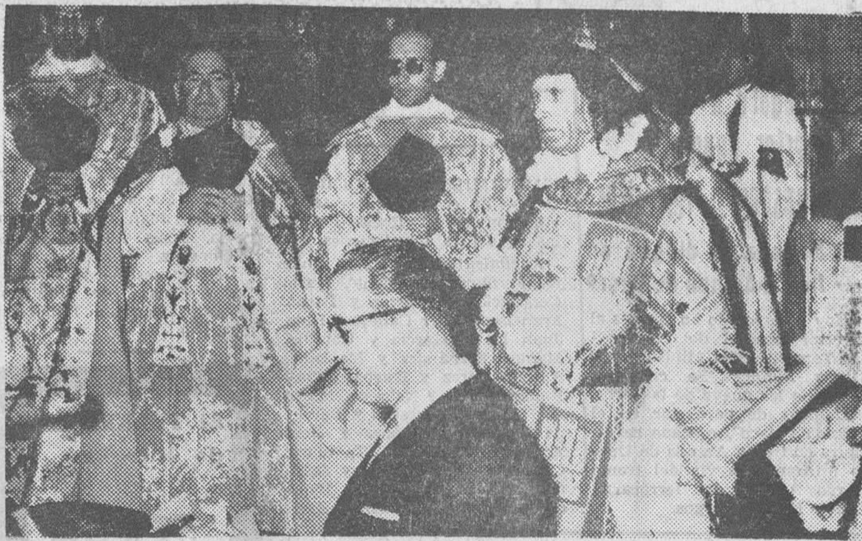
La ciudad, representada por su Ayuntamiento, renovó el domingo la consagración de Burgos al Inmaculado Corazón de María, en solemne acto celebrado en la Catedral. — He aquí un momento de la ceremonia, de que damos cuenta en página quinta.