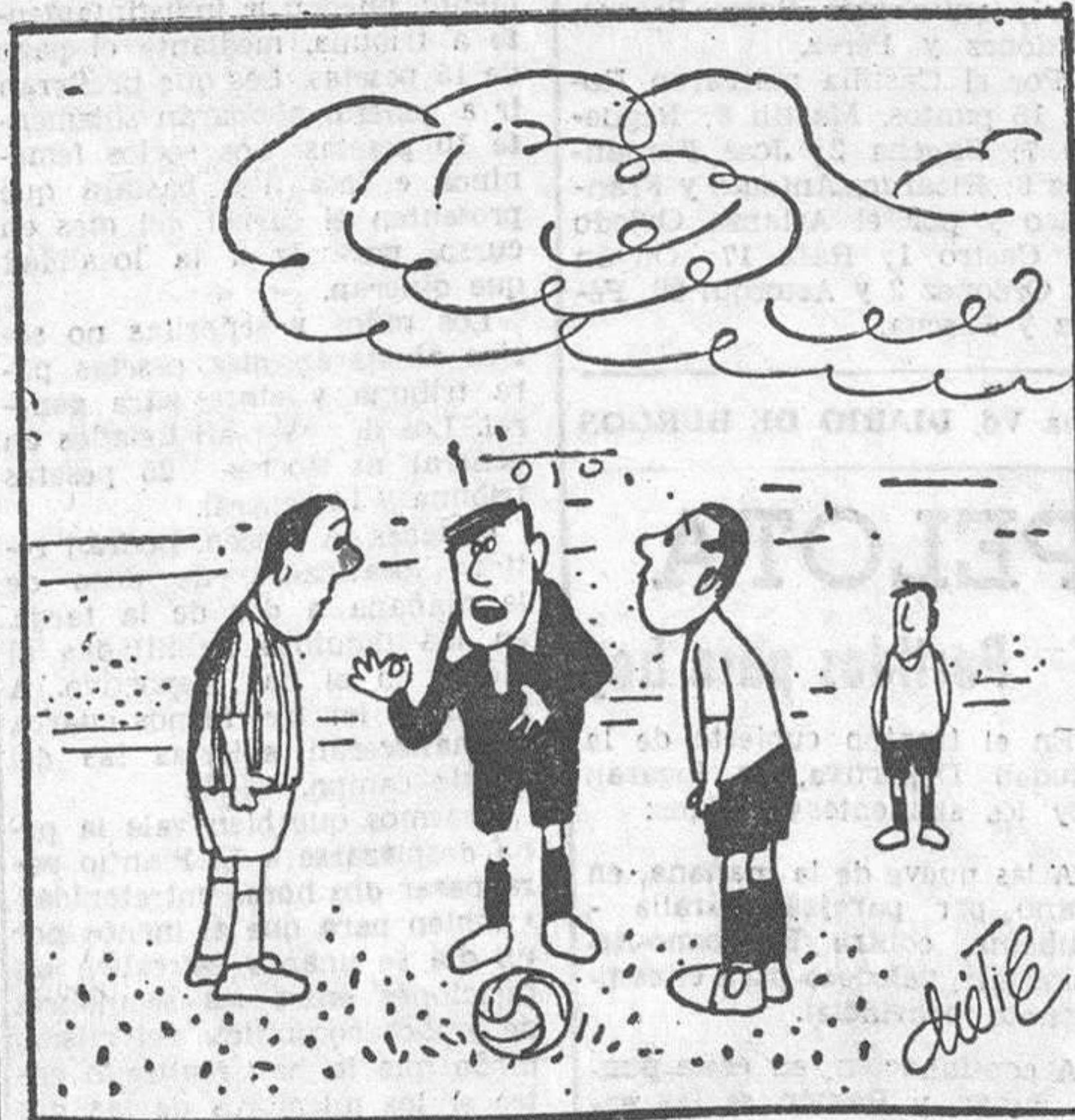
—No comprenden que si reprimieran ese loco aún se harían los otros los unos a los otros, las cosas serían más fáciles para todos.