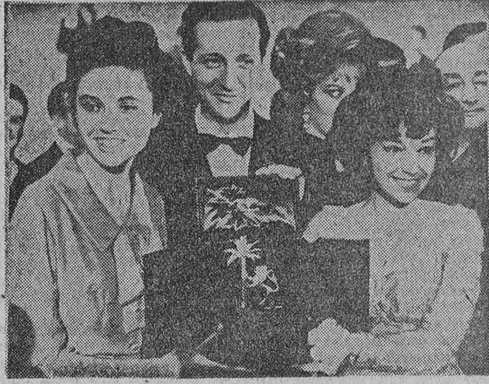
Una muchacha milanesa de 16 años, Gigliola Cinquetti, ha ganado el primer premio del Festival de la Canción de San Remo...