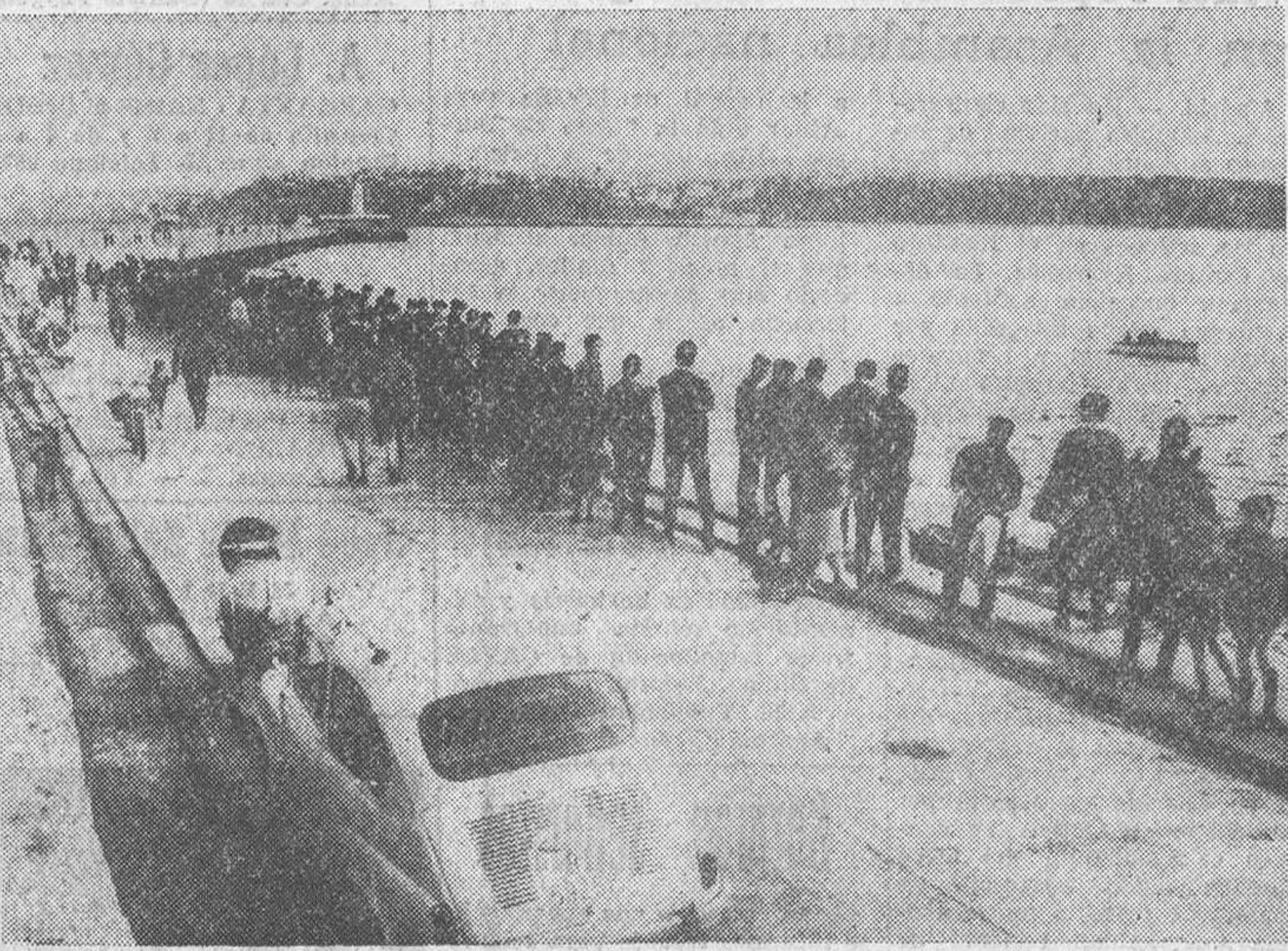
Bilbao.— Cuando un numeroso grupo de personas se hallaban en el rompeolas de Santurce, contemplando el barco "Tejar", embarrancado cerca del faro, treinta de ellas fueron lanzadas al mar por una gigantesca ola. Dos han muerto y el resto, desaparecidas. Varias embarcaciones recorren el lugar del suceso para tratar de rescatar más víctimas. Los trabajos, son presenciados por numerosas personas.