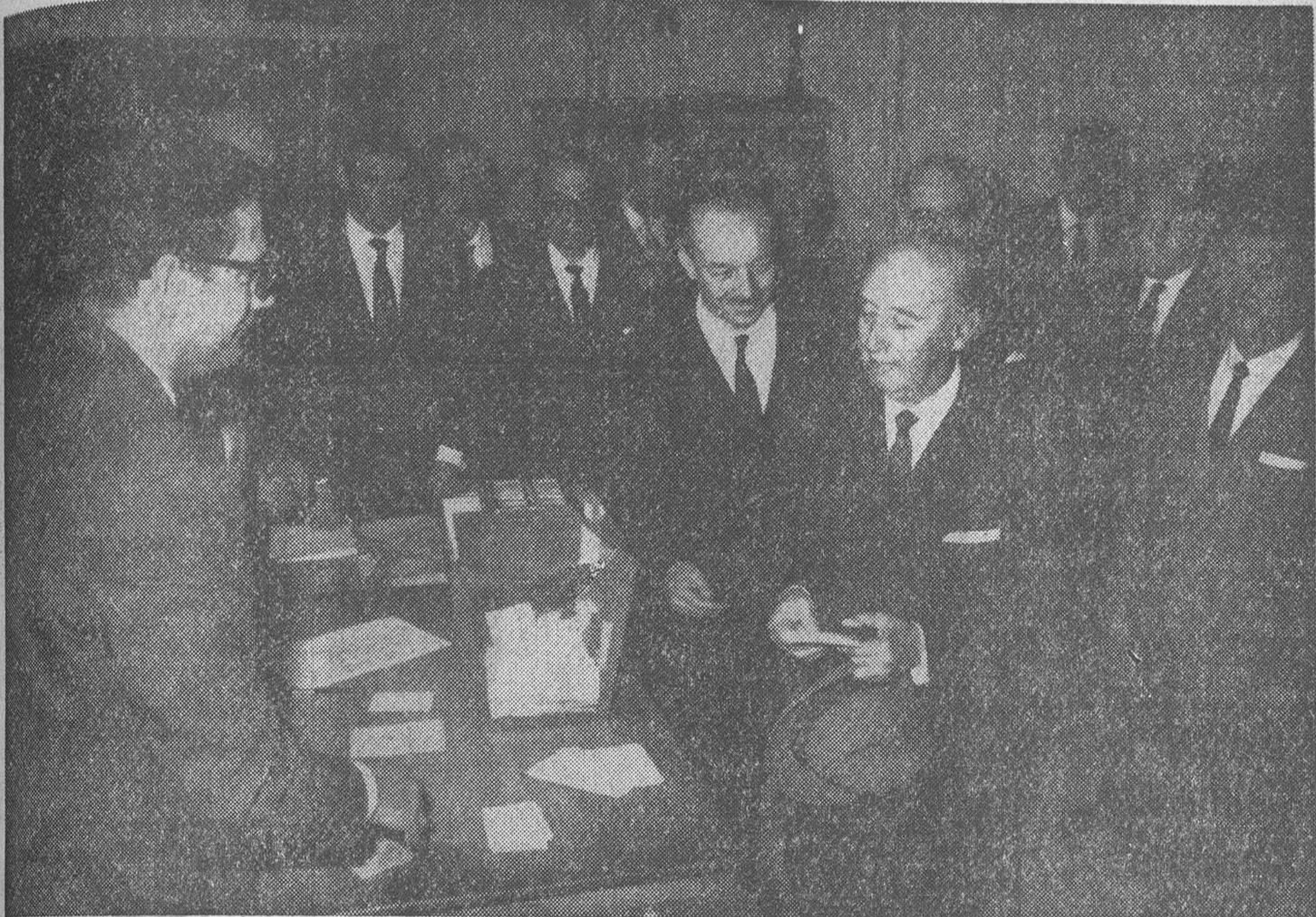
Madrid.—Con motivo de las elecciones municipales celebradas en la capital de España, S. E. el Jefe del Estado depositó su voto en un colegio electoral de El Pardo.

El Jefe del Estado emitió su voto en uno de los Colegios de El Pardo Nueve millones de electores acudieron a los comicios en toda España