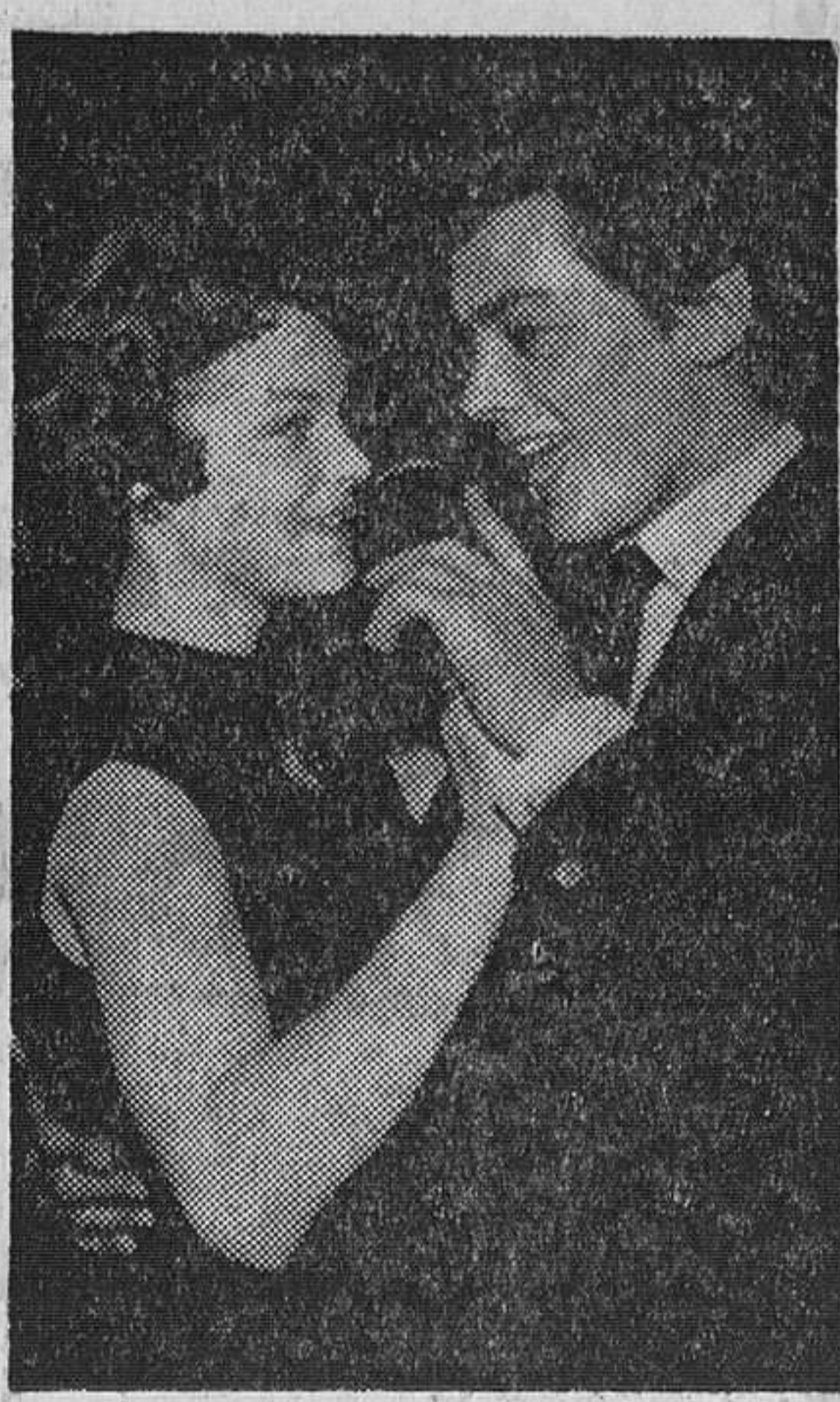
Rommy Schneider bailando con Alain Delón a los pocos días de conocerse en París y de anunciar oficialmente su compromiso.

El hecho de haber dejado Alemania me valió un papel en «Boccaccio