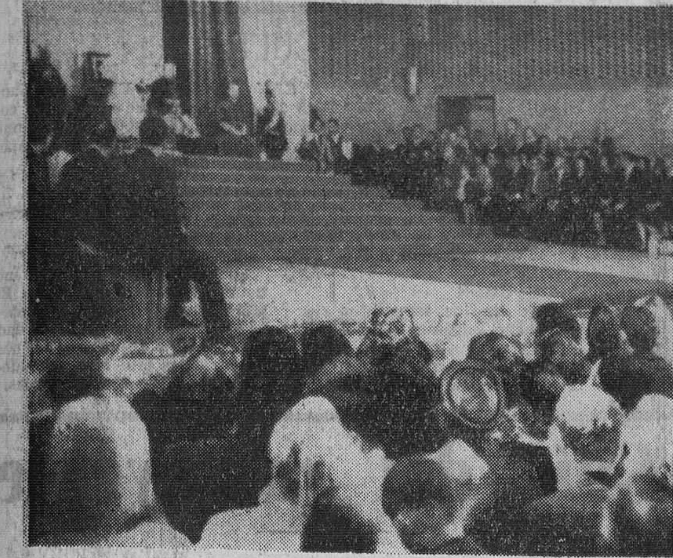
Su Santidad el Papa Paulo VI, se dirige a los obreros peregrinos de la diócesis de Barcelona a quienes recibió en audiencia.