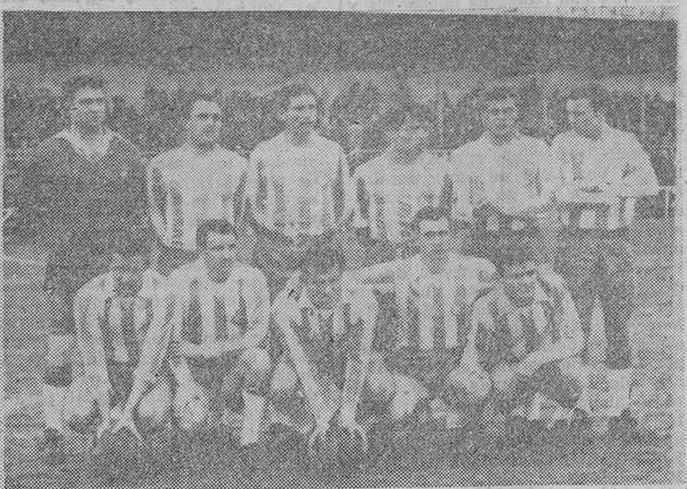
El Español de Barcelona, "leader" de nuestro grupo y que el domingo fue completamente dominado por el Burgos, aun cuando se llevara un punto de Zatorre.

Lleno absoluto en Zatorre para presenciar el encuentro Burgos-Español, del que nos habíamos ocupado ampliamente durante toda la semana.