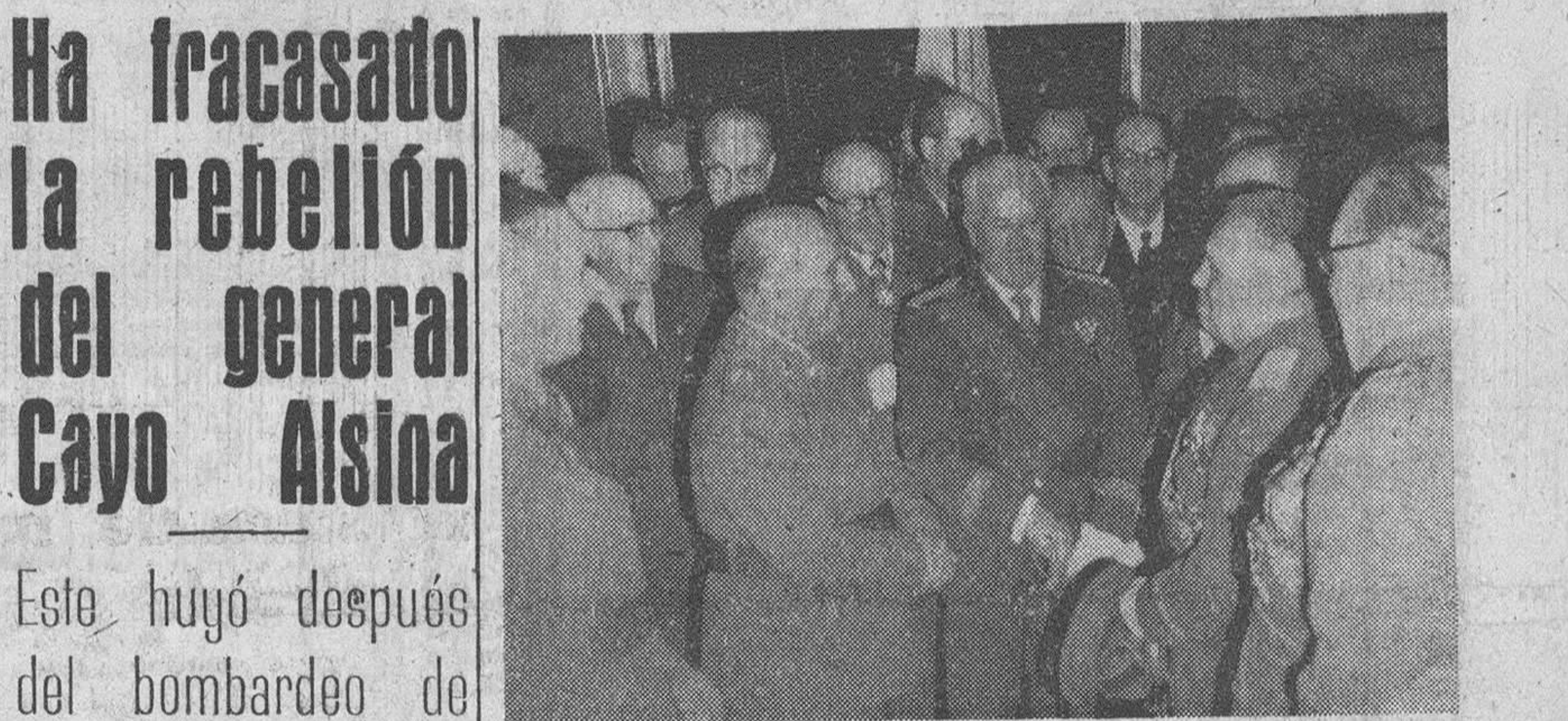
LOGOS J.B. AUDIENCIA GENERAL DE SU SANTIDAD EL PAPA A 1.200 PEREGRINOS

París. — Los trabajos de la Conferencia general de la UNESCO, han sido clausurados hoy por el presidente de la misma, profesor Paul de Barredo Carneiro. — Efe.