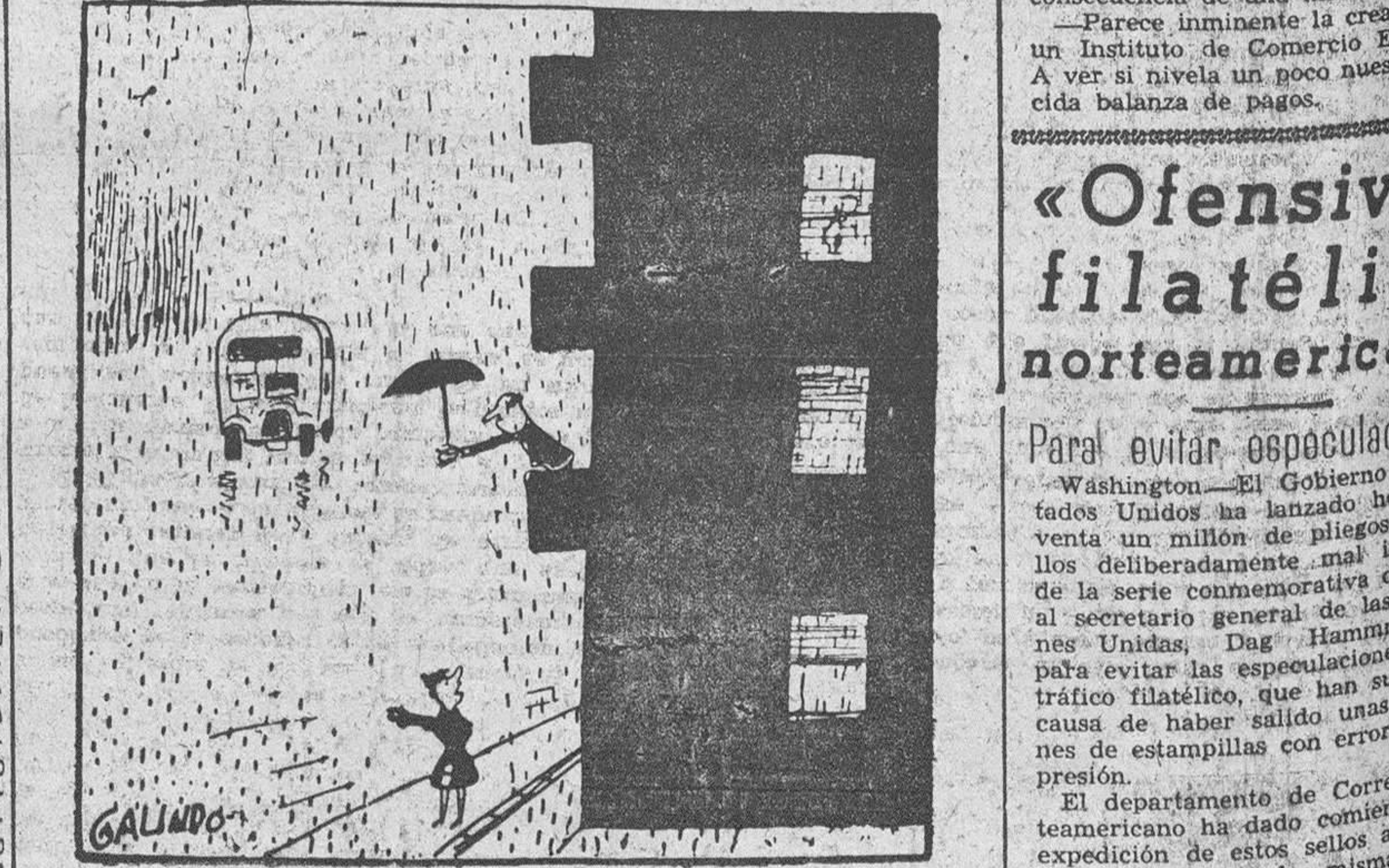
—Puedes cerrar el paraguas. Ya viene el autobús.