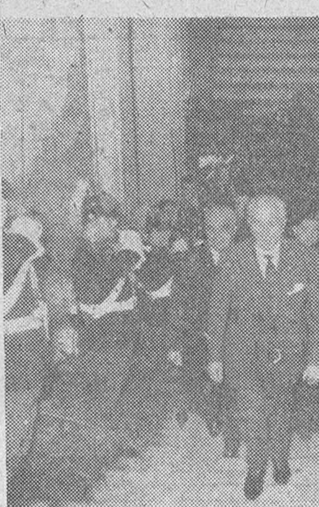
EL MINISTRO DE LA GOBERNACION EN PORTUGAL

Los padres que apoyan el esquema, admitiendo por otra parte la necesidad de modificarlo en algunas de sus partes y pidiendo para ello una amplia discusión en el aula, aducen estas razones: el fundamento de la acción pastoral está en una exposición bien clara de la doctrina y no hay ofensa ninguna para los hermanos separados en el hecho de que se intente exponer con toda claridad la verdad que también ellos buscan; fin primario del Concilio es explicar y custodiar íntegra la Doctrina Católica; el esquema tal como ha sido presentado es fruto de intensos estudios y trabajos realizados por obispos y especialistas y ha sido luego aprobado por la Comisión central preparatoria del Concilio, de la cual formaban parte muchos Cardenales; los Seminarios y centros de formación eclesial esperaban del Concilio una orientación clara y concreta sobre problemas doctrinales y exegeticos, de los que hoy se habla en libros y revistas, a veces, sin demasiada claridad de ideas y sin un profundo estudio de los diversos problemas.