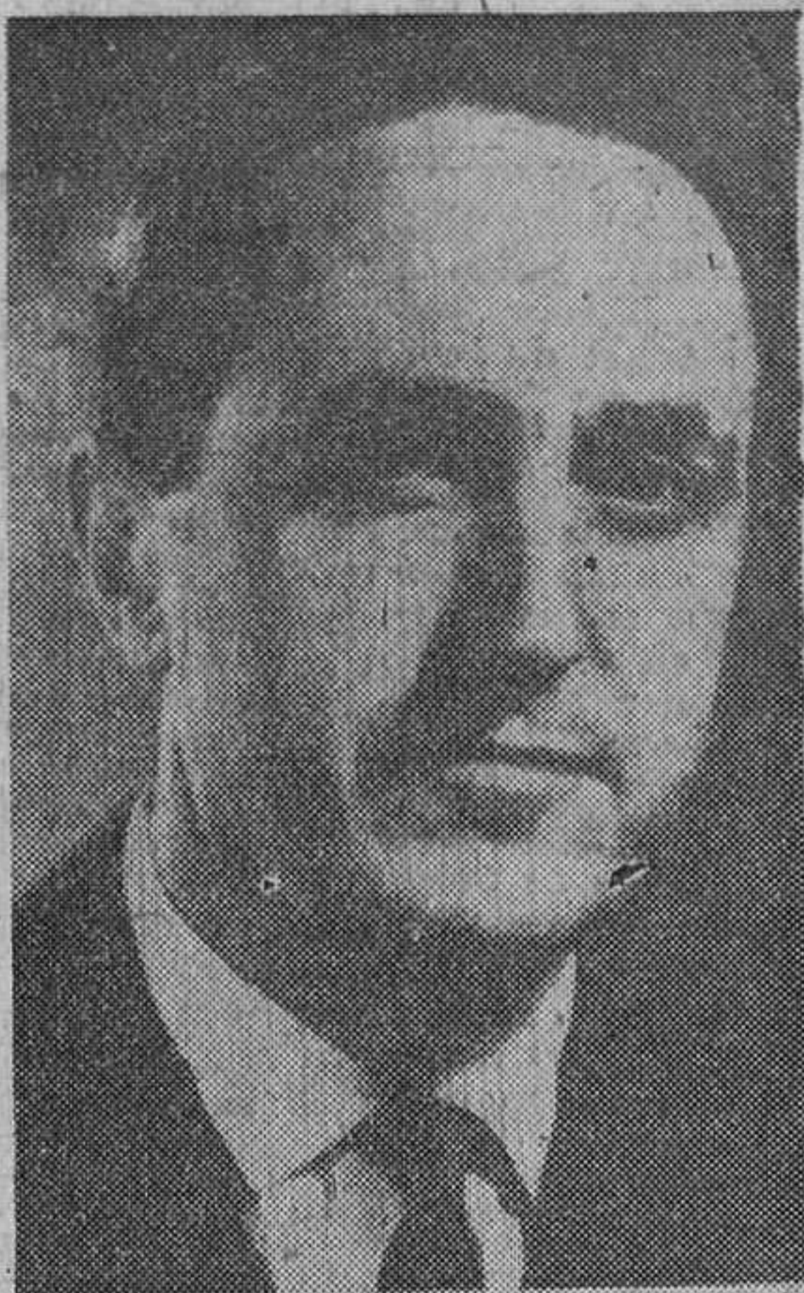
El teniente general don José Lacalle Larraga y don Gregorio López Bravo, nombrados por el Caudillo ministros del Aire y de Industria, respectivamente.