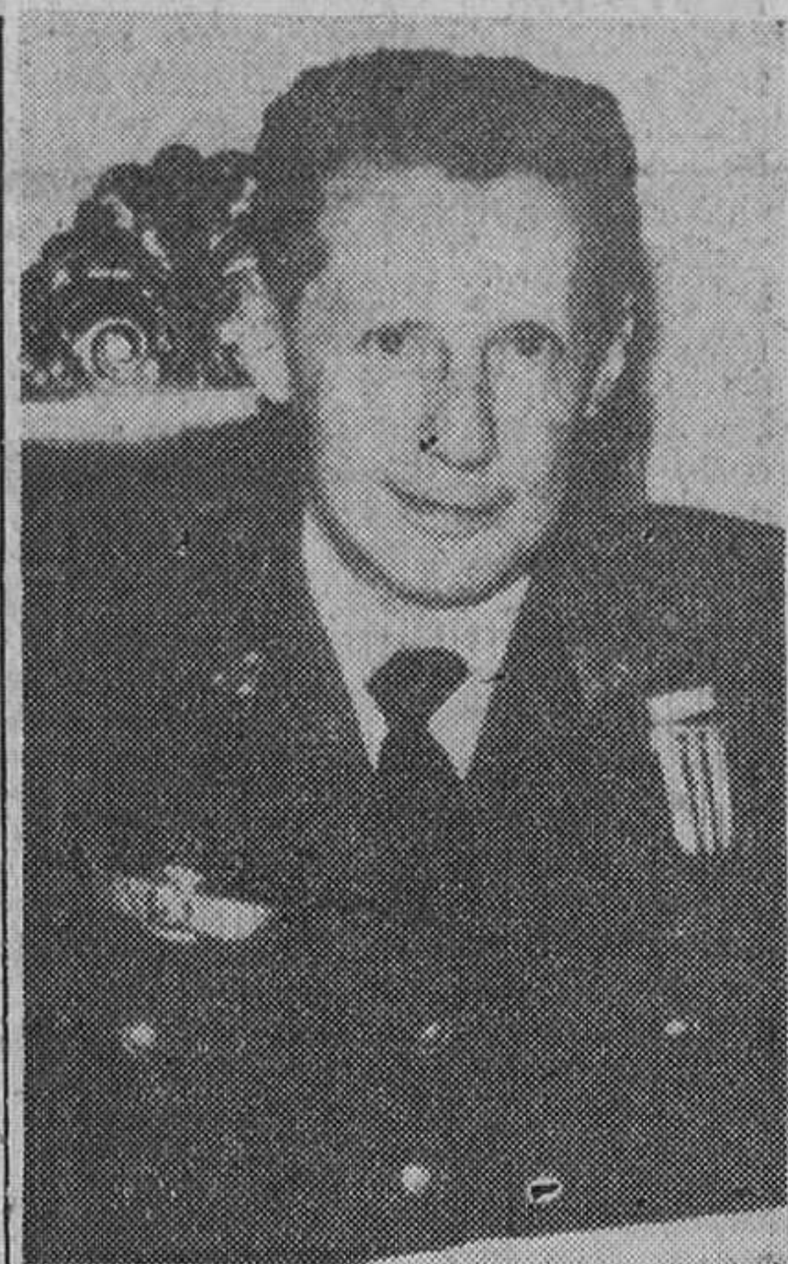
El teniente general don José Lacalle Larraga y don Gregorio López Bravo, nombrados por el Caudillo ministros del Aire y de Industria, respectivamente.

Madrid. — Esta mañana se ha efectuado en el palacio Velázquez de exposiciones del Retiro, el acto de entrega de las medallas otorgadas en la Exposición Nacional de Bellas Artes del presente año. Presidió el director general de Bellas Artes.