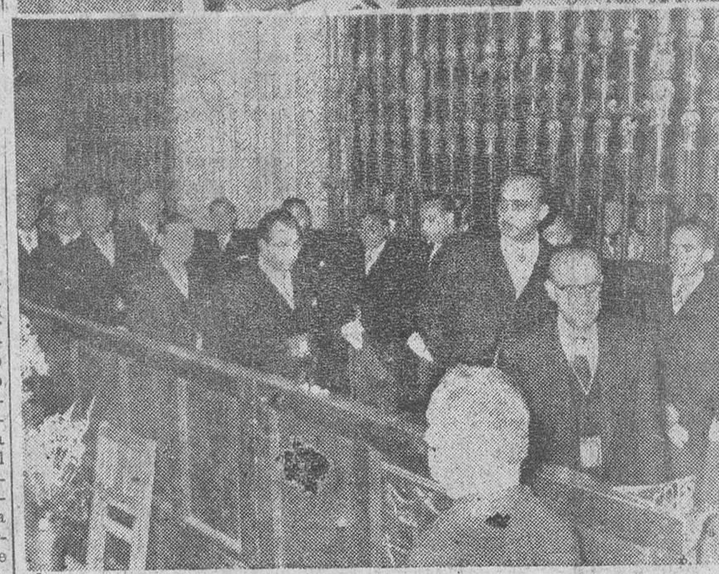
Con motivo de la festividad del Inmaculado Corazón de María y como final del octavario dedicado en nuestra Catedral a Santa María la Mayor, se celebró ayer tarde la renovación del voto de consagración de Burgos a Su Excelsa Patrona, a presencia del Excmo. Sr. arzobispo, que ofició de pontifical en los solemnes cultos. En nuestro grabado: el alcalde de la ciudad, dando lectura a la piadosa invocación y, en plano inferior, el Pleno de la Corporación municipal, ocupando el "celemín" durante la ceremonia.