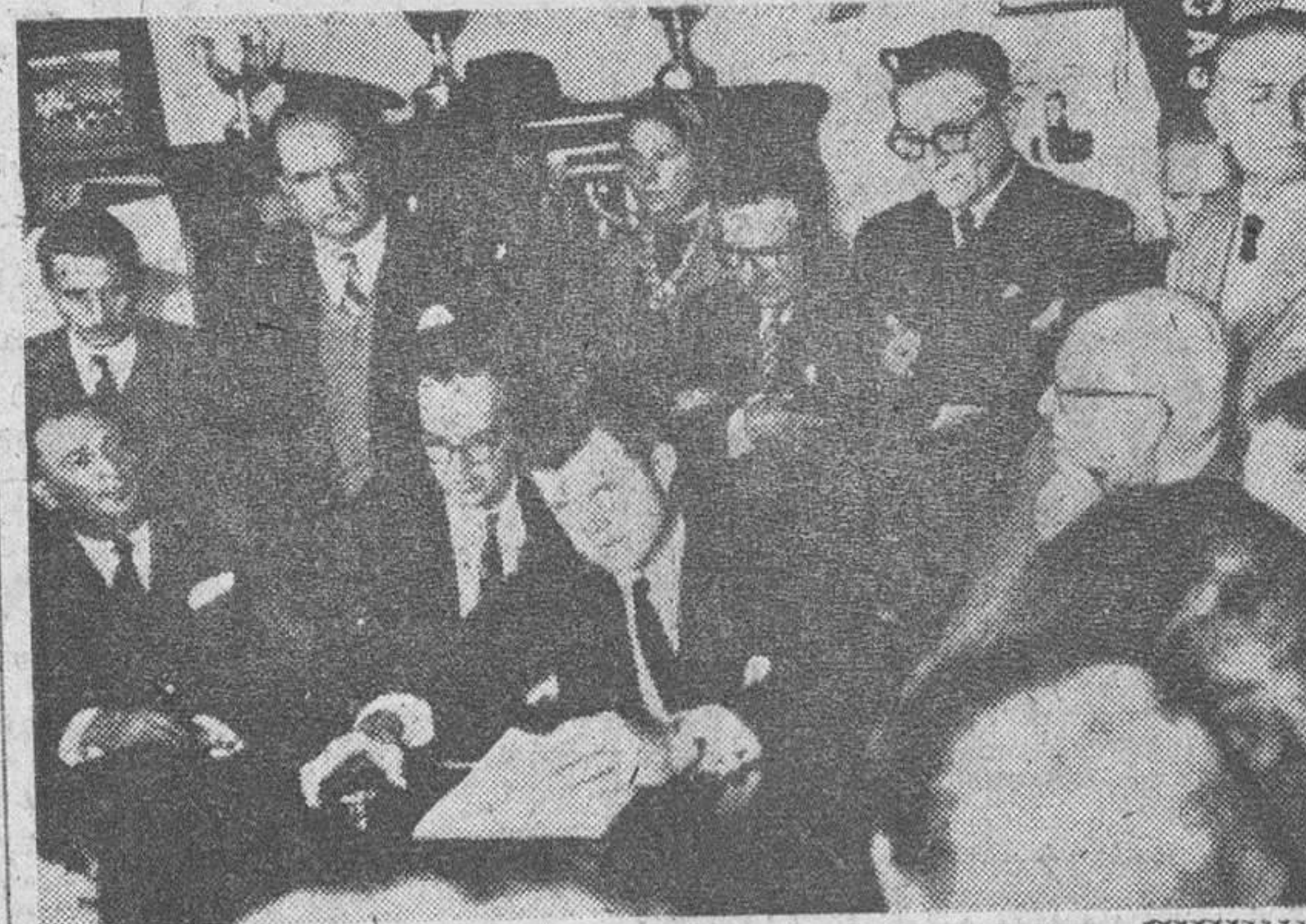
Buenos Aires.— Durante su gira por Hispanoamérica, el hermano menor del presidente Kennedy se entrevistó en la Argentina con dirigentes sindicales del país, los que le expusieron el punto de vista laboral argentino en relación con la política norteamericana. En la foto: Edward Kennedy con los dirigentes, en la cordial reunión.