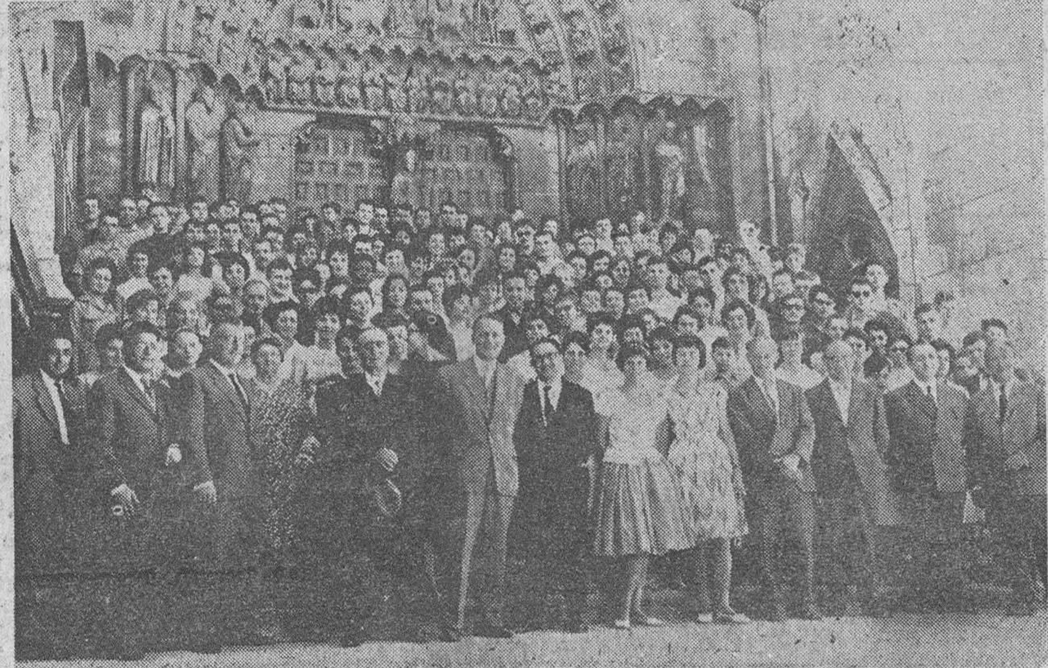
En el programa de visitas previstas por los Cursos de Verano para Extranjeros figura, naturalmente, en primer término la de la Catedral, cuya riqueza artística y monumental ha sido admirada por todos los alumnos durante su recorrido por el S. T. M. — A la salida del templo catedralicio, «Fede» ha obtenido la precedente plaza.