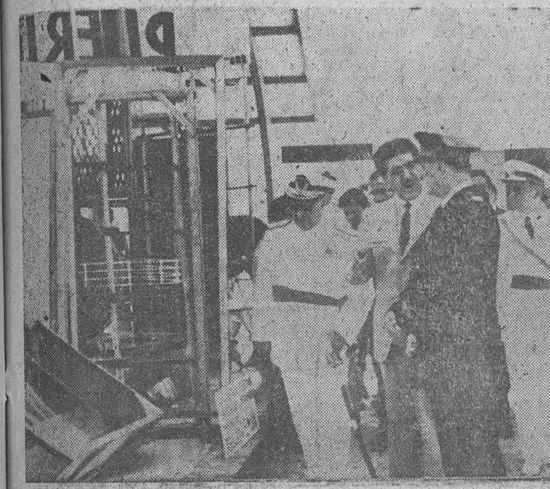
El Ferrol del Caudillo. — El ministro de Información y Turismo, Sr. Arias Salgado, recorre las instalaciones de la Feria del Mar en la ceremonia inaugural, acompañado de las autoridades.