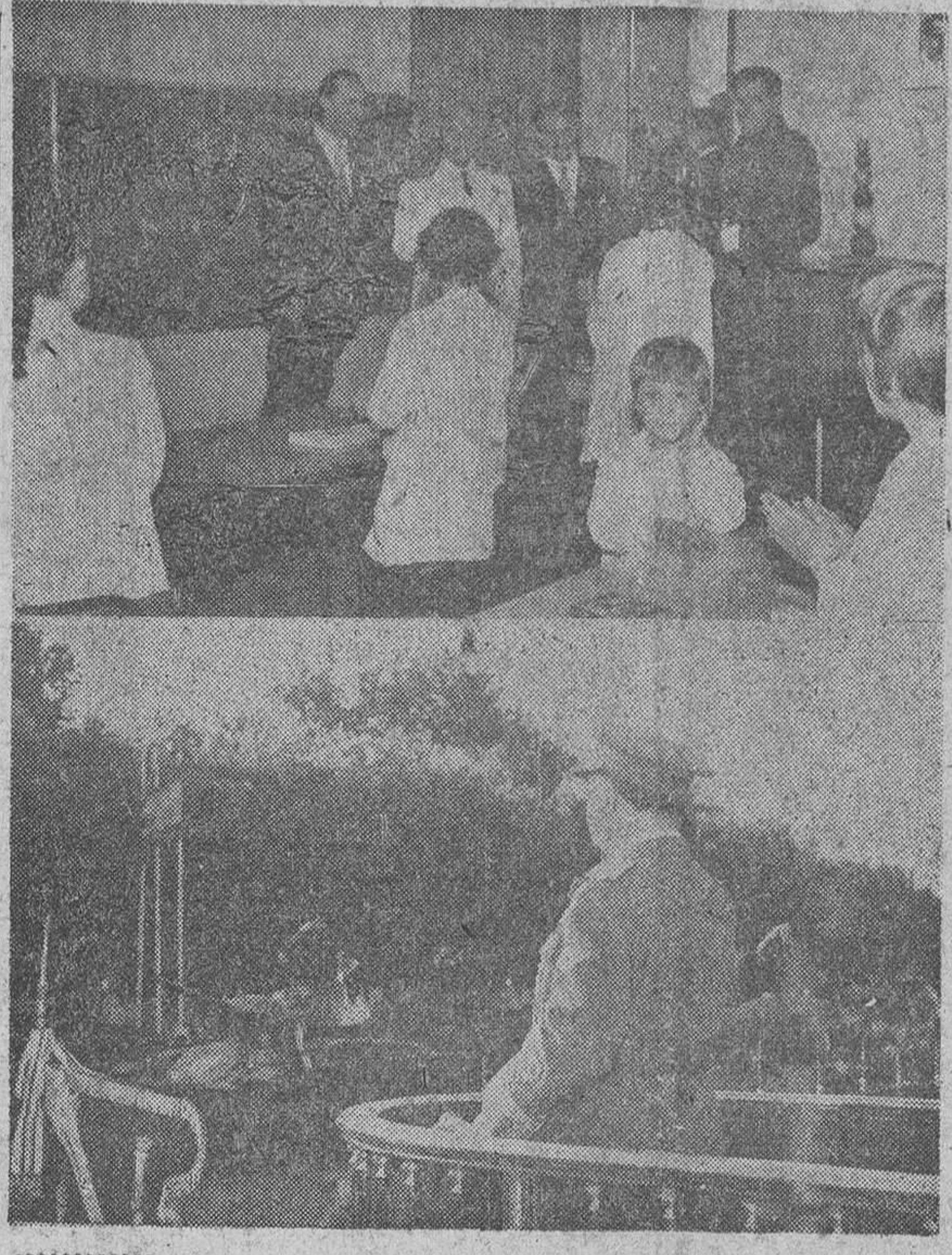
He aquí dos placas expresivas de los brillantes actos presididos por el Caudillo, el lunes último, como iniciación de la conmemoración del 18 de Julio. — En primer término, un momento de la inauguración del Instituto Municipal de Educación, en Madrid. — En segundo plano, S. E. el jefe del Estado presidente, desde el arriero instalado al efecto en La Castellana, el brillante desfile militar conmemorativo del XXV aniversario del glorioso Movimiento nacional.