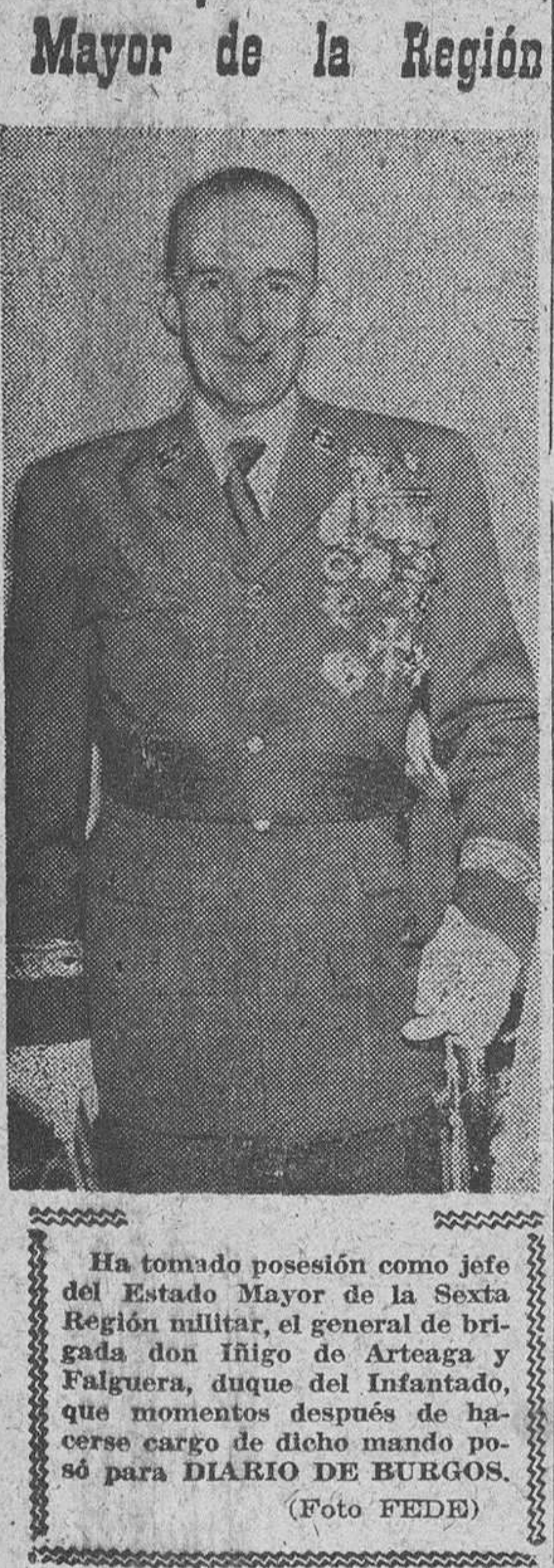
Ha tomado posesión como jefe del Estado Mayor de la Sexta Región militar, el general de brigada don Filipo de Artega y Falguera, duque del Infantado, que momentos después de hacerse cargo de dicho mando pasó para DIARIO DE BURGOS.