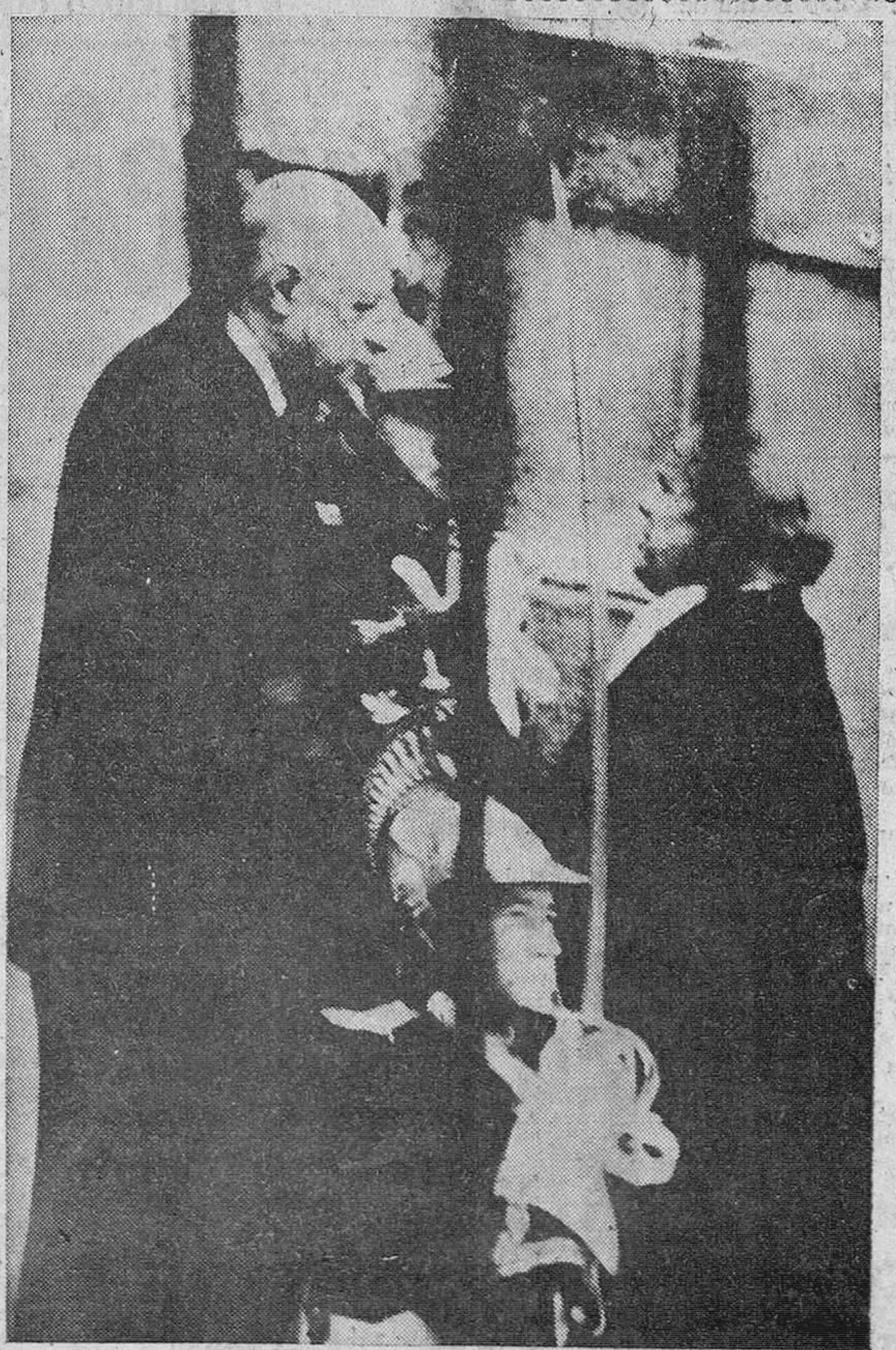
Entrevista De Gaulle-Burguiba

Rambouillet (Francia).— A la entrada del castillo estrecha la mano al presidente de Túniz, Habib Burguiba. La foto está obtenida con teleobjetivo a través de la verja que cierra dicha posesión.—(Telefoto Cifra)