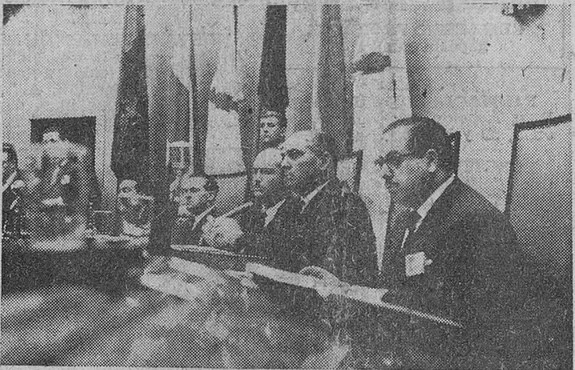
EL I CONGRESO SINDICAL. Madrid.— El ministro secretario general del Movimiento, señor Solís, acompañado de las altas jerarquías sindicales, durante el acto inaugural del I Congreso Sindical.

Primeros contactos personales de Castiella con Hassan II