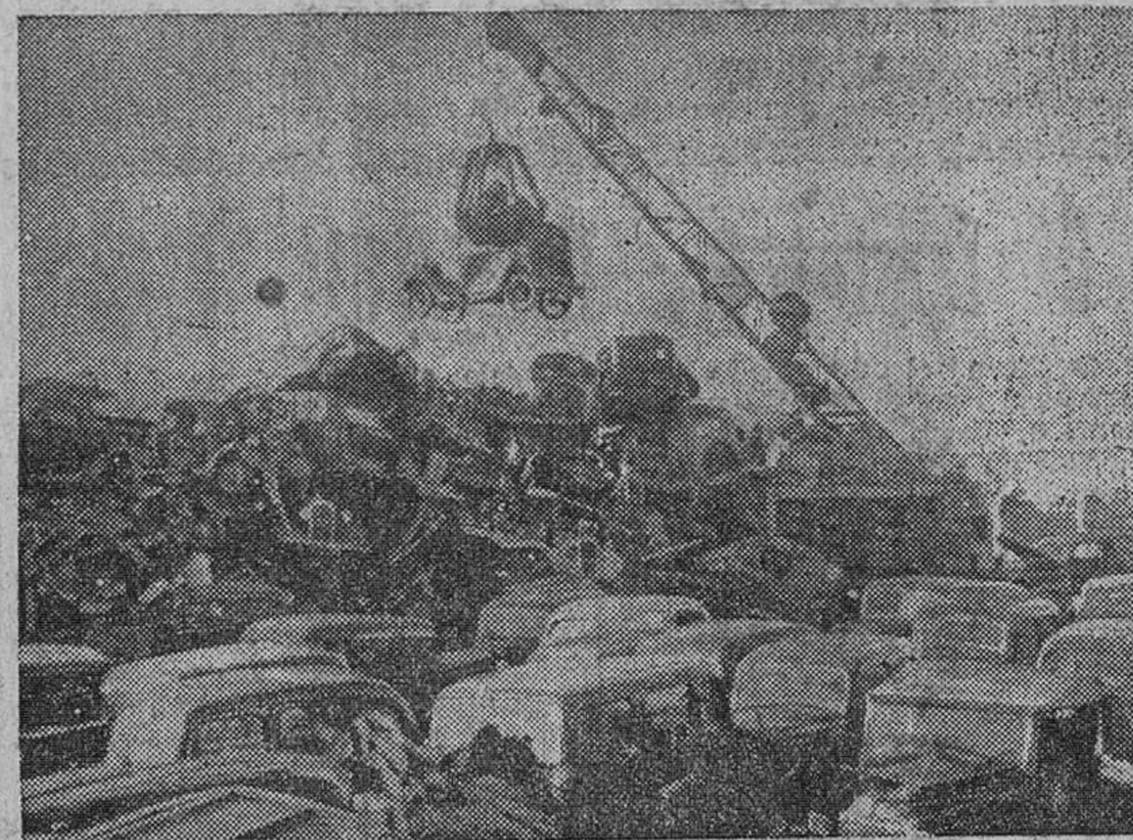
No hay sitio para los coches viejos en Inglaterra

Londres. — En las afueras de Londres y en otros muchos lugares de Gran Bretaña, miles de coches se apilan convirtiéndose en chatarra. El problema preocupa a las autoridades, pues la Asociación de Desmanteladores de Vehículos de Motor no se da abasto y la inundación de chatarra se extiende cada vez más por las verdes campiñas de Inglaterra.