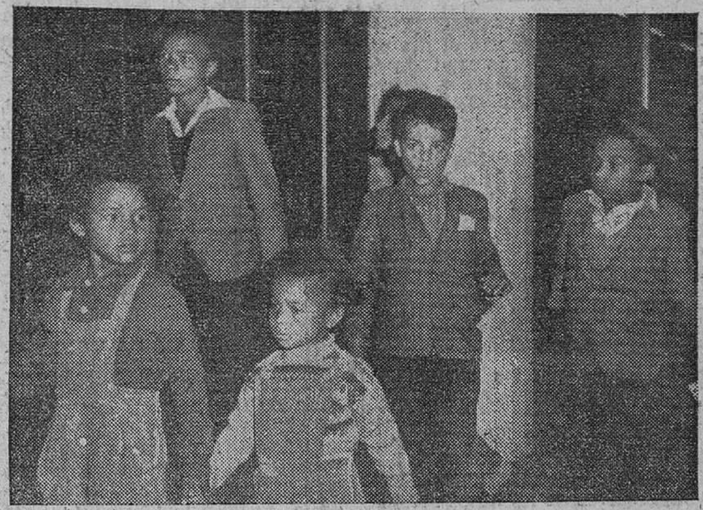
REFUGIADOS DEL CONGO

Atacó duramente al secretario general de las Naciones Unidas, anunciando que Rusia se opondrá a cualquier propuesta que se haga a favor de él y a los "colonizadores blancos" a los que hizo (Pasa a tercera pag.)