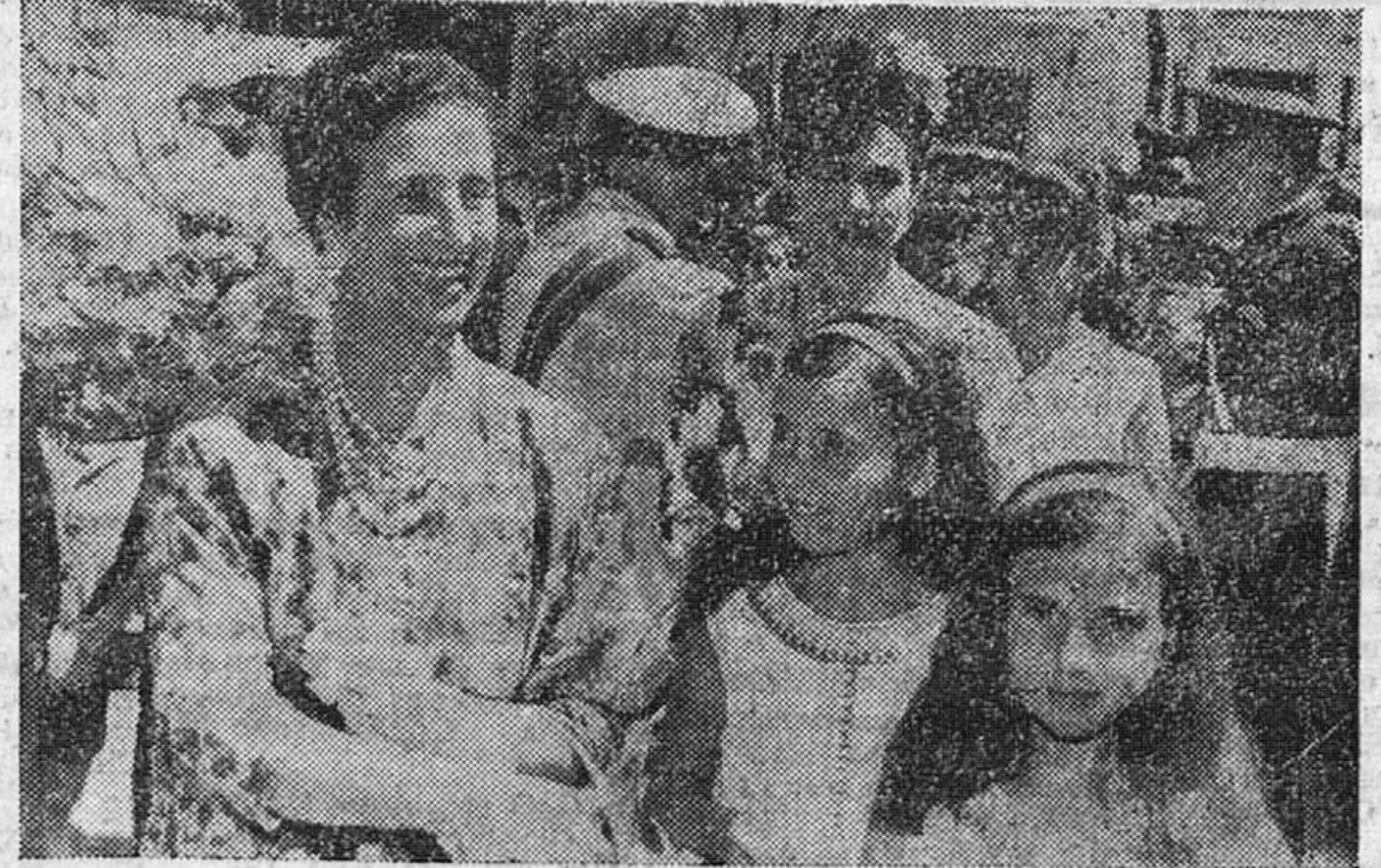
Nota especialmente emotiva de la estancia de SS. EE. en nuestra ciudad fue la presencia de doña Carmen Polo de Franco, acompañada de sus dos nietas mayores. En nuestro grabado, la egregia dama, con la cual llegó la esposa de nuestra primera autoridad civil, señora de Fernández-Victorio.—(F. FEDE)

considerable desde hace algún tiempo. FIRGSE ha recibido orden de la Comisaría general de abastecer todos los mercados del Norte de España de carne de todos los tipos: fresca, refrigerada y congelada. La carne de cebón y novillo se venderá en Lugo a los siguientes precios: solomillo, 65 pesetas kilo; primera, 52; segunda, 37 y tercera, 22.