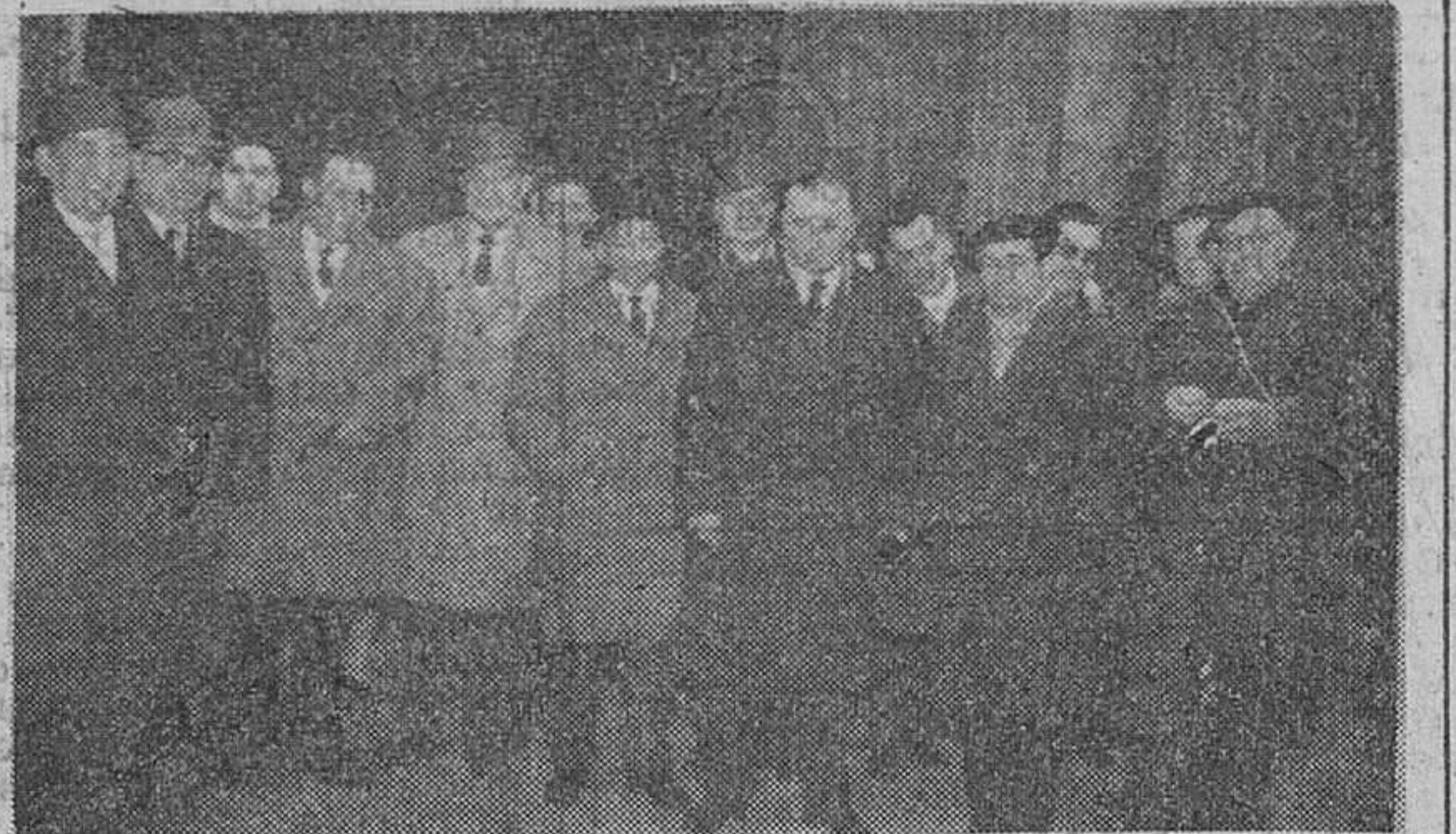
Los actos conmemorativos del XVII aniversario de la fundación de la "Peña Cidiana", culminaron el pasado domingo.