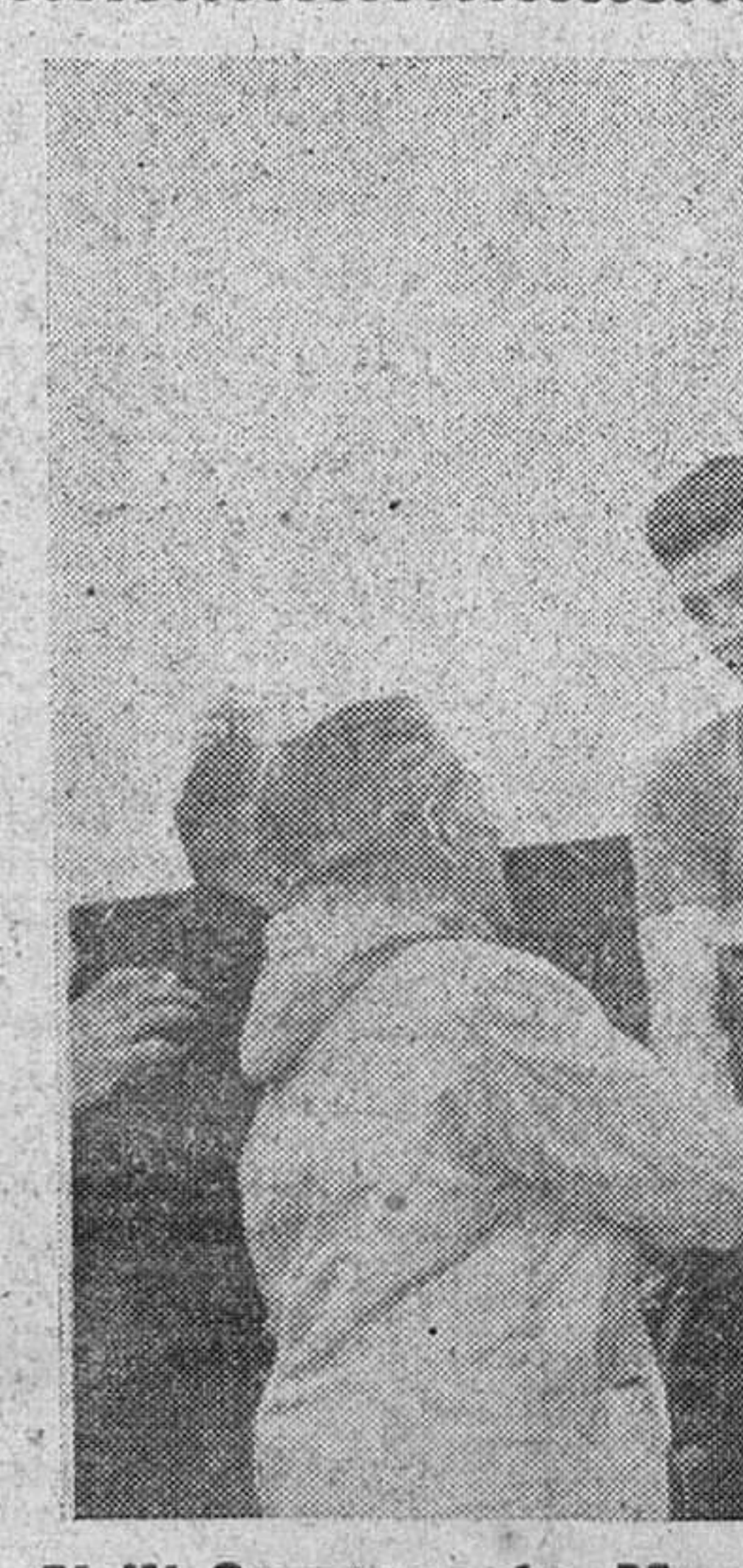
El XI Campeonato Mundial de ciclo-cross, en Tolosa Tras proclamarse absoluto vencedor del XI Campeonato Mundial de ciclo-cross, que se disputó el pasado domingo en Tolosa, el alemán Wolfshohl corresponde a las aclamaciones del público, desde el podio del estadio de Berazubi. A sus lados figuran: el suizo Uhnggenbühl (a la derecha del grabado) y el francés Aubry (a la izquierda). — (Foto Argüés)

TERMINA EL XI CAMPEONATO MUNDIAL DE CICLO-CROSS, EN TOLOSA Tras proclamarse absoluto vencedor del XI Campeonato Mundial de ciclo-cross, que se disputó el pasado domingo en Tolosa, el alemán Wolfshohl corresponde a las aclamaciones del público, desde el podio del estadio de Berazubi. A sus lados figuran: el suizo Uhnggenbühl (a la derecha del grabado) y el francés Aubry (a la izquierda). — (Foto Argüés)