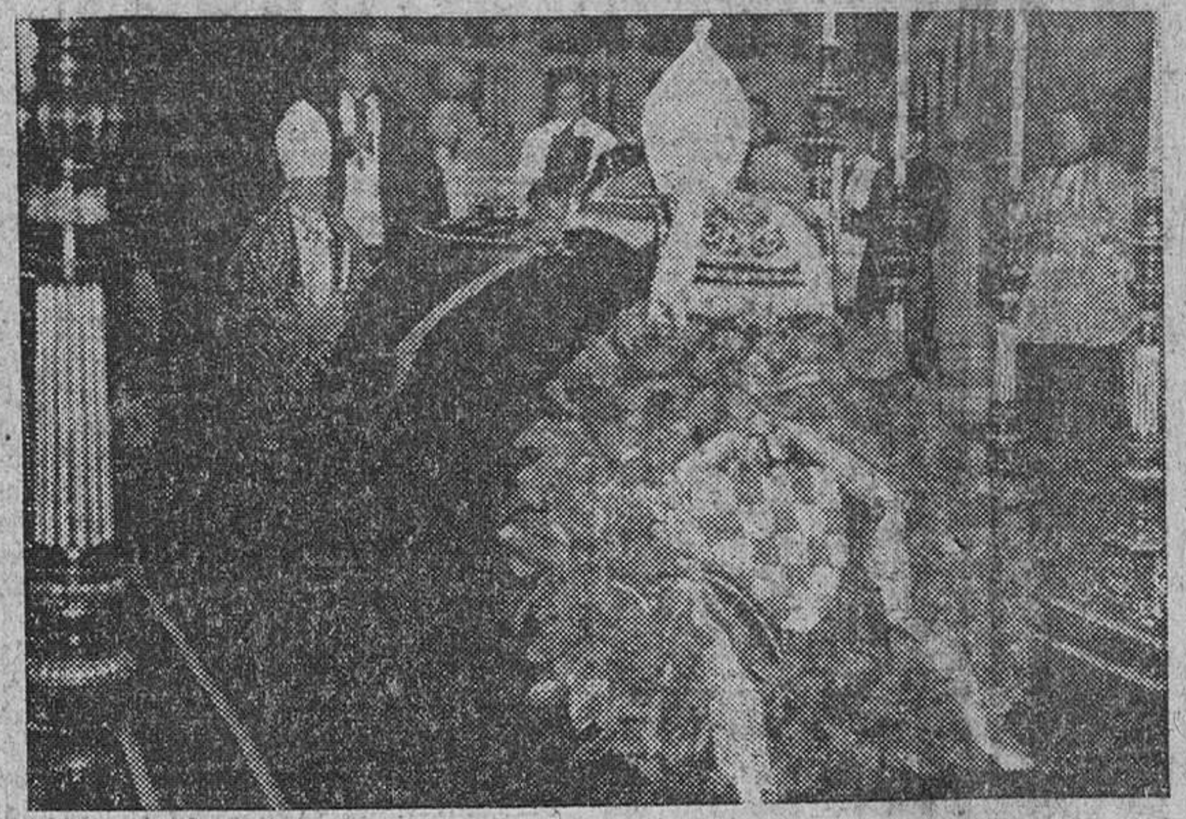
Funerales por el alma del Cardenal Stepinac Cardenal Stepinac. En la fotografía aparece durante el responso ante el túmulo.