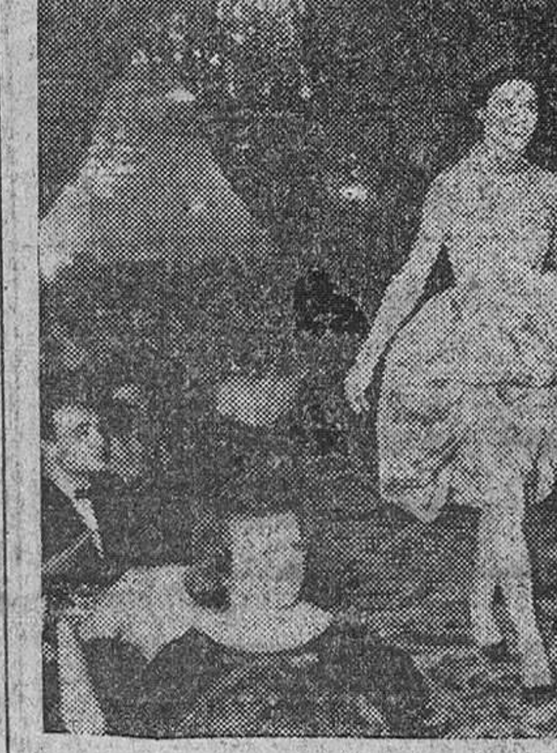
I Certamen de la moda masculina en Barcelona Barcelona. — El Consejo Español de Sastres ha celebrado el I Certamen de la Moda Masculina, en cuyos modelos ha lanzado la "línea diávolo", en la que la americana se entalla un poco. En la foto, un modelo de "chaquet". También participaron maniqués femeninos que presentaron las últimas novedades de la alta costura española.