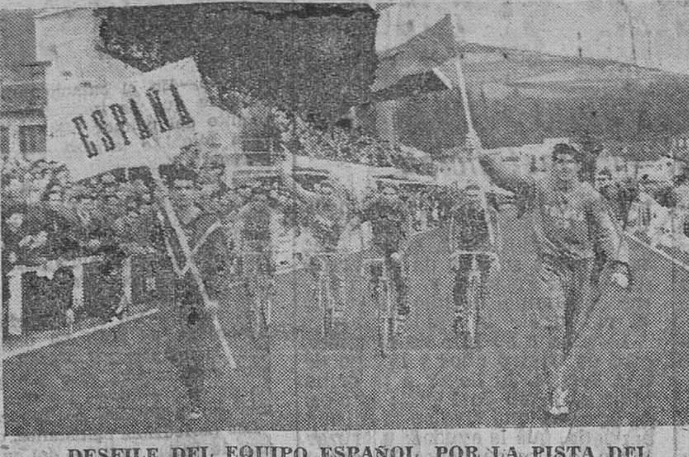
DESFILE DEL EQUIPO ESPAÑOL, POR LA PISTA DEL ESTADIO DE BERAZUZI.