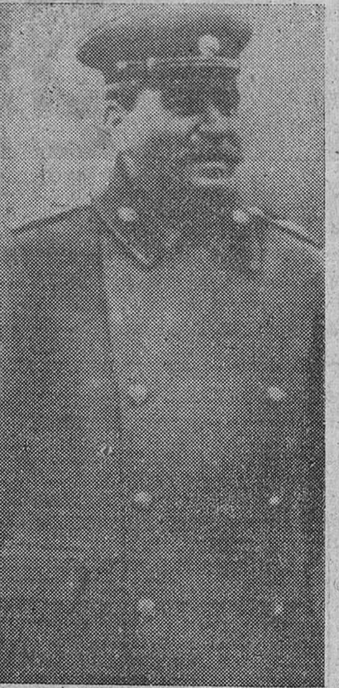
Stalin, a quien el ataque alemán en 1941 le cogió por sorpresa, se dirigió a Churchill y Roosevelt solicitando ayuda.

militares soviéticos en Berlín. Vorontsov y Jlopov, informados por sus espías, advertían a Stalin.