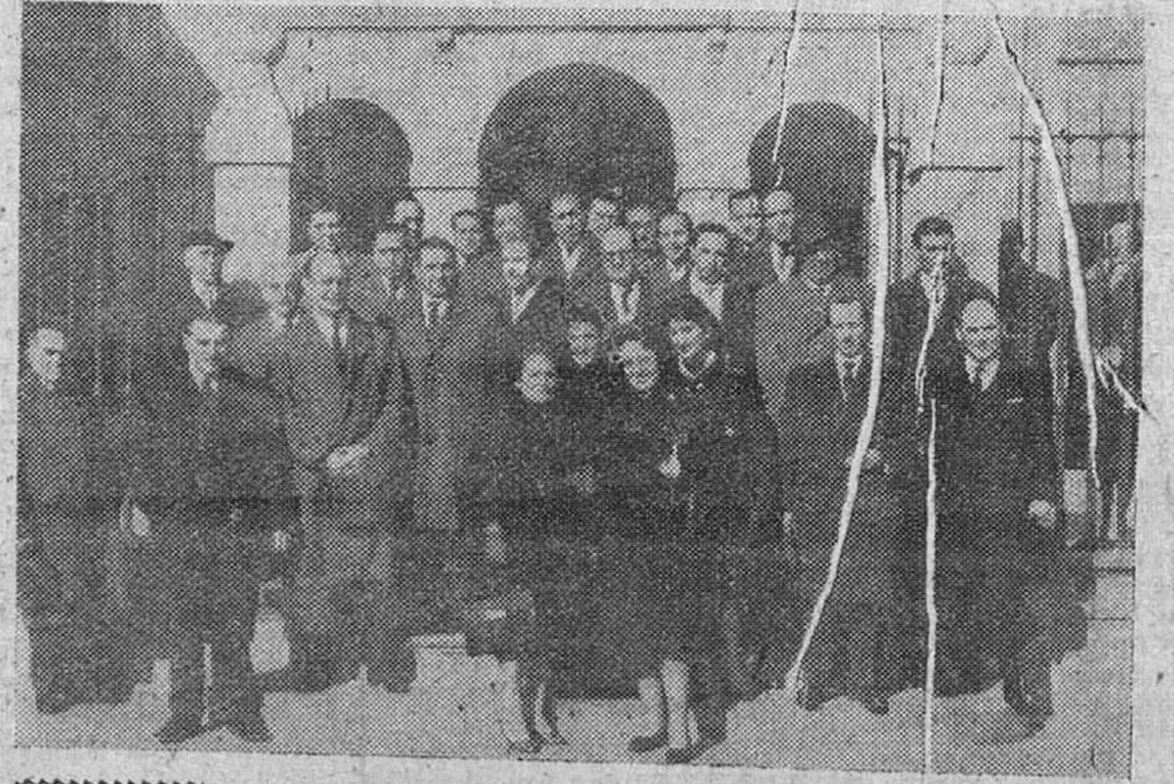
Madrid.—He aquí un grupo de burgaleses, a la salida de la misa organizada por la «Mesa de Burgos», en conmemoración de la festividad de San Lesmes.