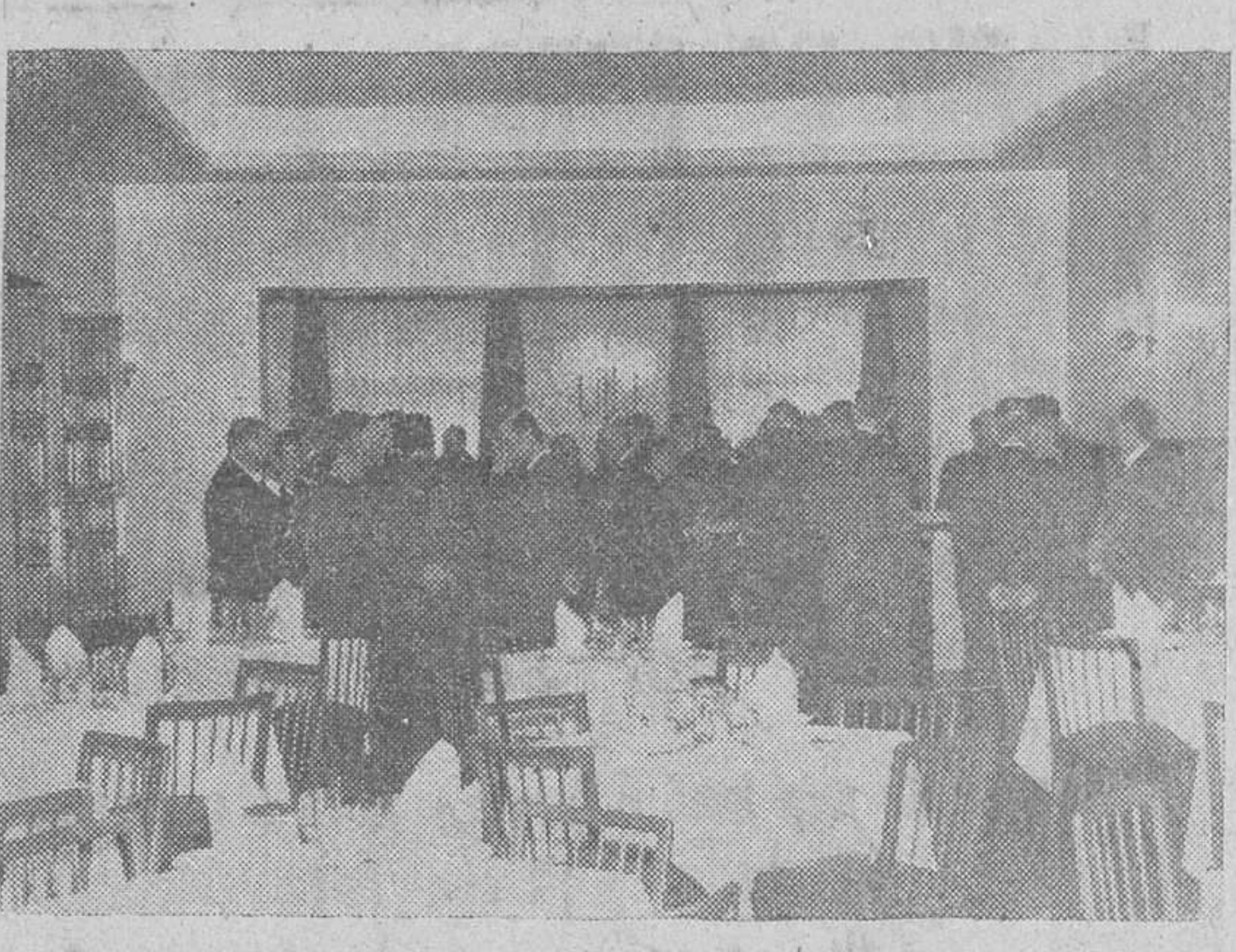
Inauguración del "Hogar del Aviador" Madrid.— Un aspecto del comedor del Hogar del Aviador durante el acto de inauguración de dicho Hogar, con asistencia del ministro del Aire y otras personalidades.