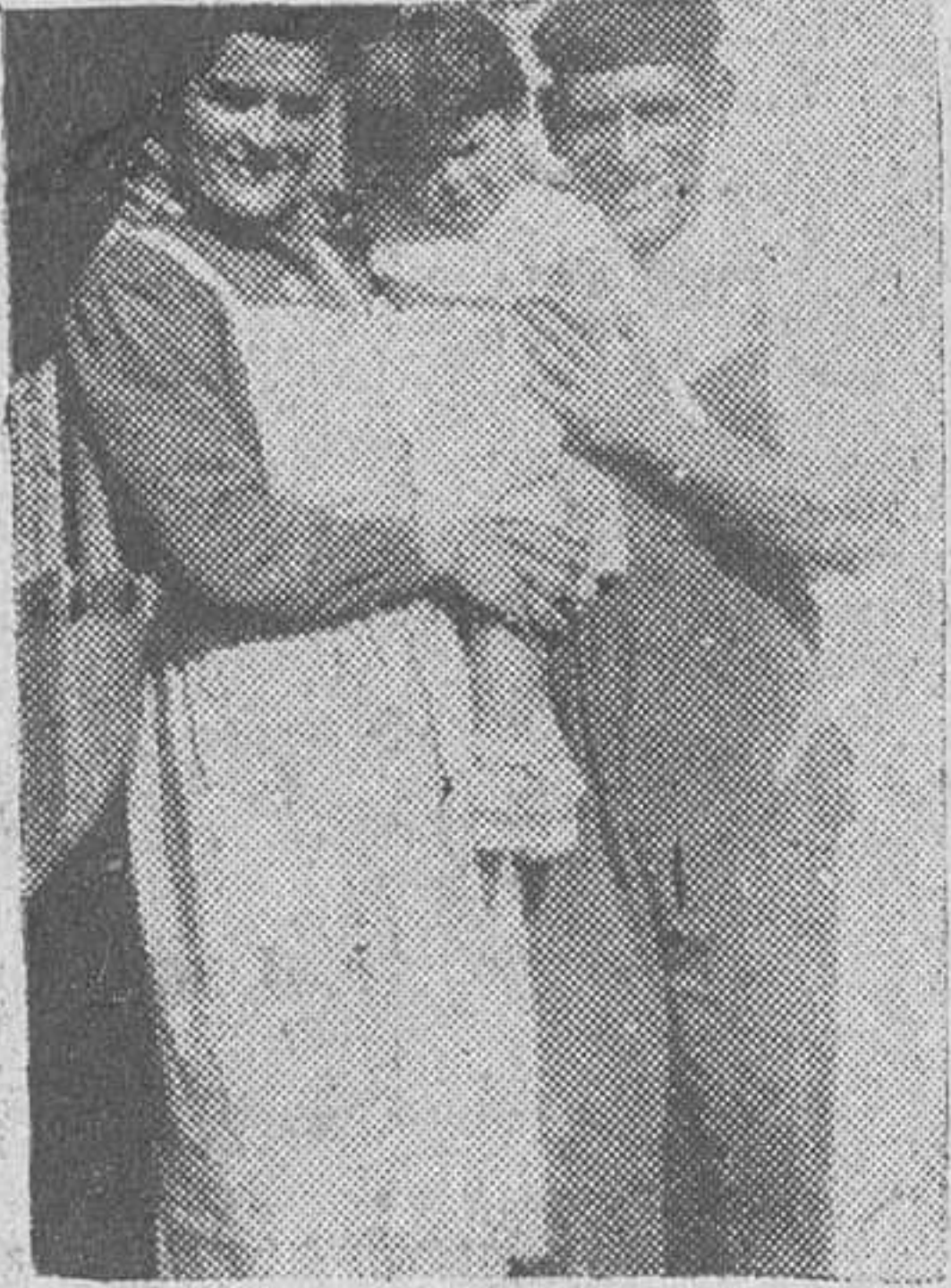
Una placa familiar obtenida no hace mucho y en la que aparece el entonces feliz matrimonio, con su hijita.

El temple de una madre fuerte.- Aceptó conmovida los socorros.- "El día en que lo mataron sólo teníamos 60 duros".- ¡Hacen falta colchones, mantas, sábanas, vestidos y calzado!.- Generoso rasgo de los médicos de la Asociación de la Prensa.- Espontánea iniciativa de una viuda con tres hijos.- Ante un grave deber.- Llamamiento a los labradores