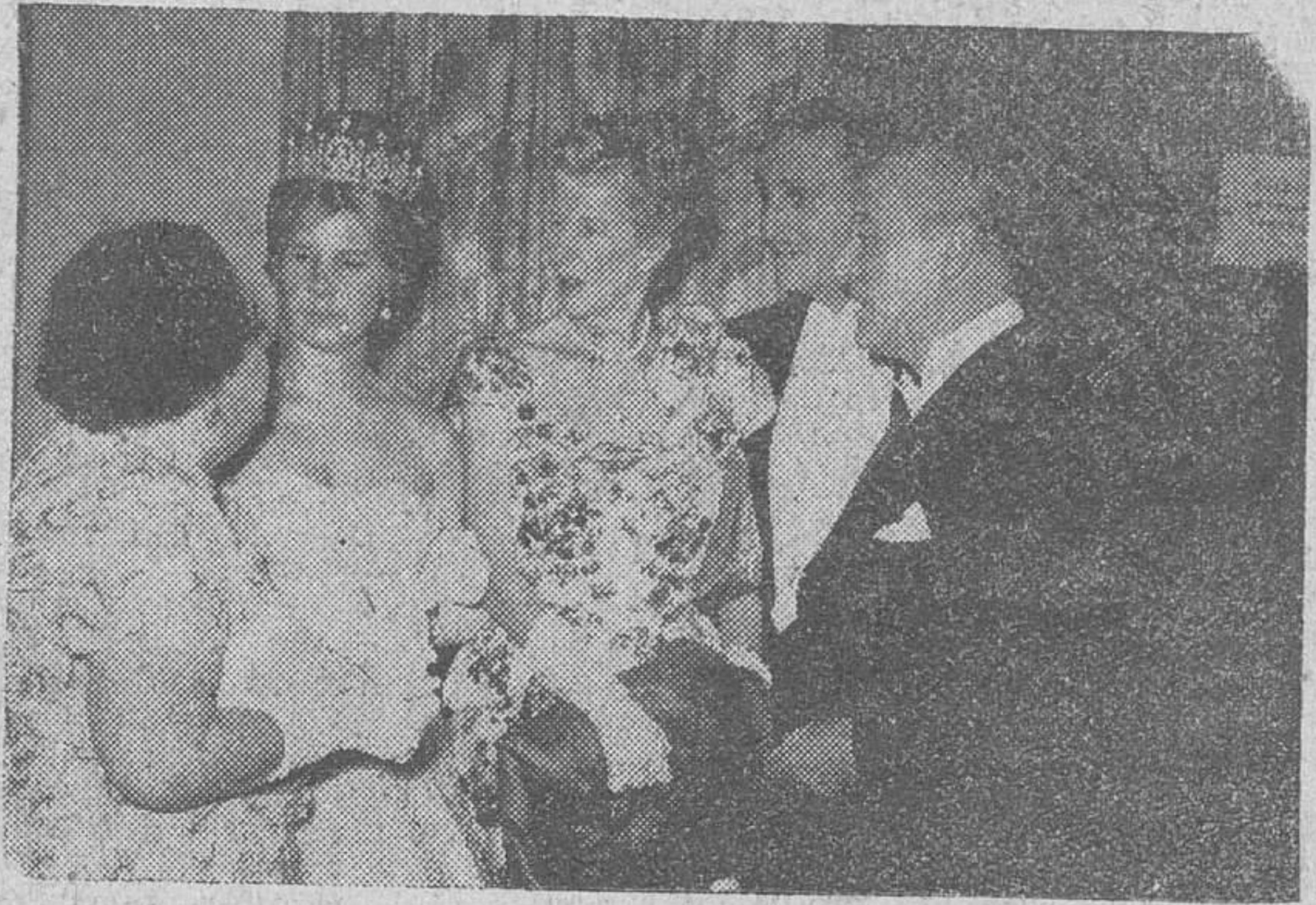
Los Duques de Alba en el baile de caridad de la Imperial Chrysler

Sin embargo, el ministro ha declarado a los periodistas que todas las localidades de la provincia están en manos del Gobierno y que las emisoras rebeldes operan desde territorio argentino. LO QUE DICEN LOS REBELDES Buenos Aires. — Una emisora de radio paraguaya, escuchada en Buenos Aires, daba instrucciones a los comandantes de las fuerzas revolucionarias para que dieran los pasos necesarios para garantizar las libertades de las áreas liberadas. Añadía la emisora que se han iniciado en las 120 primeras horas, todos los objetivos propuestos y que la primera guerrilla compuesta por miembros se había unido a la 27 columna rebelde que opera contra las fuerzas del Gobierno paraguayo.