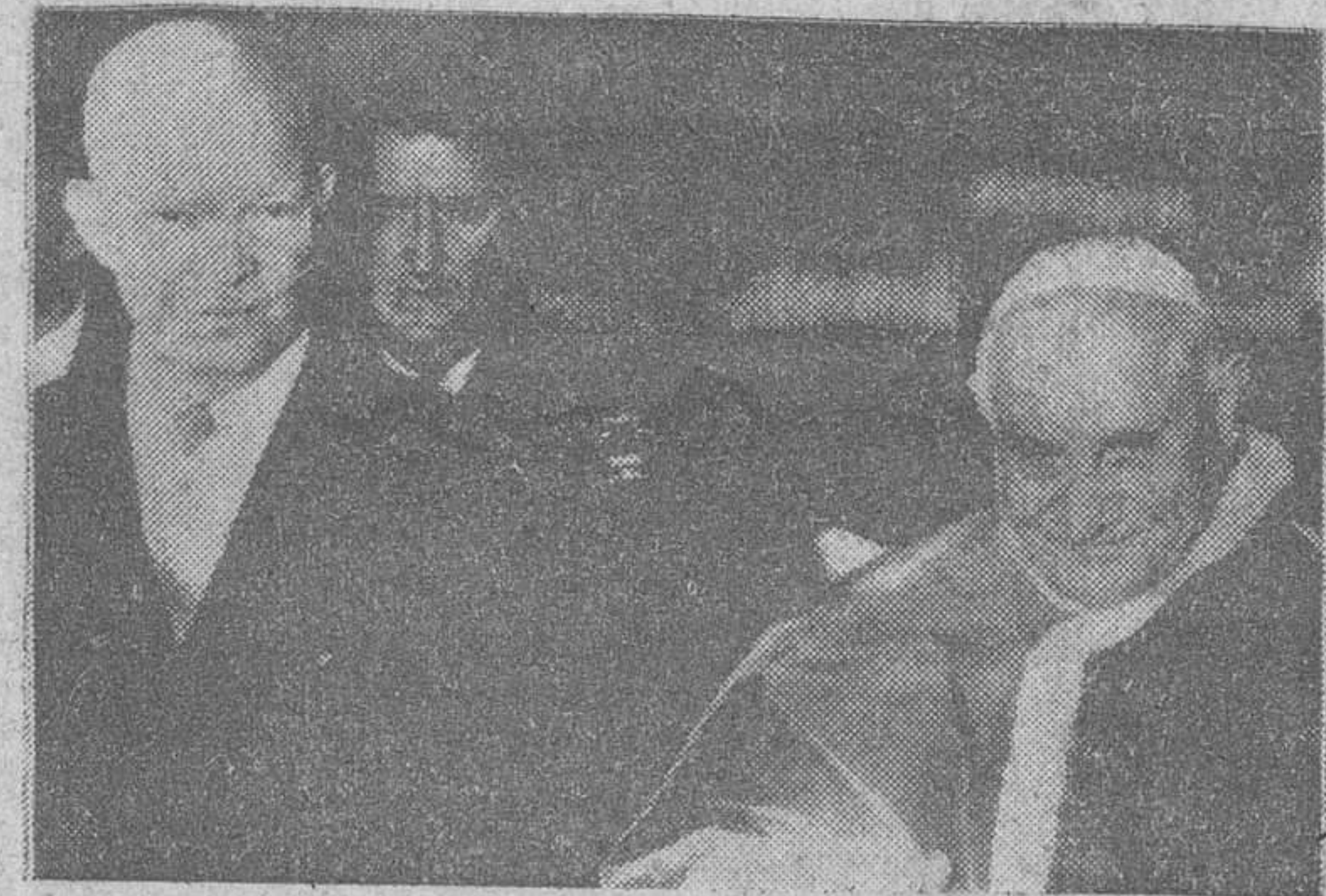
El Papa y el presidente Eisenhower

Bonn.—El magnate industrial alemán, Alfred Krupp von Bohlen und Halbach realizará una visita de cuatro días a España a partir del viernes próximo, en la que participará en una cacería como invitado del marqués de Bolaque, embajador español en esta capital.—Efe.