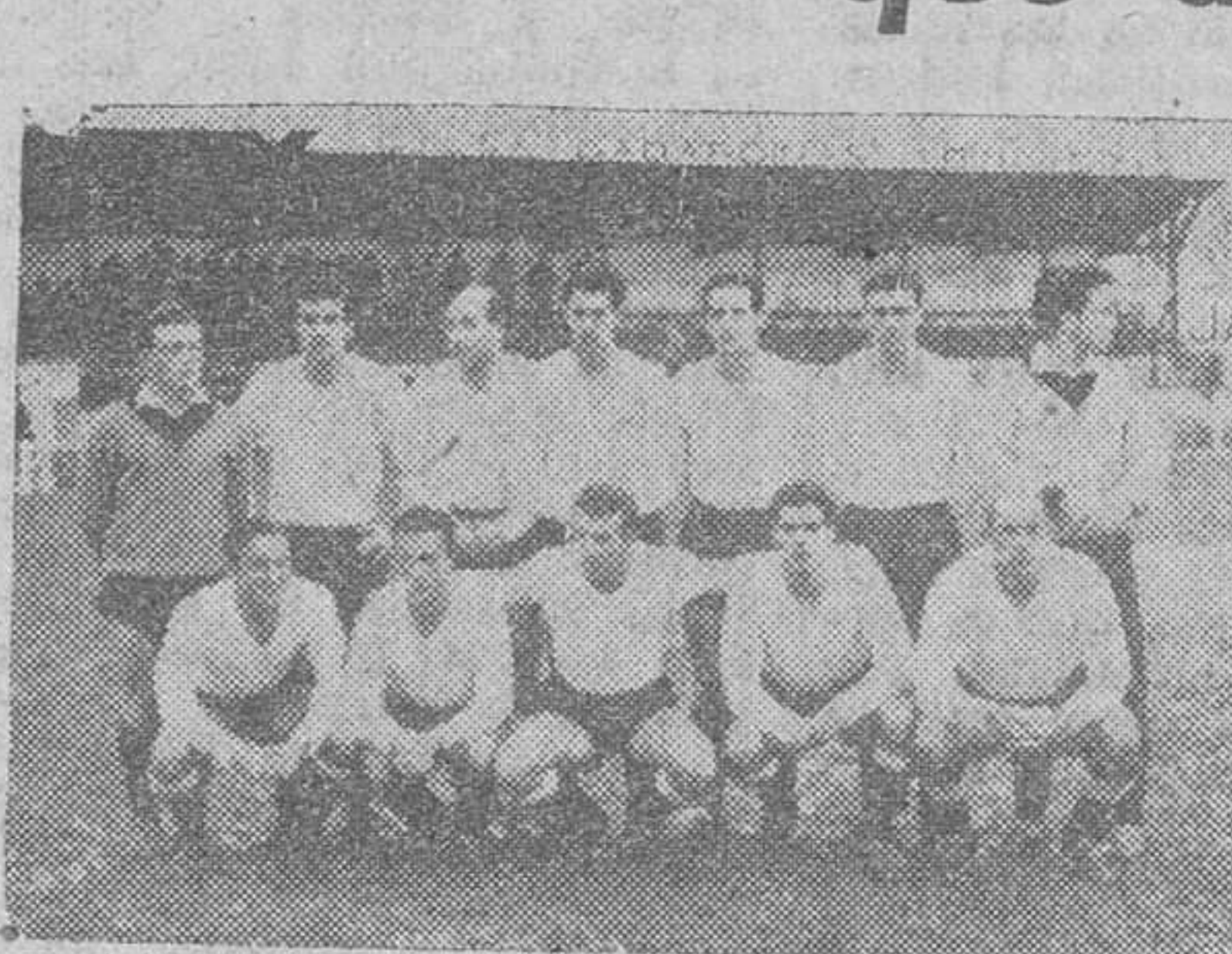
El Juventud hizo un gran partido anteayer frente a la Unión Deportiva Salamanca, cuyo equipo figura en nuestra primera fotografía. La segunda recoge uno de los numerosos momentos de agobio por que pasó la meta forastera durante todo el primer tiempo del encuentro.

Y magnífica actuación del once local en el que destacaron Herrera y Guti