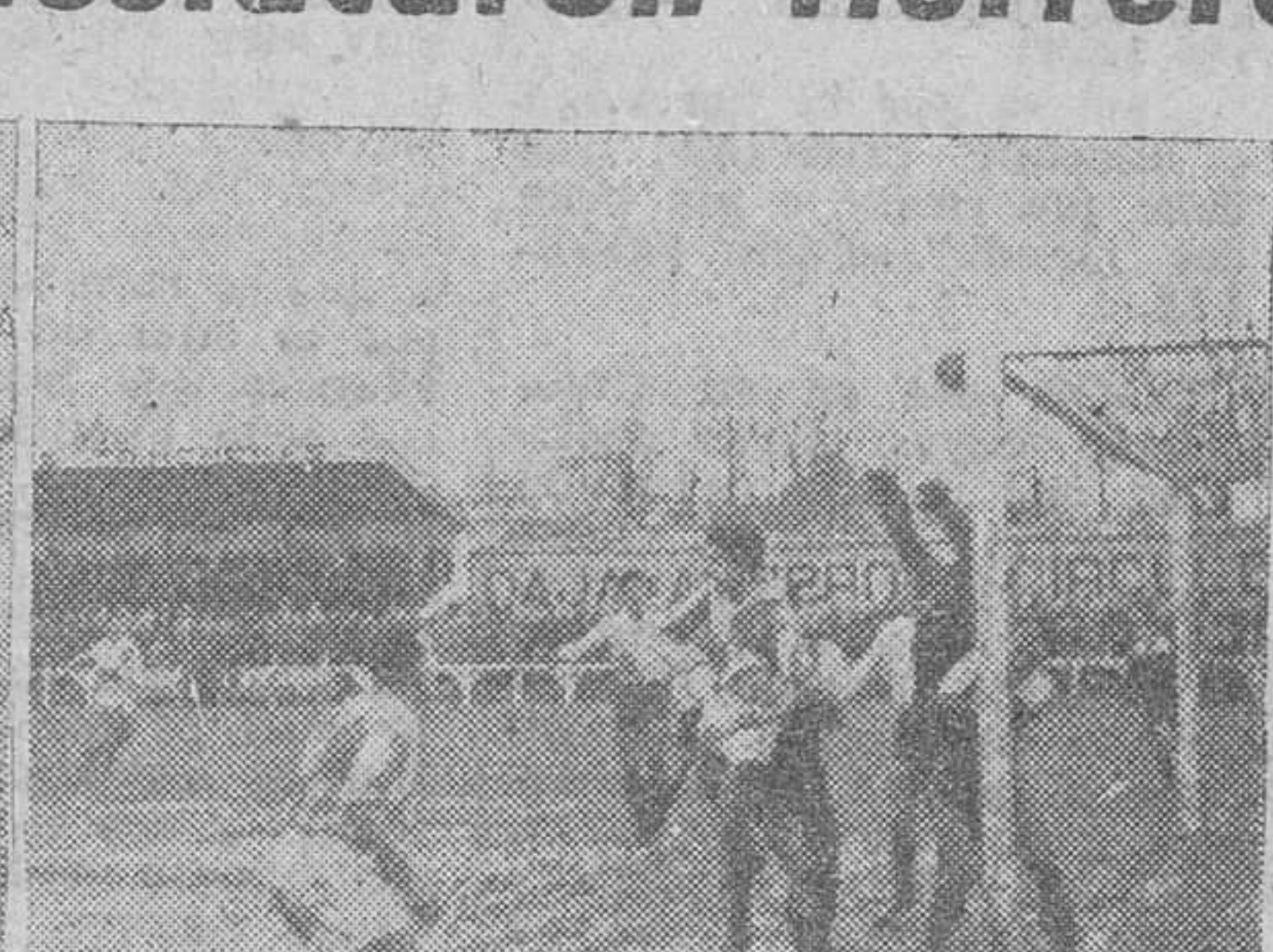
El Juventud hizo un gran partido anteayer frente a la Unión Deportiva Salamanca, cuyo equipo figura en nuestra primera fotografía. La segunda recoge uno de los numerosos momentos de agobio por que pasó la meta forastera durante todo el primer tiempo del encuentro.

Hacia ya mucho tiempo que no vivíamos la emoción del domingo en Zatorre. Vimos dos conjuntos, más técnico y veterano el uno, más entusiasta y arrollador el otro — disputar una victoria que cualquiera de los dos pudo haber conseguido pero que al fin compartieron ambos instantes, después de mantener imbatidas las metas respectivas.