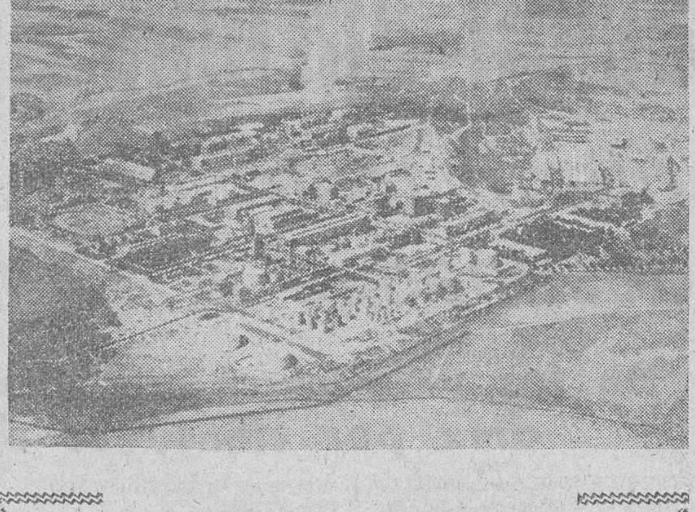
Puertollano.— Vista aérea del complejo industrial de la Empresa Nacional "Calvo Sotelo" donde ayer fue inaugurada una fábrica de fertilizantes.— (Foto Cifra)